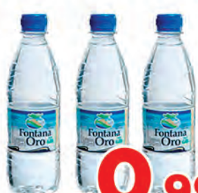
Água Fontana 500ml s/gás