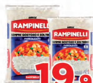
Arroz Rampinelli Parb. Pc 5kg