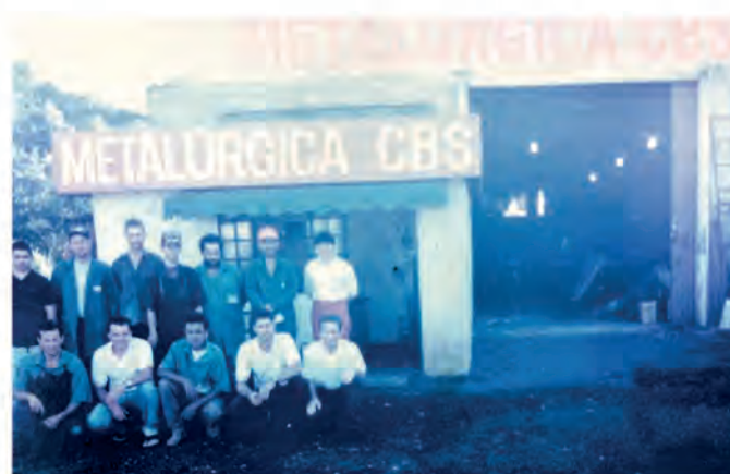
Rua Princesa Isabel Morumbi