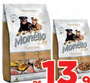
Ração Monello Tradicional 1kg