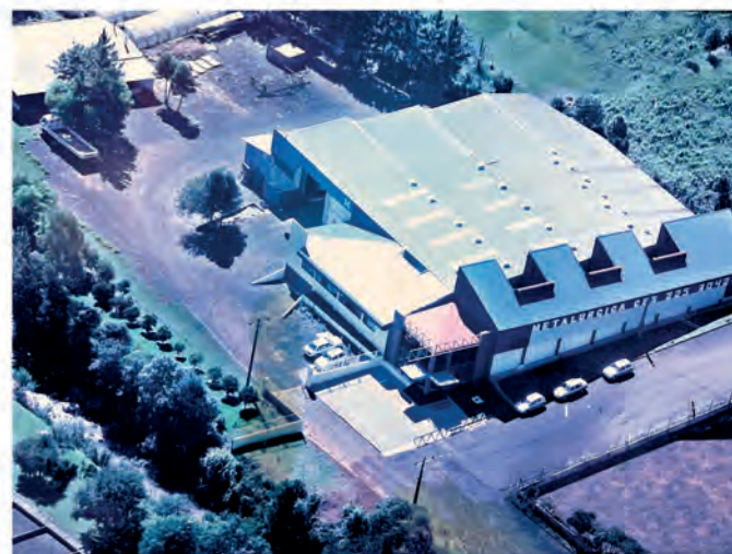
Rua Getulio Dalpasqualle Parque Industrial