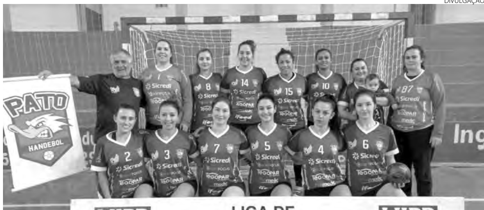
A equipe feminina vai estreiar no sábado contra Toledo

domingo, às 11h30, o confronto será diante do Campo Mourão. Já o plantel feminino enfrenta no sábado, às 16h30, a equipe da casa, Toledo; e no domingo, às 8h30, o confronto será contra Jardim Alegre. (AB com assessoria)