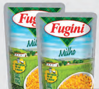
Milho Verde Fugini Sachê 170g