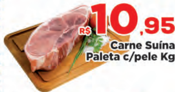
Linguicinha Moda Gaúcha Miolar Kg