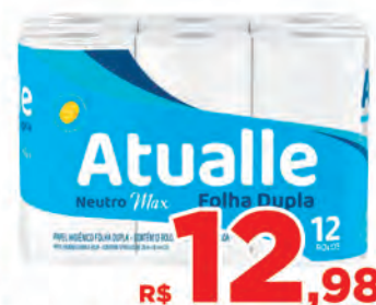
Papel Hig. Atualle 20 Metros c/12 Rolos