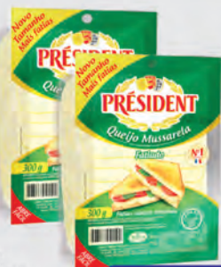
Queijo Mussarela President Fatiado 300g