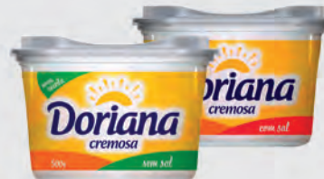
Margarina Doriana Tradicional c/ e s/ Sal 500g