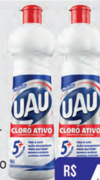
Limpador Multiuso UAU Cloro Ativo 5 Benefícios 500ml