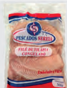
Filé de Tilápia Sereia 500g