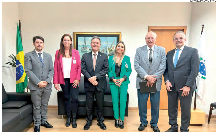
Prefeita de Clevelândia esteve recentemente em contato com a direção do TJPR

Naquela ocasião, foi destacado que um novo fórum é uma demanda de pelo menos 20 anos da comunidade de Clevelândia. A comarca também atende as necessidades do município de Mariópolis.