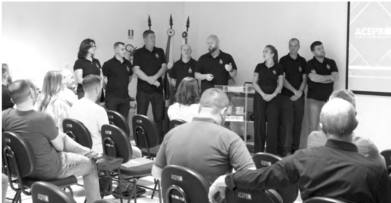
Palestra aconteceu na última quarta-feira (22)