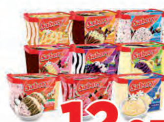
Sorvete Sabory 1.5 Litro