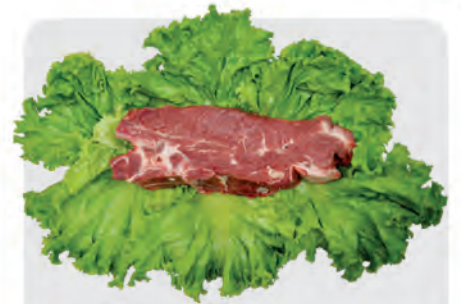
Filé Agulha Bovino Kg