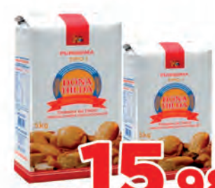
Farinha de Trigo Dona Hilda Pc 5kg