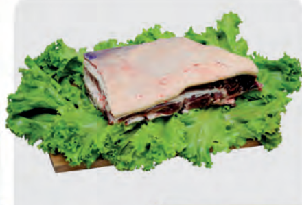
Costela Minga Bovina Kg