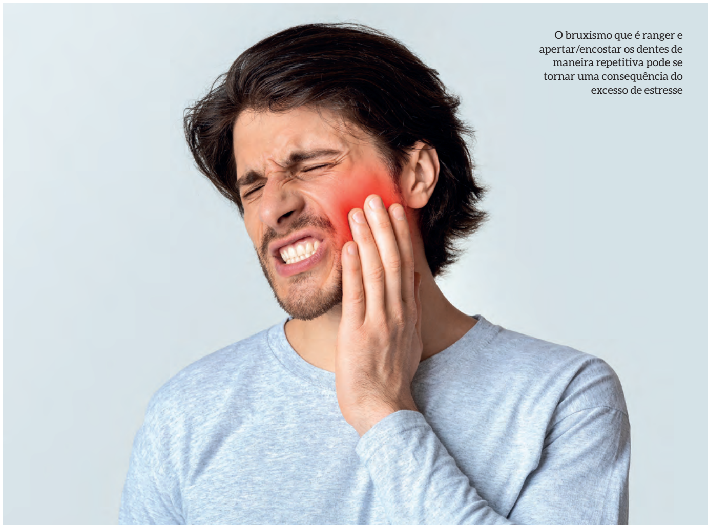
O bruxismo que é ranger e apertar/encostar os dentes de maneira repetitiva pode se tornar uma consequência do excesso de estresse

R.: Primeiro é importante saber que o Bruxismo é a atividade dos músculos mastigatórios podendo ser involuntária (sono) ou não (vigília). Caracterizado por ranger e apertar/encostar