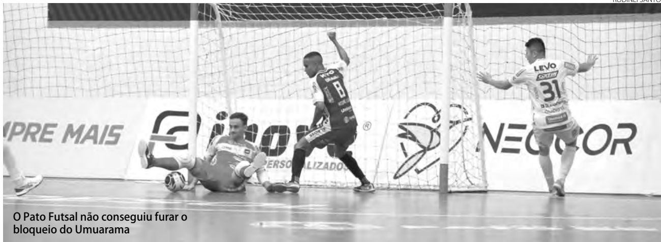
O Pato Futsal não conseguiu furar o bloqueio do Umuarama