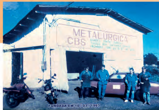
Rua Genuino Piacentini Santa Terezinha