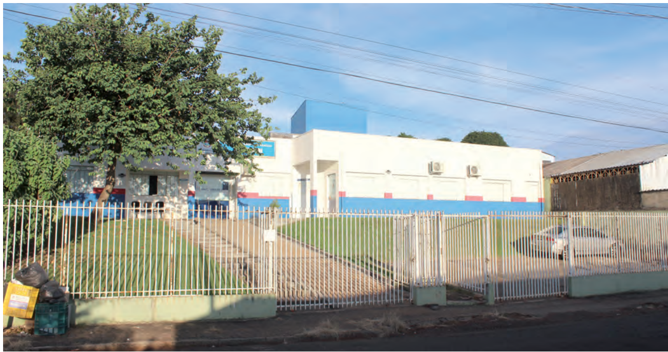
Em sendo deflagrada a greve, atendimentos poderão ser prejudicados

Contudo, a categoria que é considerada essencial, deve manter pelo menos o coeficiente mínimo de tra-