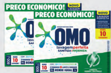
Sanitiza Roupas Omo Lavagem Perfeita 800g