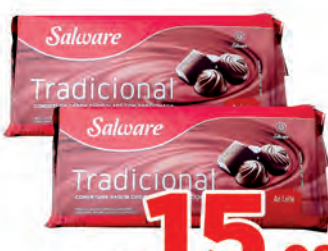
Barra de Chocolate Salware 1kg