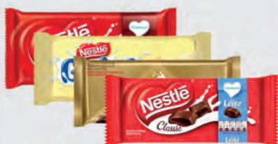
Chocolate Barra Nestlé 80g Vários