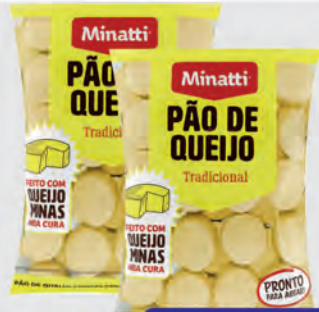
Pão de Queijo Minatti 1Kg Tradicional