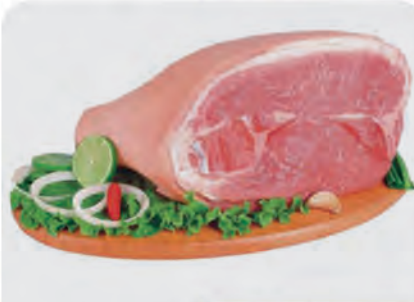
Pernil Suíno c/ Pele Kg