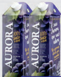
Suco de Uva Aurora Tinto TP 1,5l