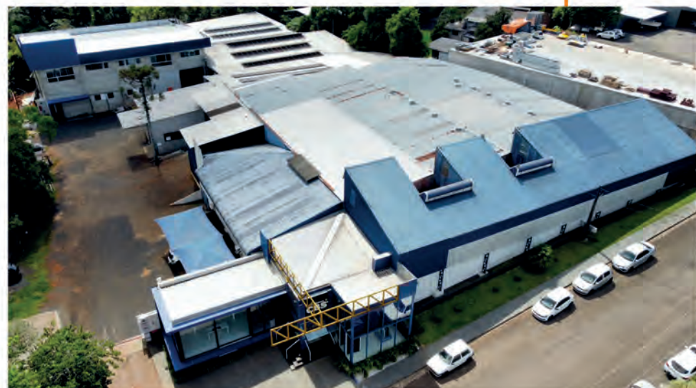
Atual - Rua Getulio Dalpasqualle Parque Industrial