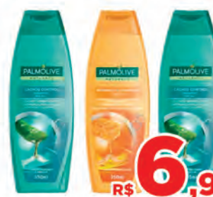
Shampoo Palmolive 350ml