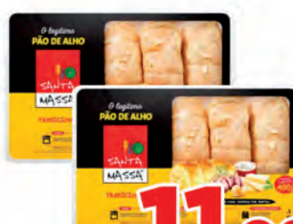
Pão de Alho Santa Massa 400g