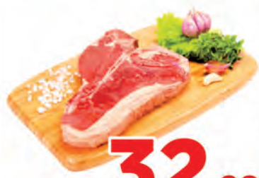
Carne Bovina Filé Duplo c/osso