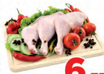
Coxa Sobre Coxa Especial Congelada Kg