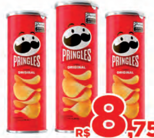
Batata Pringles 113g