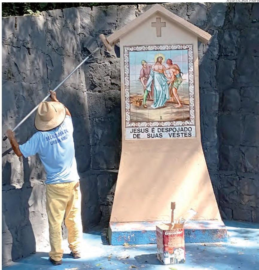
A Prefeitura de Francisco Beltrão está realizando o trabalho de revitalização e melhorias no Morro do Calvário. Também está sendo revitalizado o acesso a imagem do Cristo