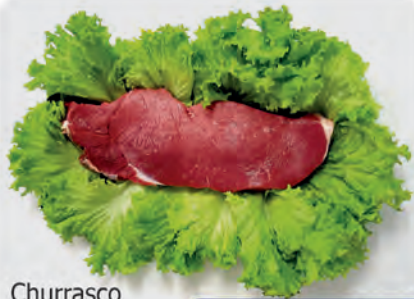
Churrasco Americano s/ Osso Bovino Kg