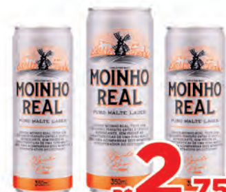
Cerveja Moinho Real Lata 350ml