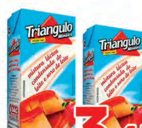
Mist. Leite Condensado Triangulo 395g