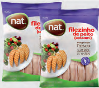
Filezinho Peito Frango Sassami Nat 1Kg