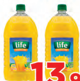
Suco Life 2 Litros