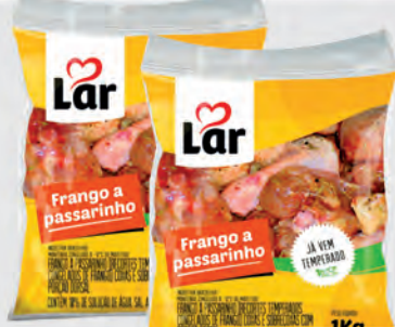
Frango a Passarinho Lar 1Kg