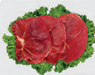
Bife Patinho Bovino Kg