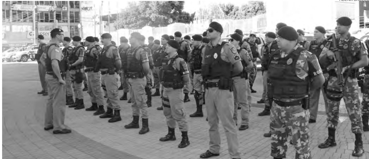
A operação começou na sexta-feira e prosseguirá até domingo

O comandante do 3º BPM de Pato Branco, tenente-coronel He-