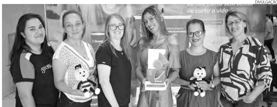
Atividade premiada foi a Fábrica de sabonete líquido

O "Fábrica do Sabonete Líquido" foi realizado por meio do Programa de Educação "A União Faz a Vida", ligado a cooperativa de crédito, e iniciou no segundo semestre de 2021. O projeto contou com algumas etapas, como de recolher os pedaços de sabonete que ficavam no banheiro; deixar secar; ralar; separar as cores; fazer as misturas e observar o processo durante dias; fazer um rótulo com nome do produto e informações para o consumidor; analisar valores; preparar uma feira e por fim, ir ao cinema.