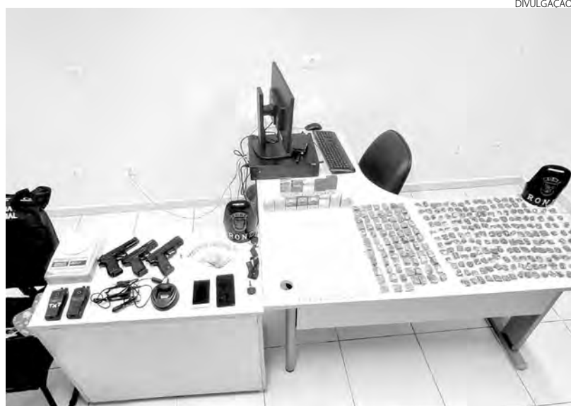
As drogas e demais objetos que estavam com os acusados do roubo

Segundo a PM, foram apreendidos três simulacros de pistola, duas capas de coletes, dois rádios de comunicação, 1,422 Kg de maconha, 373 gramas de cocaína, R$ 620,00 em espécie e dois veículos, sendo um GM/Classic e um Fiat/Siena, de cor prata. Os presos foram encaminhados para as devidas providências. (AB)