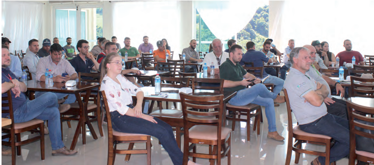
Com regionalização do torneio, expectativa é superar as 162 amostras coletadas em 2022

Concurso que por quatro edições foi direcionado a produtores da área do núcleo da Seab de Pato Branco, passa a abranger todo o Sudoeste