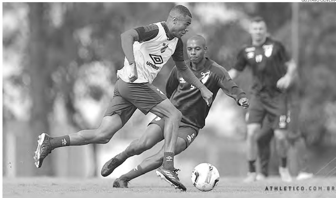
O Furacão treinou forte e quer abrir vantagem no primeiro jogo da decisão

Os trabalhos no campo foram encerrados para a primeira partida da decisão do Campeonato Paranaense. Na manhã de sexta-feira (31), a equipe principal do Athletico Paranaense realizou o treino apronto no CAT Caju para o primeiro desafio contra o FC Cascavel, que começa às 18h deste sábado (1º), no Estádio Olímpico Regional, em Cascavel. Quem vencer larga em vantagem na busca pelo título do Paranaense 2023. A partida de volta será no próximo domingo (9), às 17h, no Estádio Joaquim Américo.