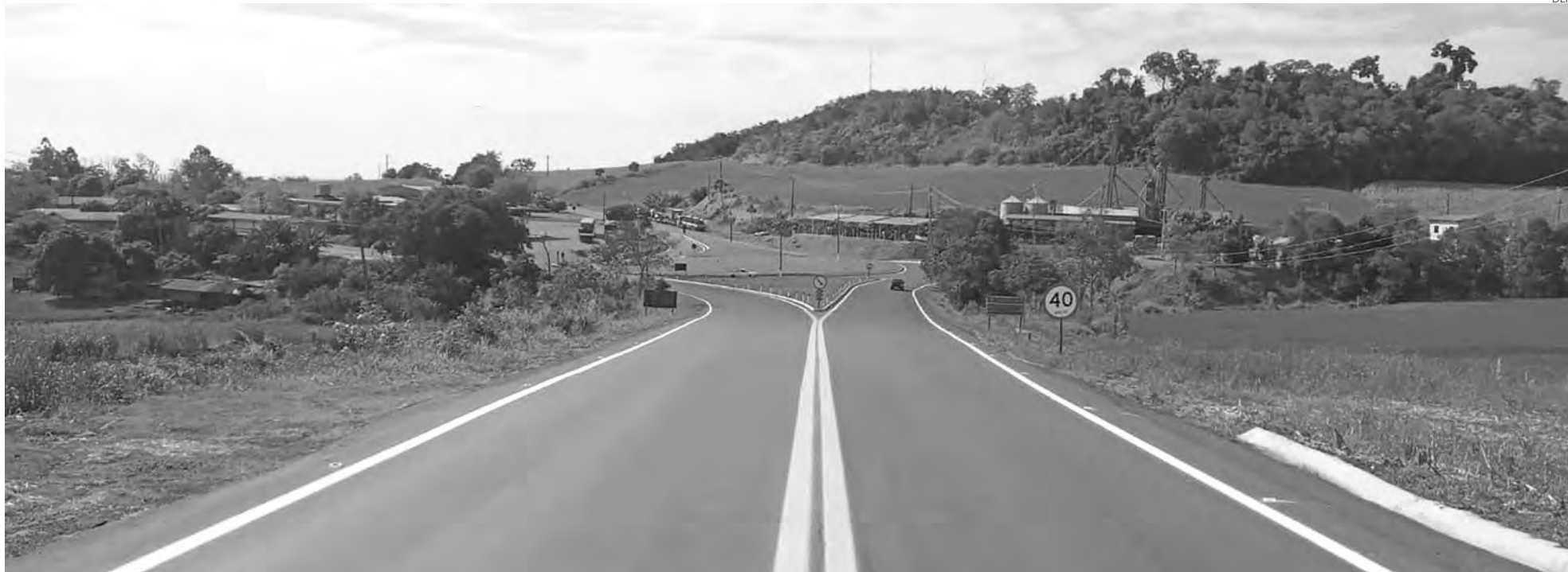
O trecho com sinalização reforçada tem uma extensão de 14 quilômetros, da BR-163, até a PR-583