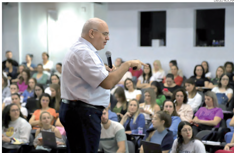
Evento aconteceu no Largo da Liberdade

“O objetivo do evento é oferecer reflexões acerca do cuidado com a pessoa