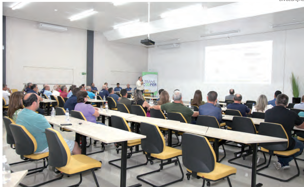
Assembleia contou com aproximadamente 70 cooperados

Com um retorno financeiro de R$ 329.730,50 aos cooperados fidelizados, o Programa Fidelização