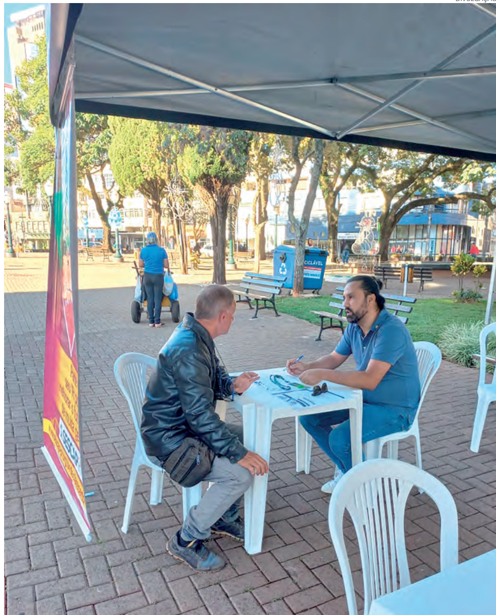
Profissionais relacionados ao Sescap permaneceram na praça ao longo do dia

O cidadão deve estar atento aos prazos para a entrega dos documentos para evitar multas.