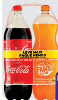
Refrigerante Kit Coca-Cola Trad. 2l + Fanta Laranja Trad. 2l