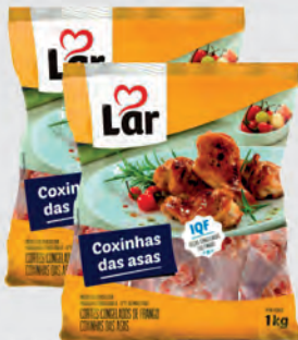
Coxinha da Asa de Frango Lar 1Kg