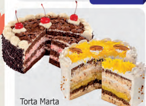
Torta Marta Rocha, Strogonof de Nozes e Floresta Negra Kg