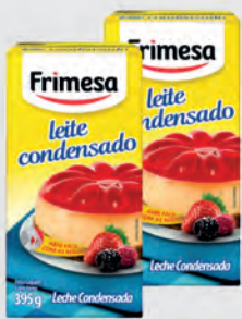
Leite Condensado Frimesa Tradicional 395g