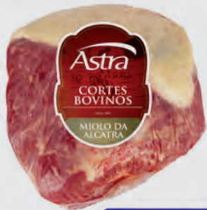
Miolo Alcatra Astra Bovino Kg