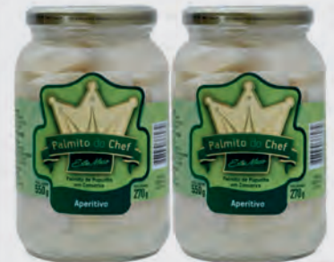
Palmito Do Chef Aperitivo 270g