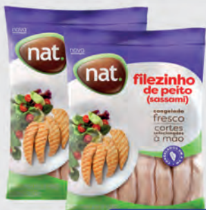
Filezinho Peito Frango Sassami Nat 1kg