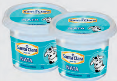
Nata Santa Clara 300g