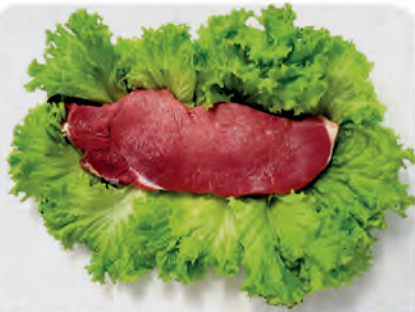
Churrasco Americano s/Osso Bovino Kg