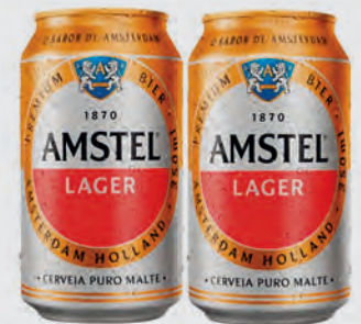
Cerveja Amstel Puro Malte Lata 350ml