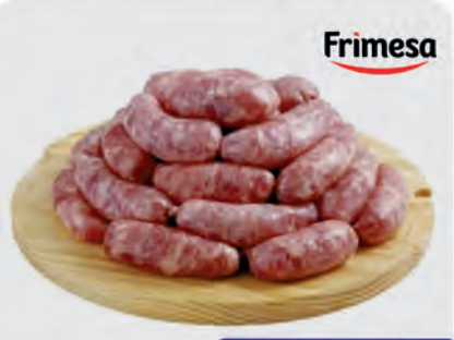
Linguiça Toscana Frimesa Kg