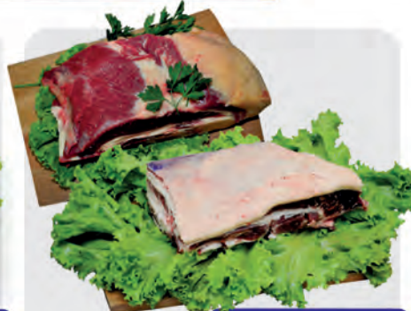
Costela Minga e Ponta de Peito Bovino Kg