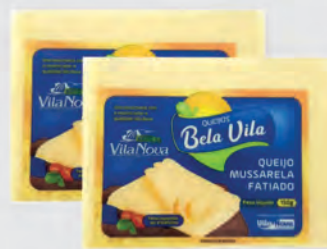
Queijo Mussarela Bela Vila Fatiado 150g