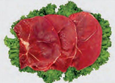
Bife Patinho Bovino Kg