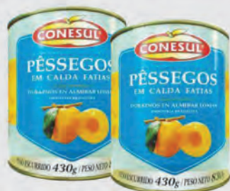
Pêssego em calda Conesul, Lata Fatias 430g