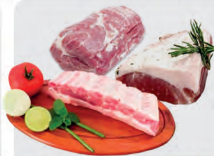
Picanha, Costela e Copa Suína Miolar Temperada Kg