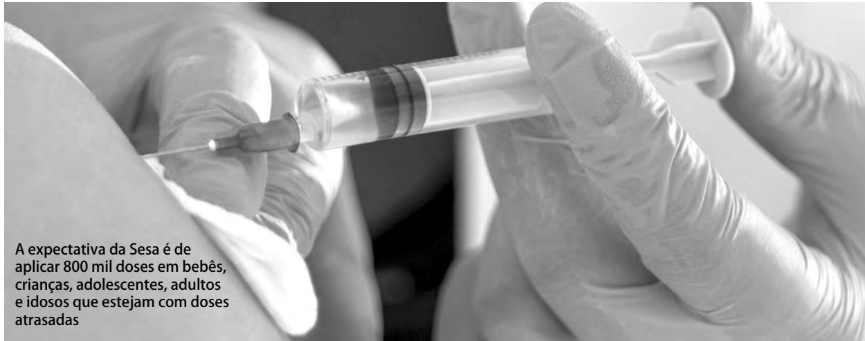
A expectativa da Sesa é de aplicar 800 mil doses em bebês, crianças, adolescentes, adultos e idosos que estejam com doses atrasadas