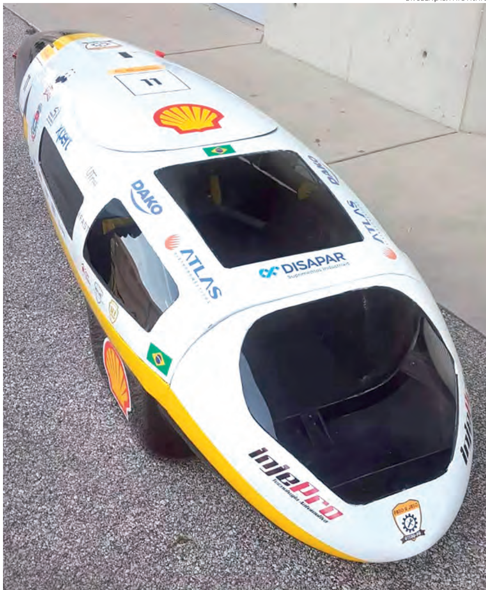
Protótipo construído para a competição

A competição teve início em 1939, em uma disputa