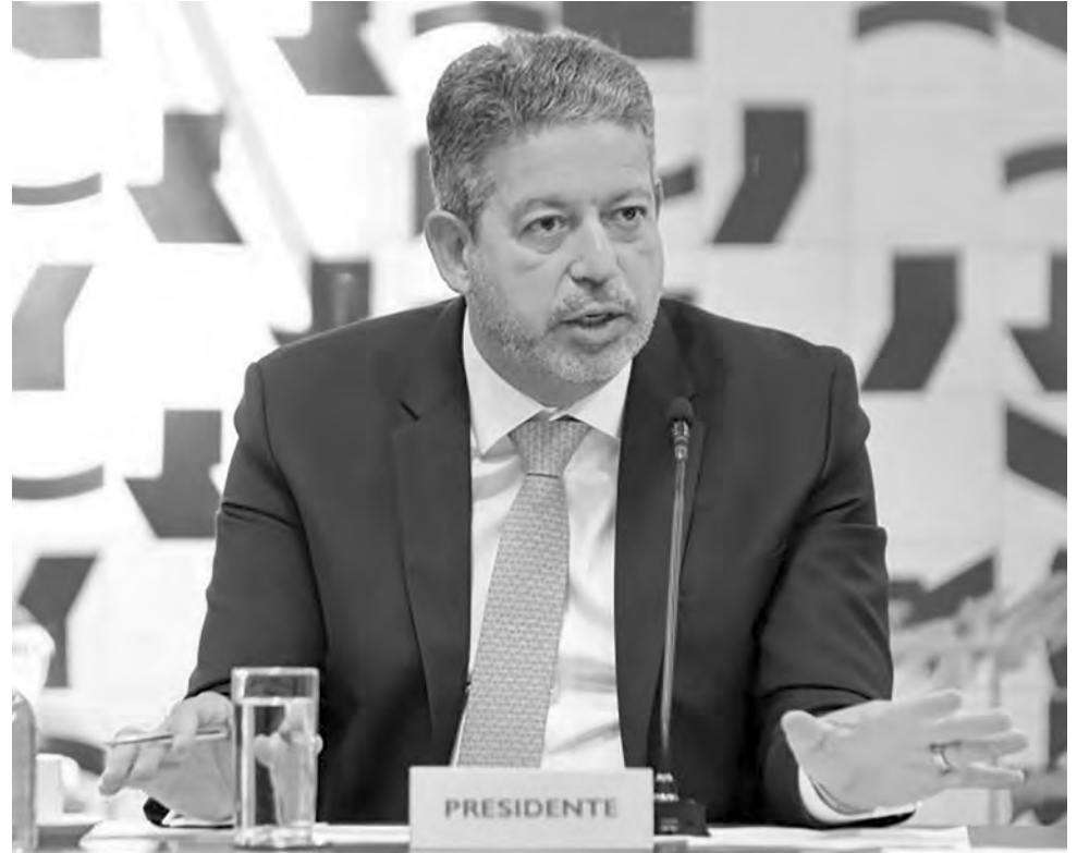
Lira: “A Câmara não tem criado nenhuma dificuldade para o governo”