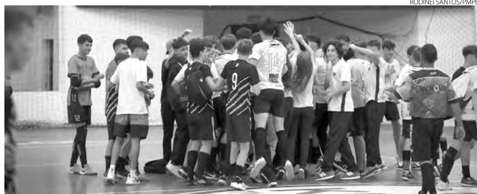
Jogos mobilizaram mais de 900 pessoas

Pato Branco será sede da fase macrorregional dos 69º Jogos Escolares do Paraná, entre os dias 7 a 11 de junho, recebendo mais de 900 pessoas, entre atletas e dirigente.