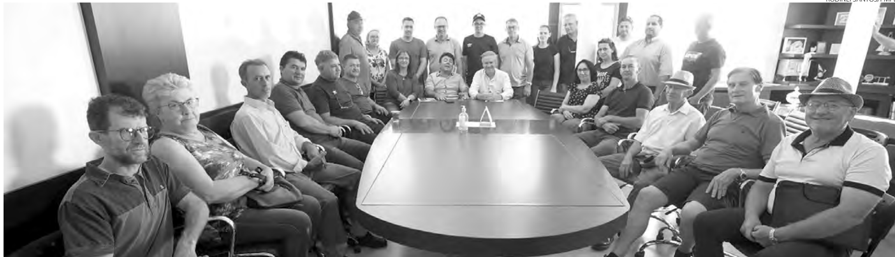
Encontro foi realizado na tarde de sexta-feira (14)

Redação com assessoria redacao@diariodosudoeste.com.br