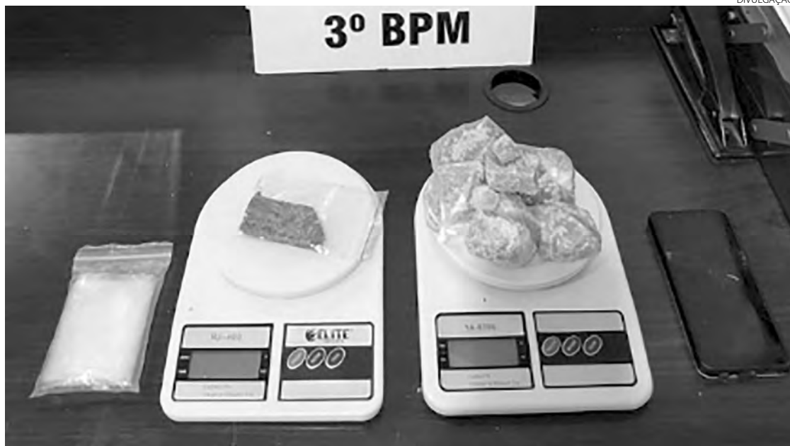
As drogas que foram apreendidas no bairro Galha Azul

Adenir Brocco ade@diariodosudoeste.com.br