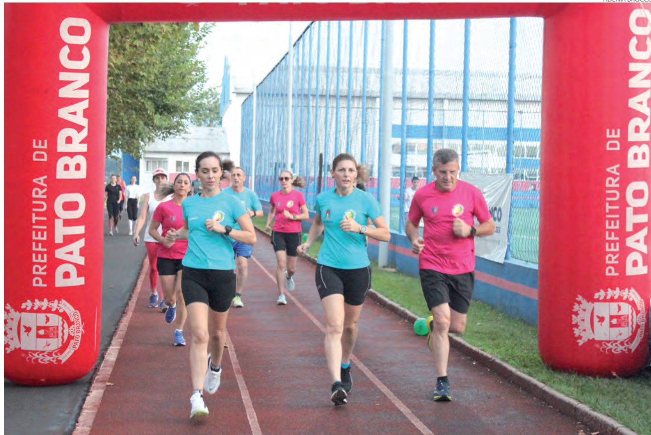
As atividades iniciaram na sexta-feira e prosseguem até às 18h deste sábado