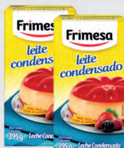
Leite Condensado Frimesa 395g