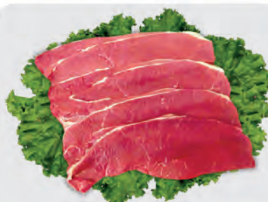
Bife Coxão Mole Bovino Kg