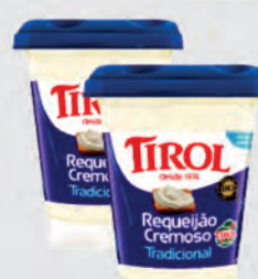
Requeijão Cremoso Tirol 180g