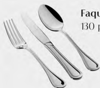
Faqueiro inox St James 130 peças