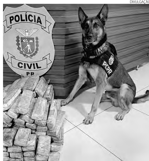
Ao todo, 16 animais fazem parte do Núcleo de Operações com Cães da PCPR

Os cães da Polícia Civil do Paraná (PCPR) colaboraram na apreensão de 10,3 toneladas de drogas em todo o Estado durante o ano de 2022. Estima-se que as ações tenham causado um prejuízo de R$ 1,1 milhão para o crime organizado.