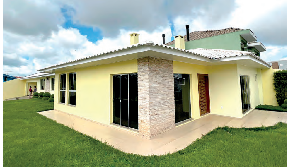
Espaço está localizado no Centro de Palmas