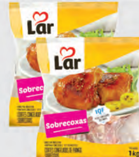
Sobrecoxa Frango Lar 1Kg