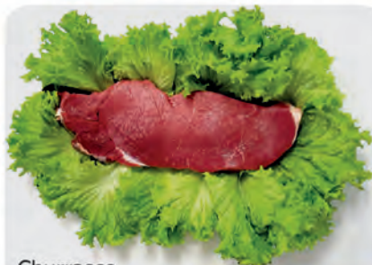
Churrasco Americano s/ Osso Bovino Kg