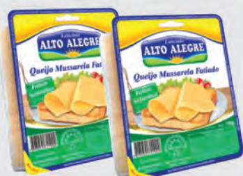
Queijo Mussarela Alto Alegre Fatiado 150g