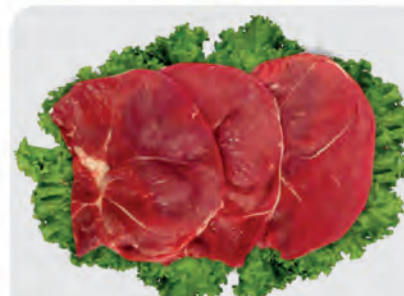
Bife Patinho Bovino Kg