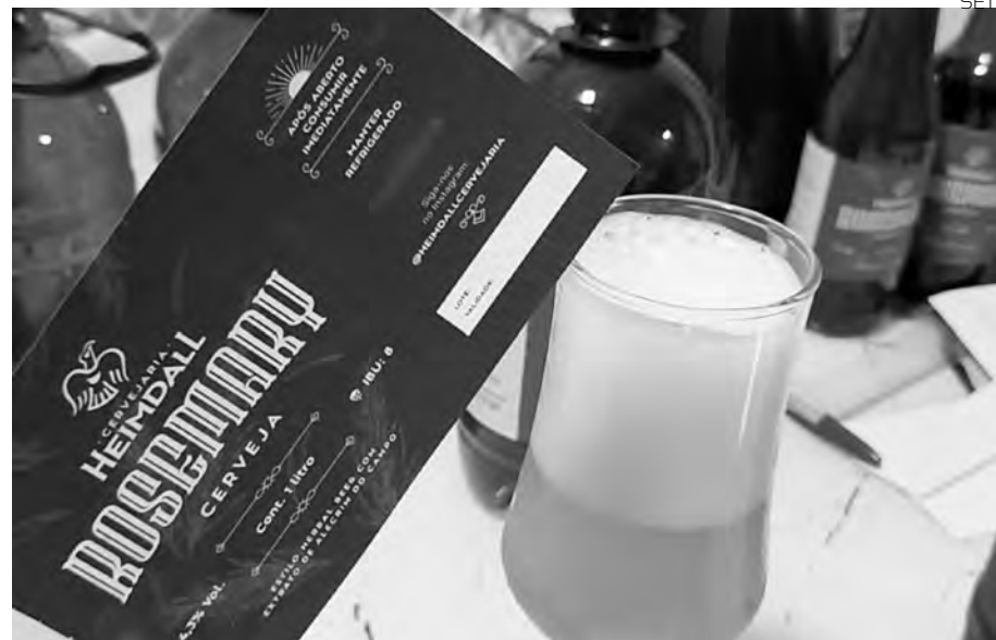
O contrato de licenciamento para comercializar a cerveja Rosemary foi assinado recentemente

O produto inovador é resultado de uma pesquisa desenvolvida no Laboratório de Biotecnologia e Ciências Biomédicas (Biomed), do campus do Centro