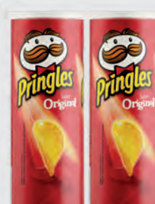
Batata Pringles Original 114g