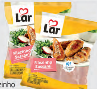
Filezinho Peito Frango Sassami Lar 1Kg