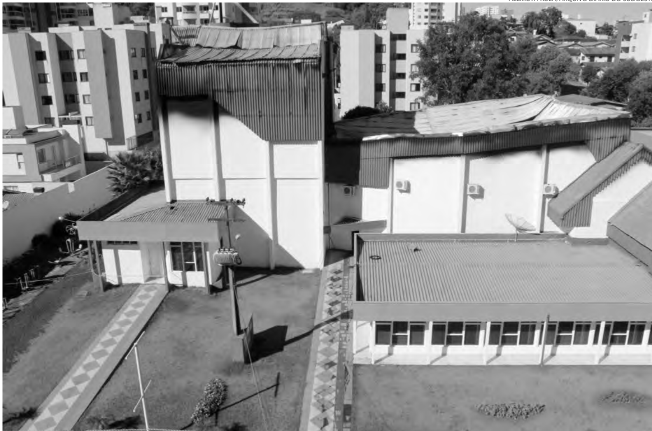
Estrutura do teatro pegou fogo em 2018