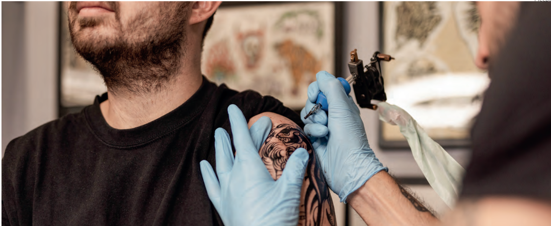
Os cuidados com a tatuagem recém-realizada devem considerar higiene, hidratação e proteção solar

Tatuador responde esta questão e dá dicas de como cuidar da tatuagem neste período