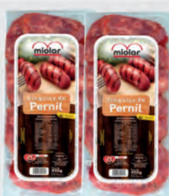
Linguixa Pernil Miolar 450g