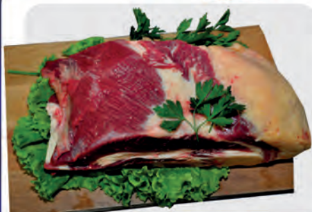
Ponta de Peito Bovina Kg