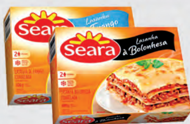
Lasanha Seara 600g