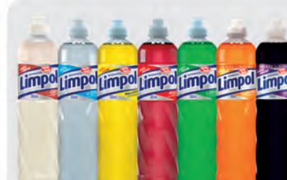
Detergente Líquido Limpol 500ml