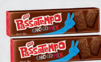
Biscoito Leite Passatempo Chocomix 150g