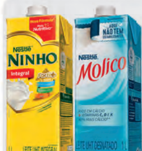
Leite Integral Tradicional Ninho 1L e Leite Desnatado Molico 1L