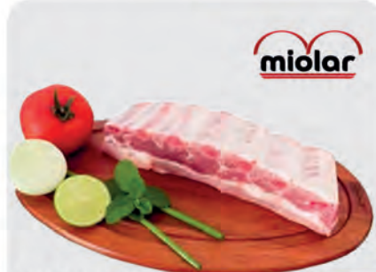
Costela Suína Miolar Temperada Kg