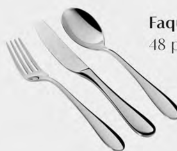
Faqueiro inox St James 48 peças