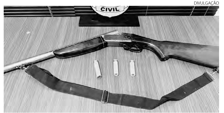
A espingarda que foi localizada na residência do investigado

O delegado Breno afirmou que, diante à gravidade dos fatos e repercussão social, a Polícia Civil representou pela prisão preventiva do investigado, que após parecer favorável do Ministério Público, foi concedido pelo Poder Judiciário. Durante o cumprimento da busca e apreensão domiciliar, os investigadores apreenderam no interior da