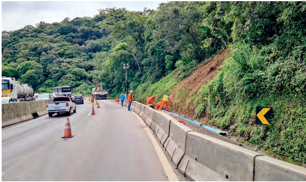
A previsão do DER é concluir a etapa de contenção emergencial da obra até 25 de fevereiro

Já no km 39, onde o escorregamento de terra foi de menor porte, começaram a ser implantados dispositivos de drenagem auxiliar, que irão evitar o bloqueio da drenagem de água da chuva no local, onde será executado um muro de solo-cimen-