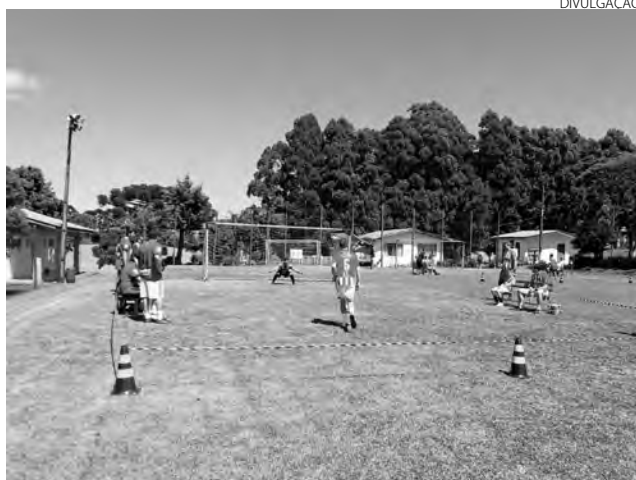
As semifinais e as finais serão disputadas no próximo dia 20

Já no masculino os jogos das semifinais serão entre Alianza x Corinthians e LZ x Medellín, com os vencedores da melhor de cinco partidas indo para a final e os perdedores vão disputar o terceiro lugar. Após as finais haverá a entrega da premiação e almoço de confraternização. (AB)