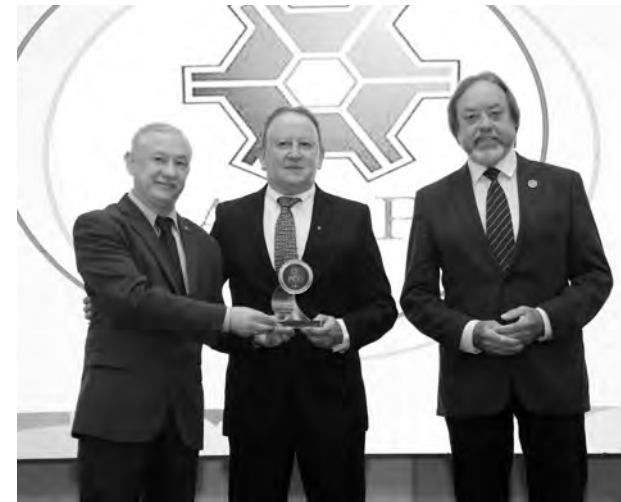
Região conquistou o primeiro e o segundo lugares com associações de agrônomos de Pato Branco e de engenheiros de Francisco Beltrão e prêmios para destaques individuais