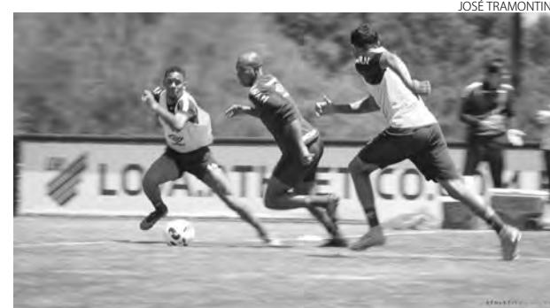
O Furacão quer se manter na zona de classificação para a Libertadores

Após a partida em Goiânia, a reapresentação geral do time ocorre na manhã de sexta-feira (11), no CAT Caju. A partir daí, serão mais duas sessões de treinos até a partida contra o Botafogo, às 16h de domingo (13), no Estádio Joaquim Américo, pela última rodada do Brasileiro. (Assessoria)