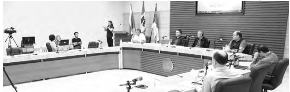
Valor debatido corresponde ao orçamento do próximo ano

Em comparação com o ano de 2022, são R$ 30 milhões a mais que entram no orçamento. A estimativa para as receitas e a fixação das despesas para 2023 é de R$ 530 milhões. A cifra será dividida entre todas as secretarias. Segundo o relator da comissão, em linhas gerais, o incremento do valor se dá pelo crescimento do próprio município. “Pato Branco cresce, consequentemente aumenta a arrecadação e as despesas. É um crescimento linear”, resume explicando que, embora não existam fatores excepcionais, a construção civil, por exemplo, foi um setor que contribuiu para o aumento das receitas. No caso das despesas, ele argumenta que pesa o fato de o município ter chamado novos servidores concursados e ter concedido atualização salarial. Segundo ele, são ações que não fogem das regras ou da responsabilidade