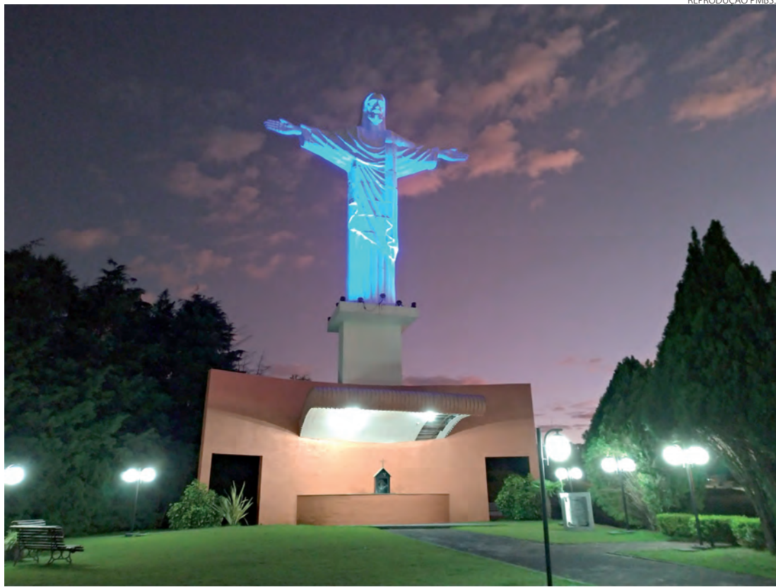
Um dos cartões-postais de Bom Sucesso do Sul, o Cristo da Luz