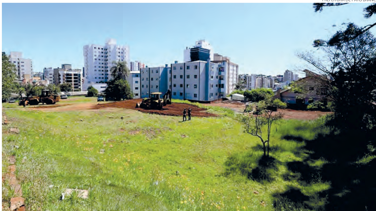
Vila do Noel está sendo montada na rua Tocantins

Após a inauguração do Natal 2022, o município de Pato Branco contará com atividades diárias gratuitas para a população, até o dia