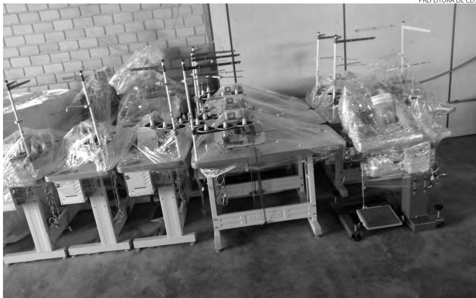
Aproximadamente R$ 750 mil foram investidos