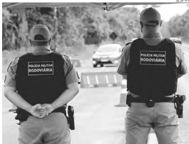
A média foi de 1.230 autuações por dia nos mais de 12 mil quilômetros de rodovias estaduais do Paraná

O batalhão também atuou no combate à embriaguez ao volante. Para isso, realizou 24.592 testes com etilômetro, que resultaram em 250 prisões por embriaguez ao volante e recolhimento de veículos.