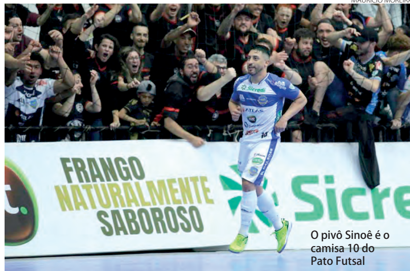
O pivô Sinoê é o camisa 10 do Pato Futsal

O Pato Futsal definiu na terça-feira (10) a numeração das camisas dos jogadores para a disputa das competições da temporada 2023. A equipe pato-branquense tem presença confirmada na Supercopa de Futsal, na Copa do Brasil Sicredi, na Liga Nacional de Futsal, na Série Ouro do Campeonato Paranaense e na Copa Paraná de Futsal. Em caso de título na Supercopa, o Pato Futsal também irá disputar a Libertadores da América.