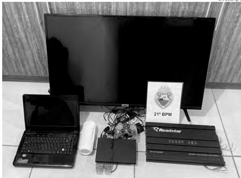
Os objetos recuperados pela Polícia Militar em Marmeleiro

A Polícia Militar comunicou a vítima sobre a recuperação dos seus bens, que ainda não tinha percebido a falta de alguns objetos recuperados pela equipe policial. Os envolvidos e os produtos foram encaminhados à Delegacia da Polícia Civil de Francisco Beltrão para as providências cabíveis ao fato. (AB)