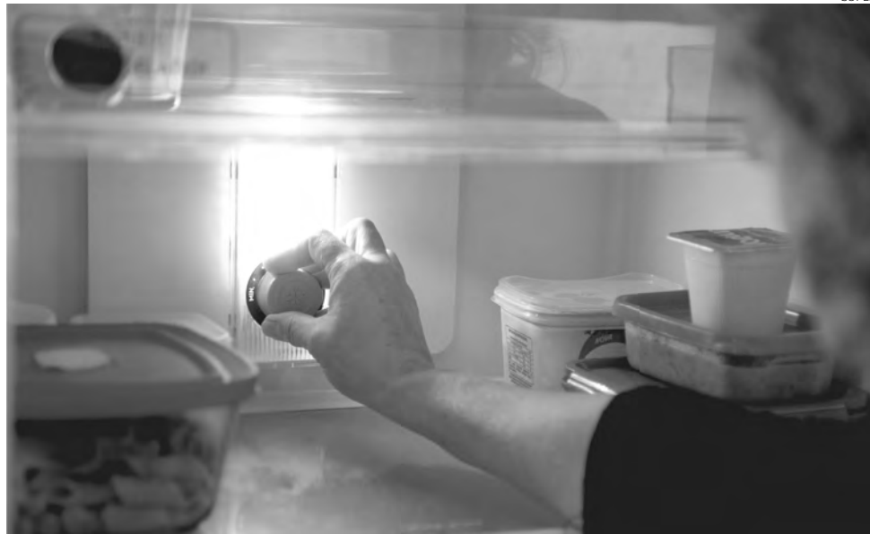
Cuidados auxiliam na redução da conta de energia