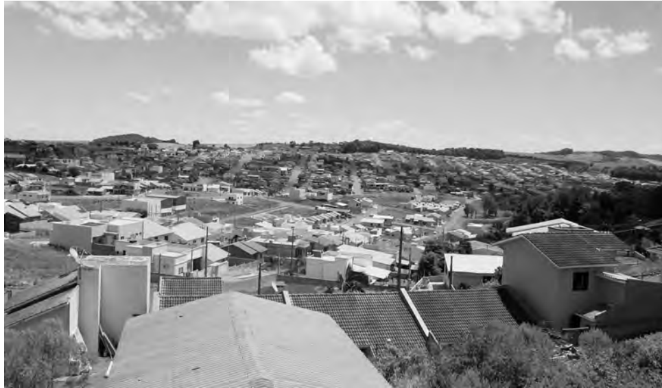
Um dos problemas estaria na região de divisa com São Lourenço do Oeste

Vitorino, que no último censo, em 2010, tinha 6.513 habitantes, está entre os municípios que aguarda o resultado do levantamento com expectativa, pois