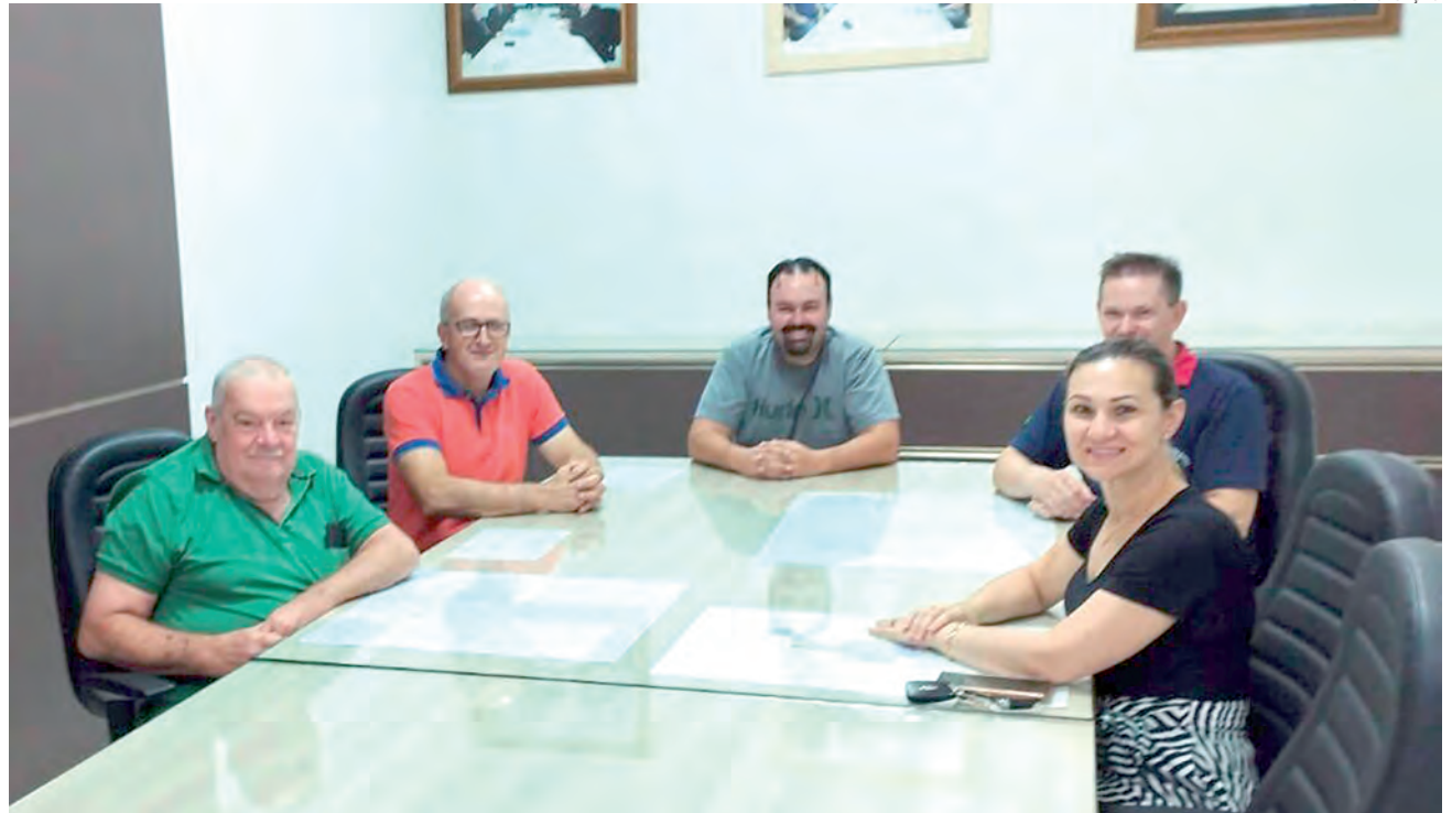
Centro de Cultura começou a ser idealizado em 2014