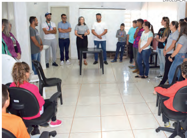
São dois Laboratórios de informática que foram inaugurados

O prefeito Luciano Dias comentou que além desses 20 equipamentos, outros 20 também foram conquistados para a Escola Municipal Maria Francisca dos Santos. "Estamos muito felizes em poder tornar realidade mais essas ações que trarão benefício direto para a população", comentou Dias ao afirmar que o investimento do Governo Estadual do Plano de Apoio ao Desenvolvimento dos Municípios (PAM) de 2022, quando por intermédio do presidente da Assembleia Legislativa do Paraná (Alep), Ademar Traiano foi destinado cerca de R$ 200 mil.