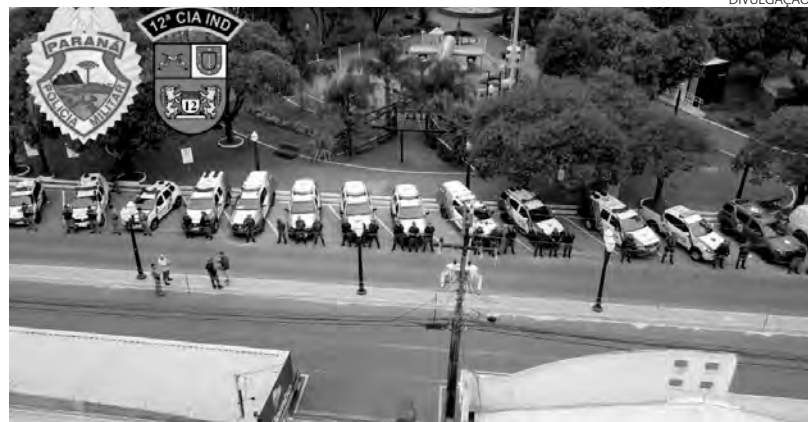
Os policiais estão averiguando cerca de 70 denúncias de crimes ambientais

Os policiais também estão averiguando as denúncias em outros municípios da área de abrangência da 12ª Companhia Independente de Palmas. Ao final da operação, serão divulgados todos os dados sobre a constatação de crimes ambientais. (AB)