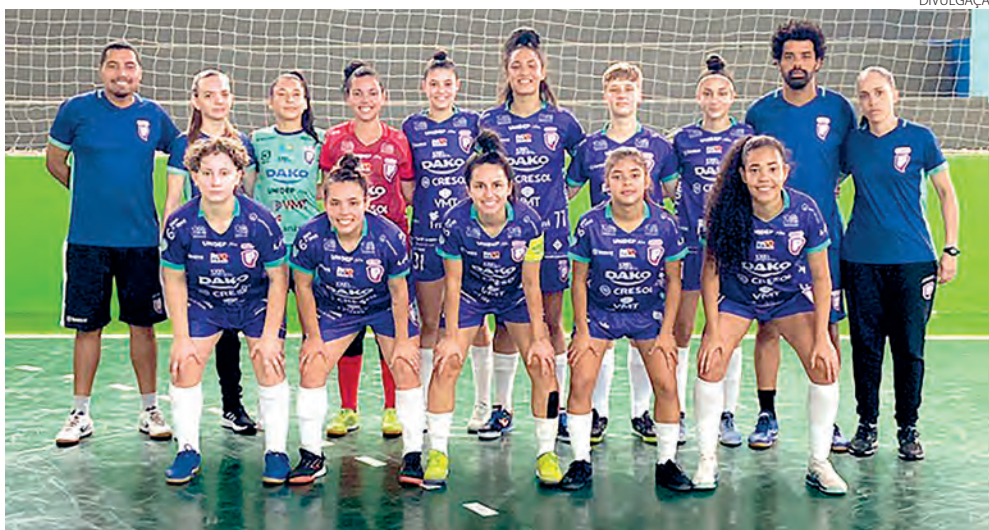
A equipe pato-branquense ficou em 2º lugar na primeira fase do Estadual Sub-20