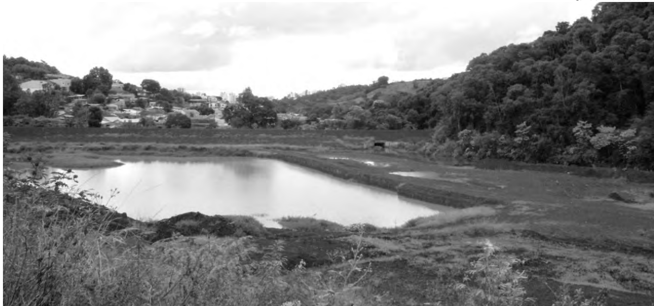
Obra da Bacia de Contenção do Bonatto está parada desde 2018