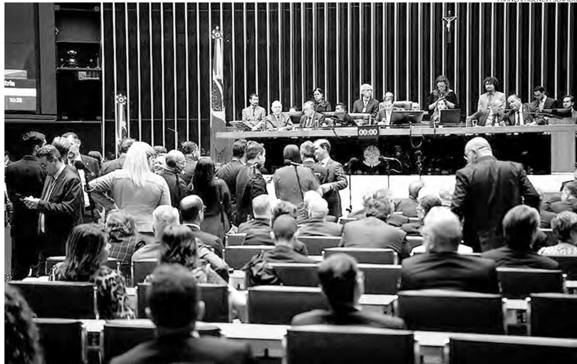
Sessão solene do Congresso Nacional marcou a apresentação da 28ª edição da Agenda Legislativa da Indústria

O líder industrial fez um apelo para que o governo e o Parla-