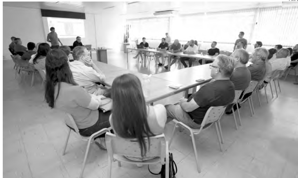
Reunião foi realizada em duas etapas

Redação com assessoria redacao@diariodosudoeste.com.br