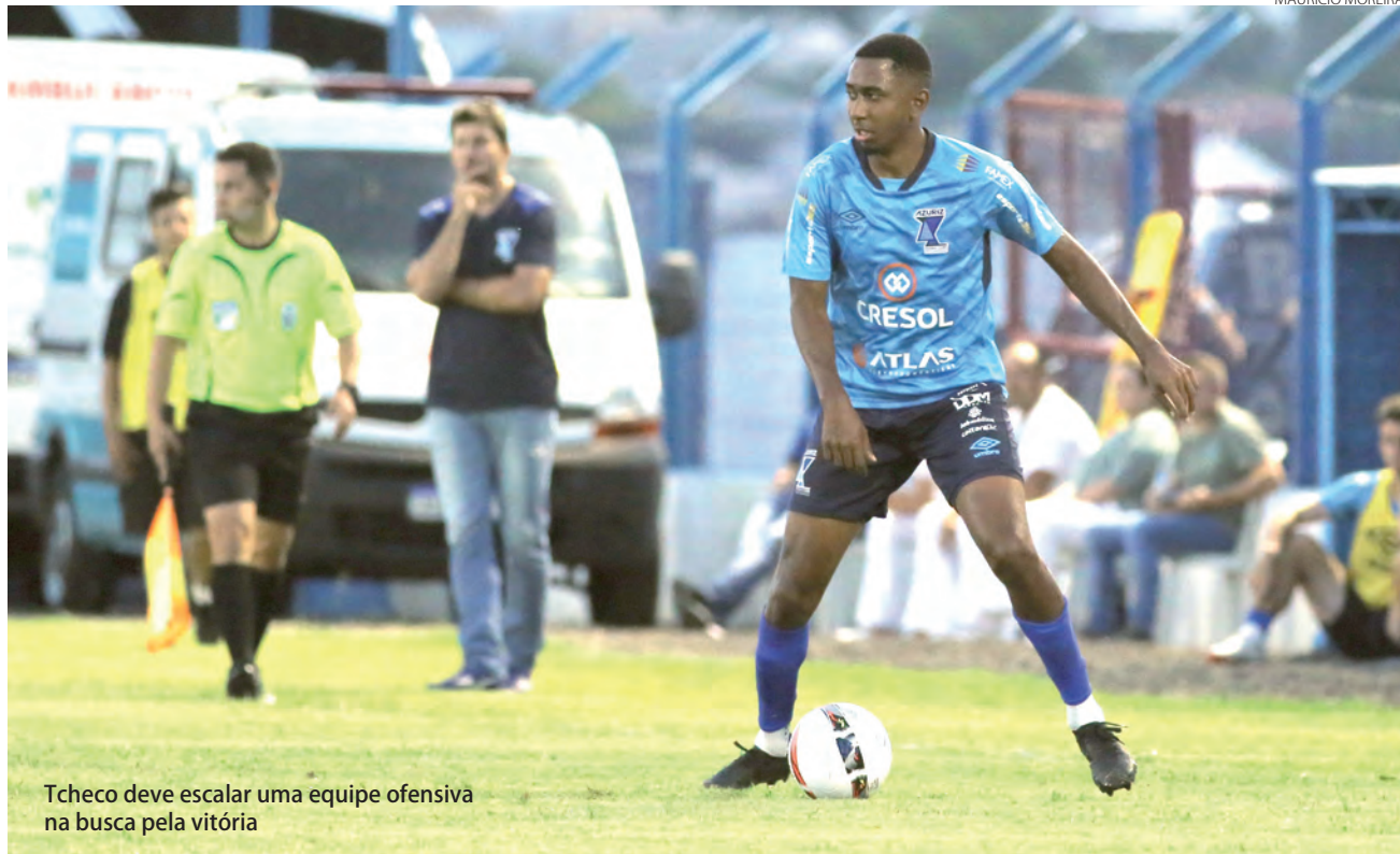
Tcheco deve escalar uma equipe ofensiva na busca pela vitória

Adenir Brocco ade@diariodosudoeste.com.br