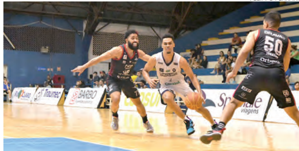
Após ser derrotado pelo Rio Claro, o Pato Basquete vai receber o Caxias