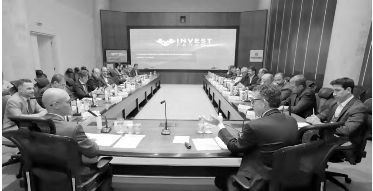
O Brazilian Day, como será chamada a missão, vai unir governos e empresas de seis estados

“Com a articulação desse encontro organizado pela Invest Paraná estabelecemos uma linguagem harmônica entre todos os promotores de investimentos para passar a