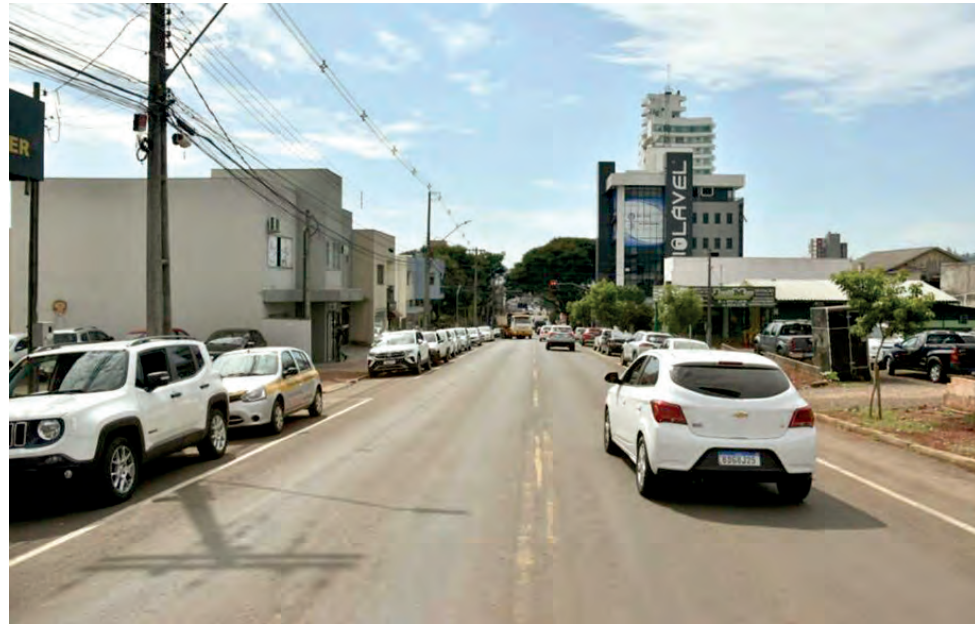
Mudança passa valer na segunda-feira (10)