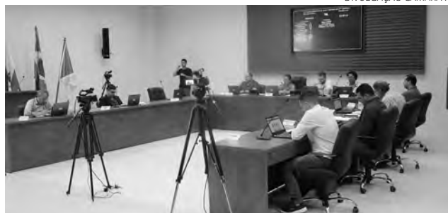
Na sessão, mais de 40 projetos foram lidos

Com a alteração de parte do Regimento Interno da Câmara de Vereadores de Pato Branco, por meio da Resolução 5 de 2023, o Legislativo municipal passa a ter dois novos membros da Comissão de Orçamento e Finanças (COF). Com isso, nessa quarta-feira (5), durante a sessão ordinária da Casa, foi realizada a escolha