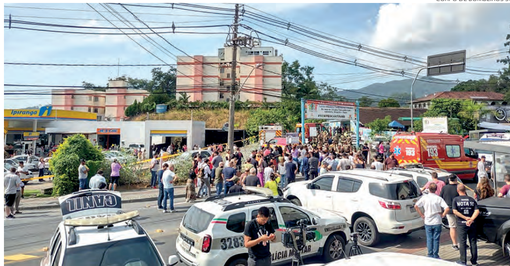
CORPO DE BOMBEIROS SC

Após ser preso, o autor da chacina foi ouvido preliminarmente pela Polícia Civil catarinense, que o identificou. O homem é natural de Salto do Lontra, e desde 2009 já possui documentos confeccionados pelos órgãos de segurança de Santa Catarina.