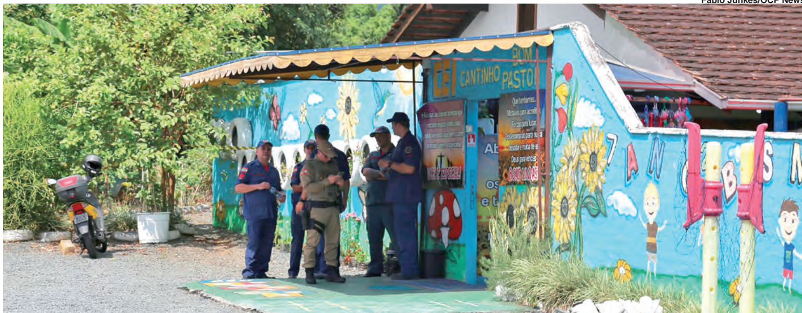
Fabio Junkes/OCP News