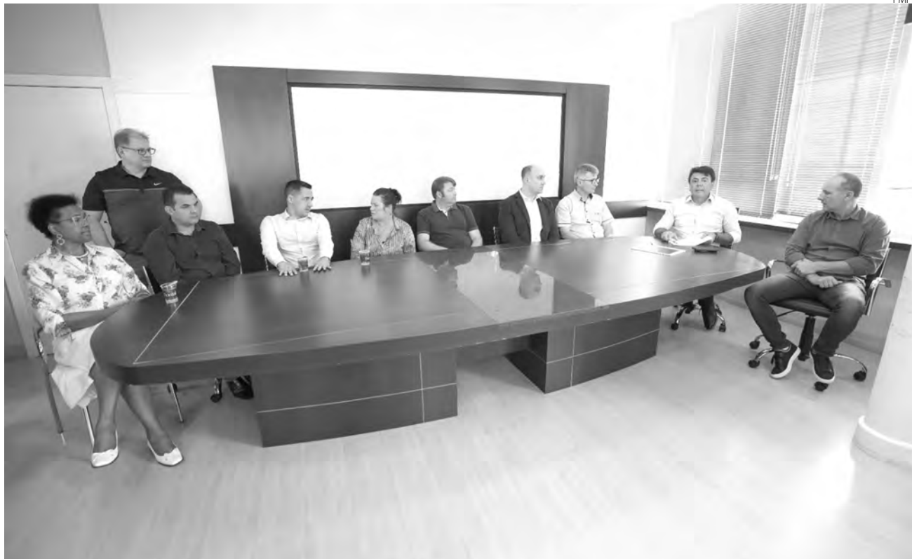
Único show confirmado até o momento é do Amado Batista, no último dia de feira