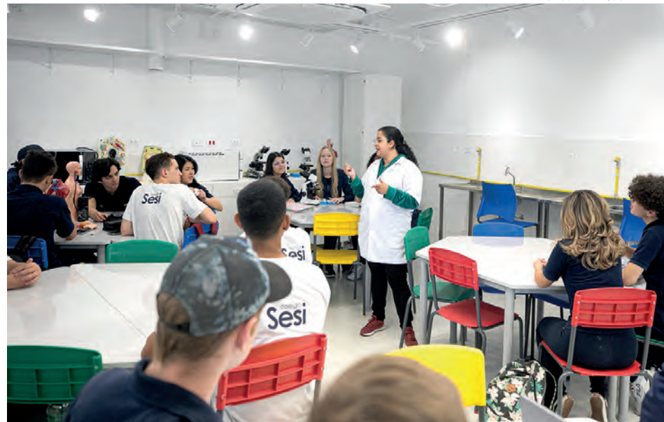
Escola tem espaços estruturados específicos para cada área do conhecimento