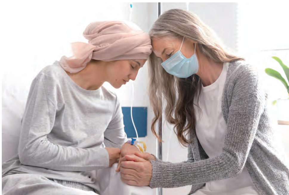
O Guia Espiritualidade em Oncologia pode ser encontrado e está disponível para download no site da SBOC

A mesma nos contou que durante o tratamen-