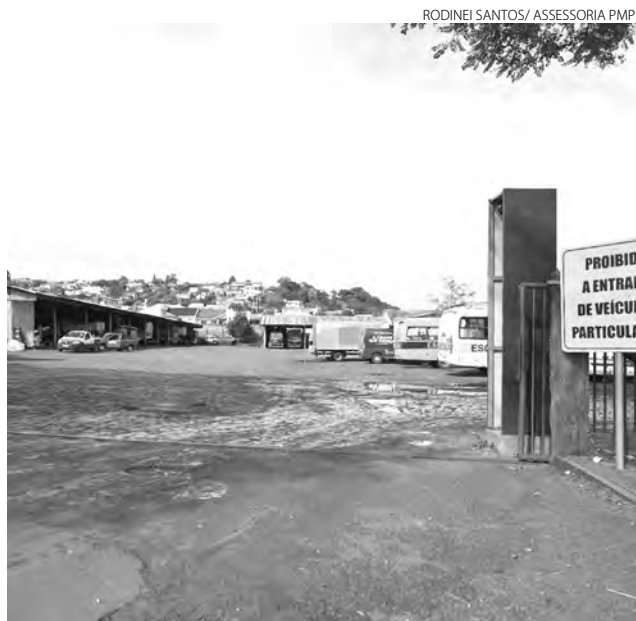
Leilão está previsto para 24 de maio

O edital, com todas as informações, pode ser acessado no site da Prefeitura, no www.patobranco.pr.gov.br . (Assessoria)