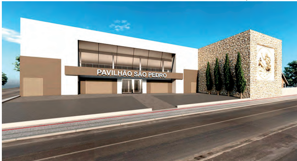
Projeto da ampliação e reforma do Pavilhão São Pedro