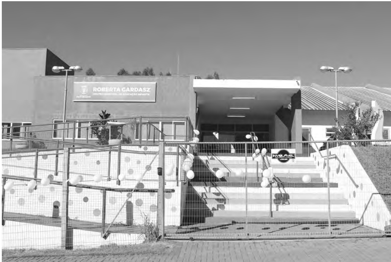
No Cmei Renata Gardaz, no bairro Parque do Som, balões brancos lembravam o pedido de paz

Mesmo com o trabalho desenvolvido por escolas, equipes policiais e comunidade para manter a tranquilidade do ambiente escolar, muitos pais optaram por não mandar seus filhos para as escolas na quinta-feira (20)