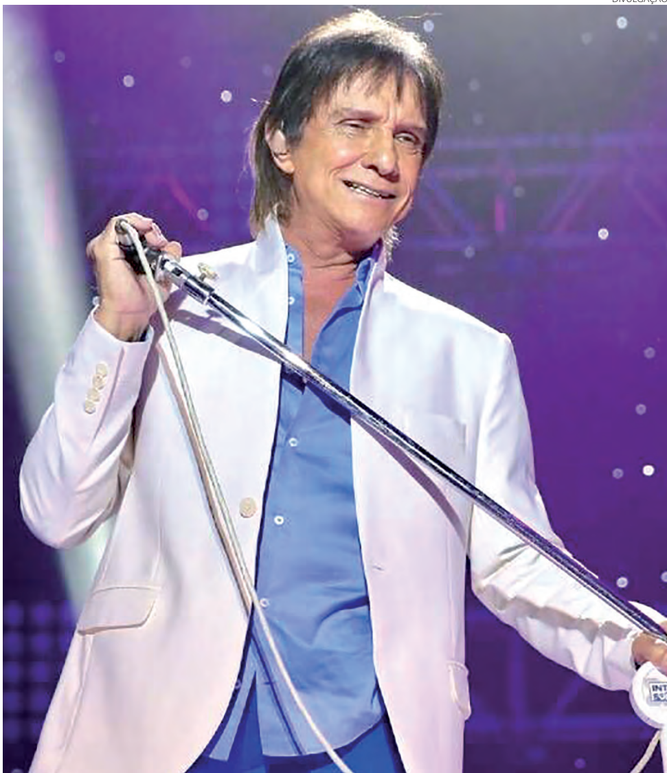
Roberto Carlos promete novas gravações para 2023