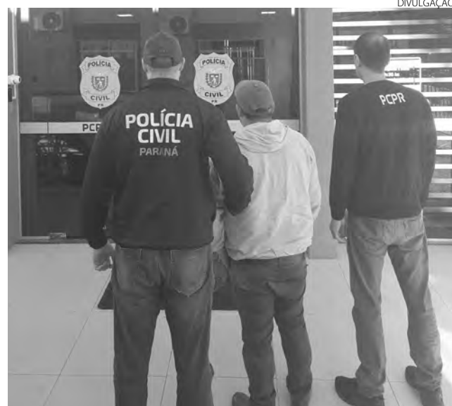
O homem preso em Pato Branco é acusado de um homicídio ocorrido no bairro Alvorada

Com a prisão do suposto autor, a Polícia Civil concluiu o inquérito policial. O acusado foi encaminhado ao Departamento Penitenciário (Depen) e encontra-se à disposição da Justiça.