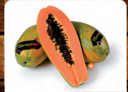
Mamão Formosa Norte Frut Kg