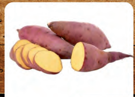
Batata Doce Roxa Kg