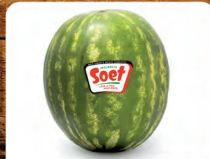
Melancia Soet s/ Sementes Kg