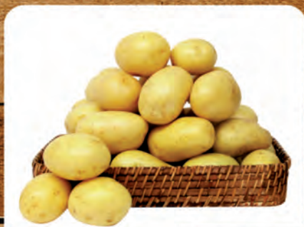
Batata Monalisa Kg