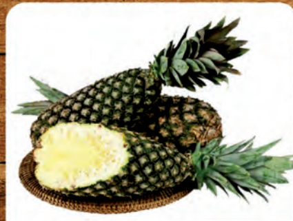
Abacaxi Pérola Unidade