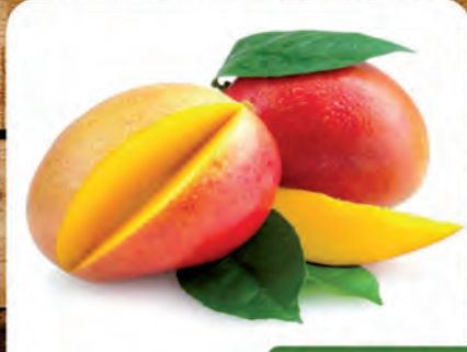
Manga Tommy Kg