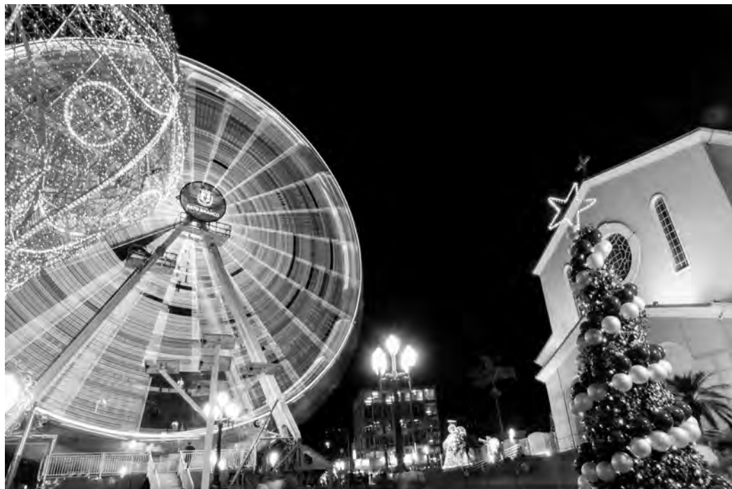
Apresentações foram pensadas para somar com a programação de natal