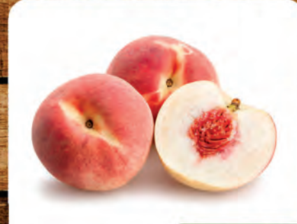
Pêssego Branco Nacional Kg