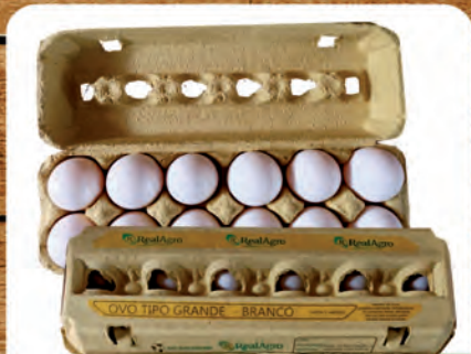
Ovos Brancos Real Agro Dúzia