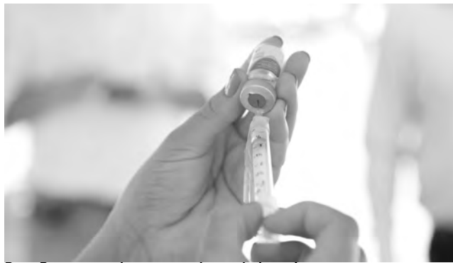
Pato Branco recebeu novas doses do imunizante

A quarta dose (segundo reforço) também estará disponível nos dias 1 e 2 de de-