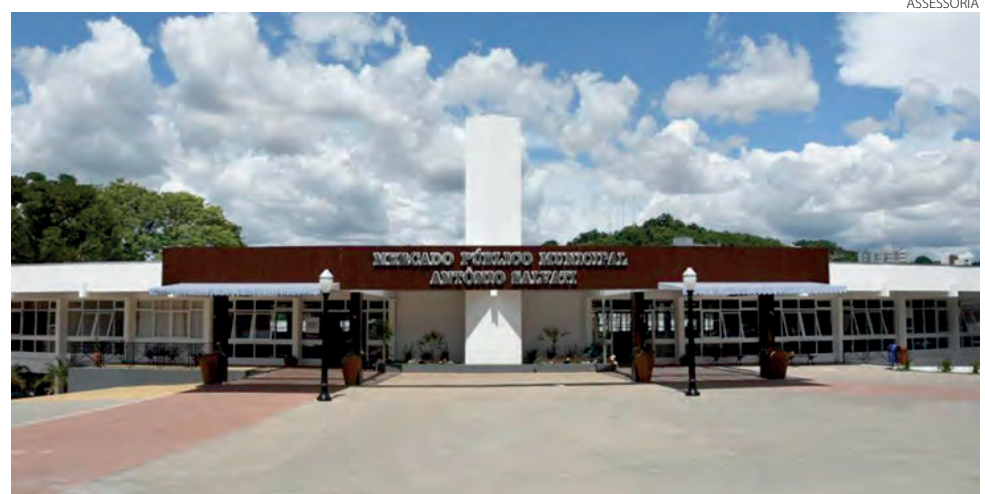
19 empresas começam a funcionar no local

São 19 empresas que começam a funcionar nas áreas de hortifrúti, restaurante, hamburgueria, lanchonete, floricultura, utilidades domésticas, peixaria, cervejas especiais, personalização e produção de brindes, doceria, comida saudável, cabeleireiro, produtos esotéricos, produtos em conserva, adega, café, ateliê e oficina de celulares. Estas empresas foram ha-