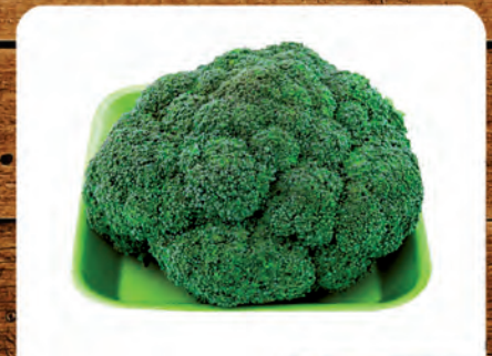
Brócolis da Ilha Bandeja