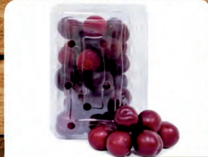
Ameixa Nacional Bandeja 600g