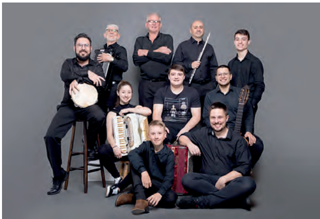
Orquestra Sanfônica está de volta aos palcos com o concerto Outro Sul