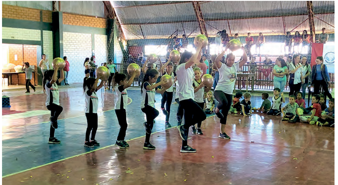
Familiares puderam acompanhar as apresentações