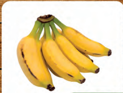
Banana Prata Kg