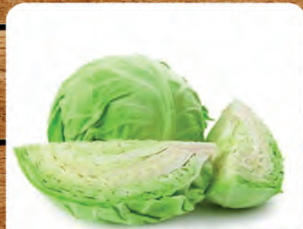
Repolho Verde Kg