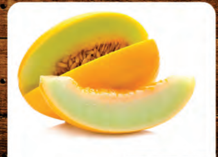
Melão Amarelo Tradicional Kg