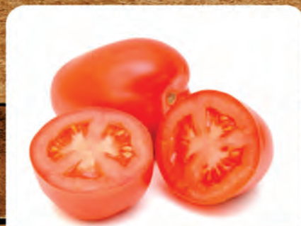
Tomate Saladete Kg