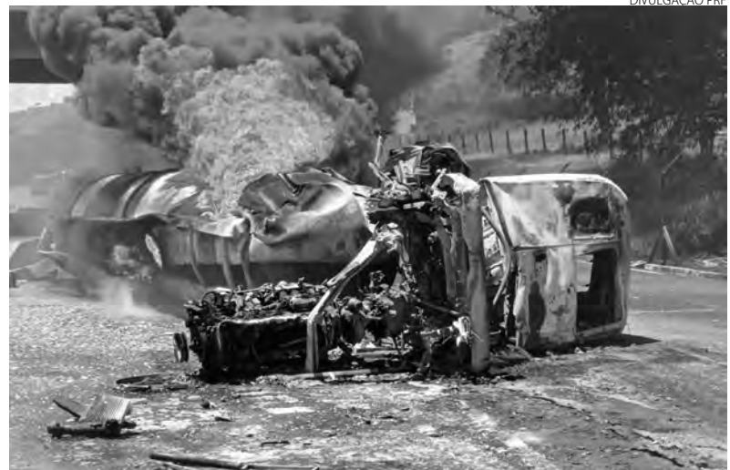
O caminhão-tanque carregado com diesel incendiou após o acidente