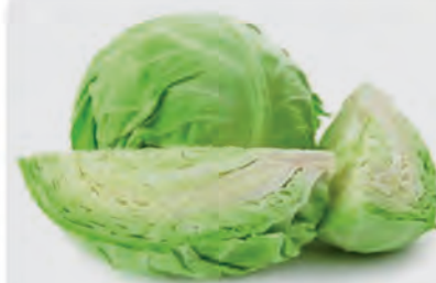
Repolho Verde Kg