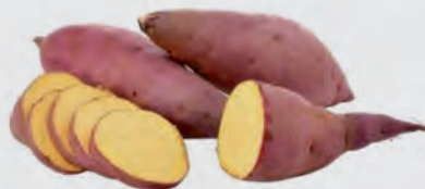
Batata Doce Roxa Kg