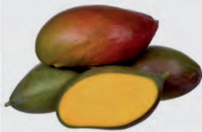
Manga Palmer Kg