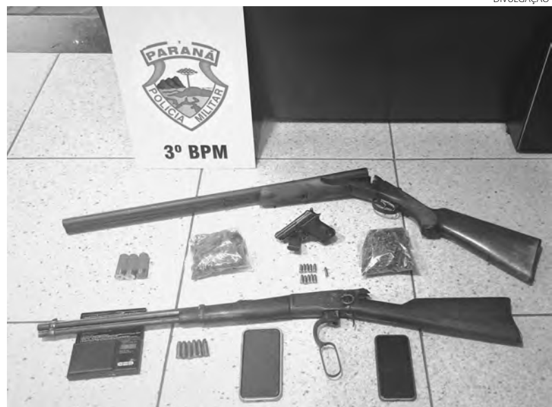
As armas e as drogas estavam na residência de uma mulher, que foi presa

A moradora foi presa por tráfico de drogas. Ela foi entregue, juntamente com o entorpecente, na Delegacia da Polícia Civil de Palmas para as devidas providências. (AB)