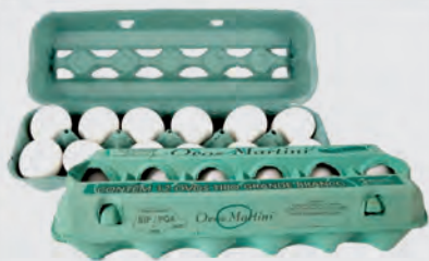
Ovos Brancos Martini Dúzia