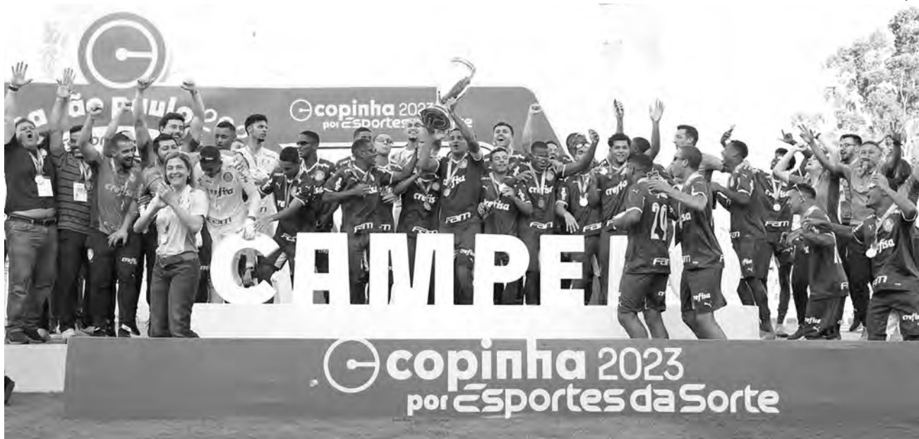
O Palmeiras faturou a taça do tradicional torneio de base pelo segundo ano consecutivo