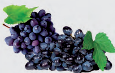
Uva Vitória e Núbia Bandeja 500g