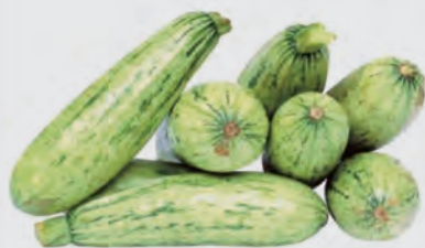
Abobrinha Verde Kg