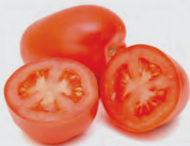
Tomate Saladete Kg