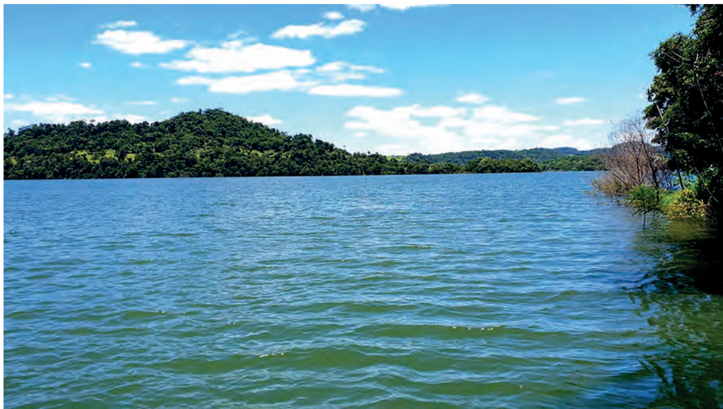
Um leitor do Diário do Sudoeste encaminhou o registro fotográfico do reservatório da Usina Hidroelétrica de Salto Santiago em Saudade do Iguaçu