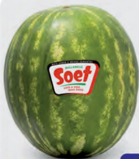
Melancia Soet s/ Sementes Kg