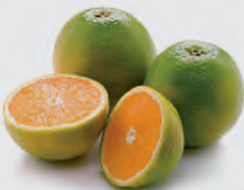
Laranja Pera Kg