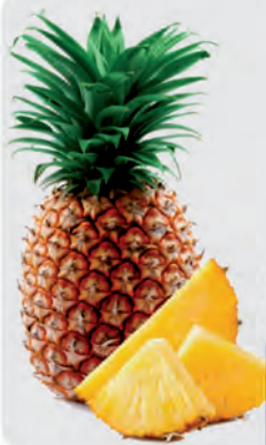
Abacaxi Hawai Unidade