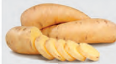
Batata Salsa Kg