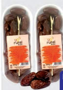
Tâmara c/ Carço Rural Brasil 200g