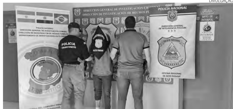
O homem preso é acusado de chefiar a organização criminosa

Nas últimas semanas, o Gaeco, Núcleo de Francisco Beltrão, identificou a provável localização do