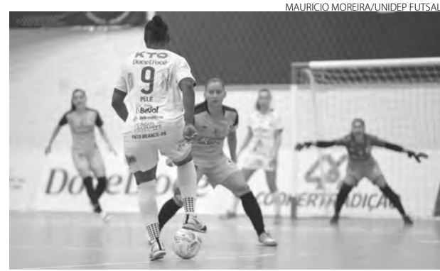
Confronto com o Taboão acabou com a vitória da equipe paulista por 2 a 5

Já pelo Estadual, a competição é liderada pelo Londrina, com seis pontos e duas partidas, enquanto as meninas do Unidep Futsal Pato Branco estão em sexto lugar, sem pontos, dividindo o mesmo aproveitamento com as adversárias da ADTB, que também não venceram até o momento, e estão em sétimo.