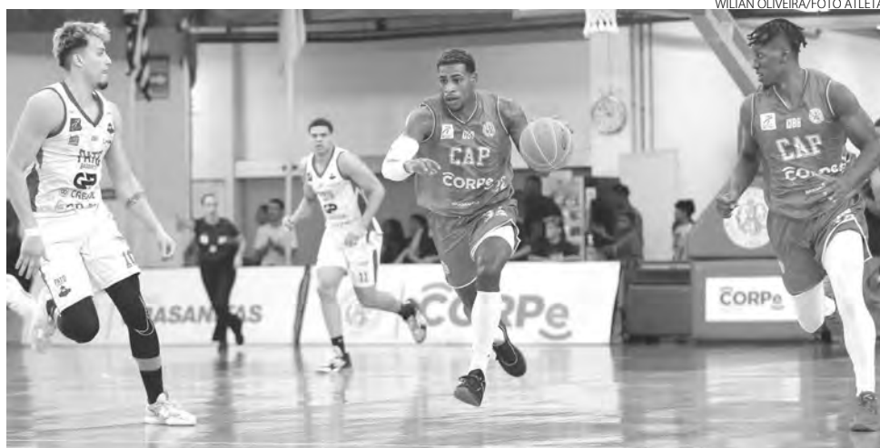
Ao final de série de três partidas, o Paulistano se manteve no NBB

Depois de ter perdido o segundo jogo da série dos playoffs, por 90 a 57, na sexta-feira (21), o elenco pato-branquense fez uma partida mais consistente no domingo, sempre buscando não permitir adversário abrir grande vantagem no marcador, — as parciais foram de 16 a 14 no primeiro quarto e de 33 a 22 no segundo, o que levou os paulistas fecharem o primeiro tempo com 13 pontos a