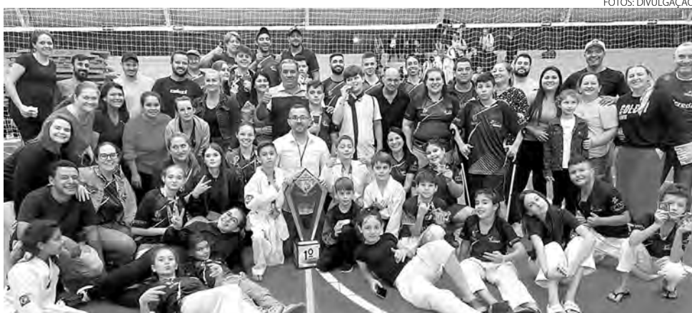
A equipe de Vitorino sediou a competição e ficou em primeiro lugar na classificação geral

o evento foi de grande valia em preparação já para o Campeonato Paranaense, que vai ser realizado em Pontal do Paraná. “Ficamos com o segundo lugar geral 30 pontos à menos que a equipe anfitriã do evento, no total foram 51 medalhas de ouro, 48 de prata e 32 de bronze. Também tivemos o privilégio de apresentar os alunos do projeto taekwondo para todos, realizado na Apae de Pato Branco pela nossa associação, que para esses alunos foi emocionante poder participar do evento, mesmo que de forma demonstrativa, todos conquistaram suas medalhas, para mim como mestre foi a realização de um sonho, comandar um projeto voltado para a inclusão social de Crianças Especiais”, destacou. (Assessoria)