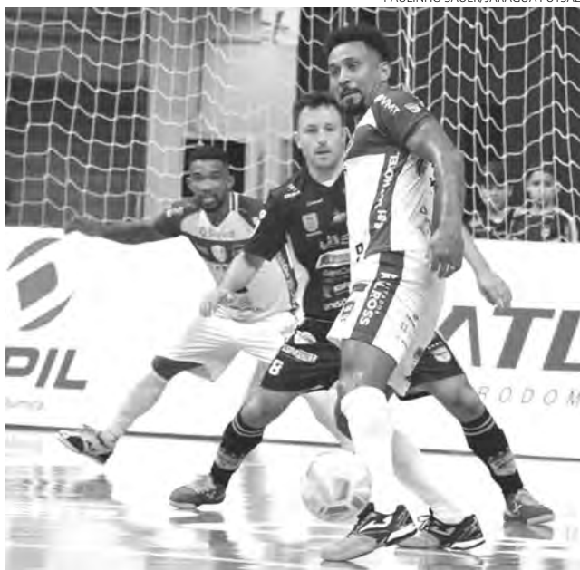
Em Jaraguá do Sul, o Pato evitou de levar uma goleada dos donos da casa, com dois gols nos últimos minutos

Em grupos de mensagens, alguns torcedores chegaram a manifestar a intenção de não comparecerem ao jogo da próxima sexta, como forma de protesto, também teve quem sugeriu, a torcida ficar fora do ginásio Dolivar Lavarda e outros falaram até mesmo de apoiar o adversário. Mas ainda teve torcedores que afirmaram que neste momento o time precisa de apoio da torcida.