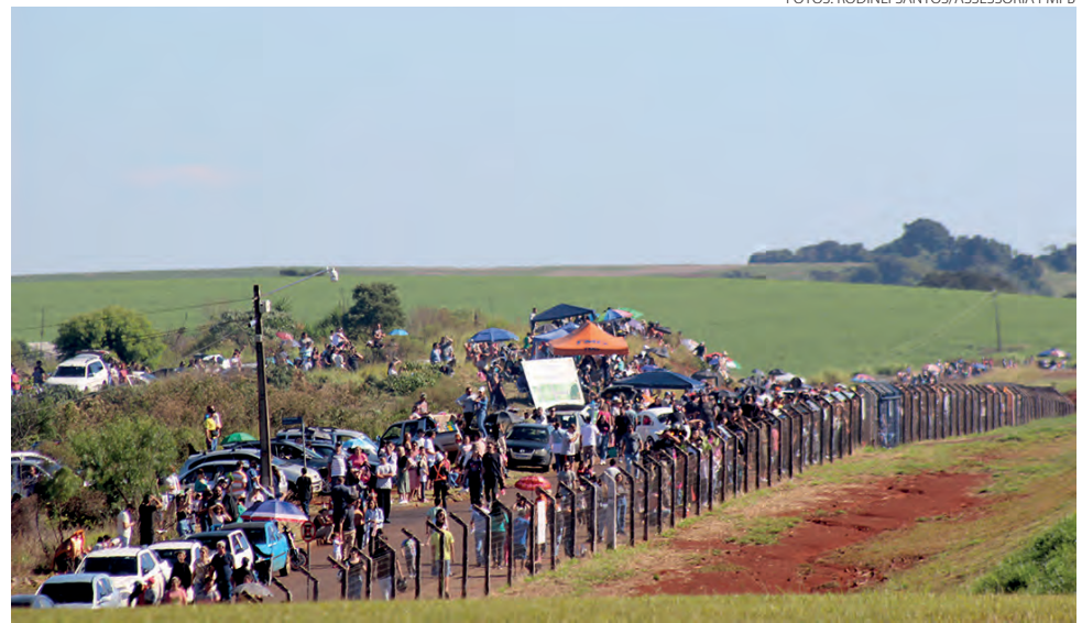
População se acomodou na extensão da pista do aeroporto para acompanhar as manobras

tário de Desenvolvimento Econômico de Pato Branco, há quase 50 aeronaves alojadas em hangares no entorno do Aeroporto Regional de Pato Branco e aponta que “o show aéreo só aconteceu devido a parceria do CAP com o município”.