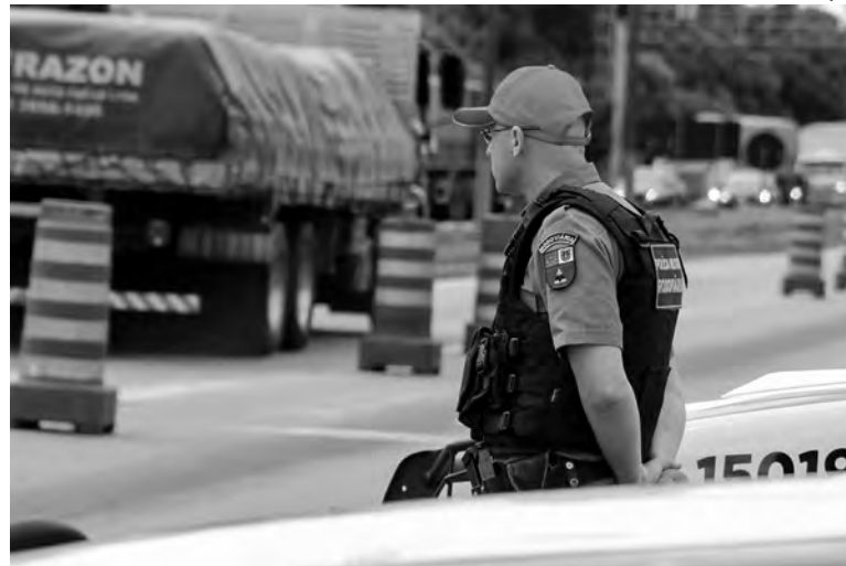
No total, 5.381 motoristas foram flagrados em excesso de velocidade nas rodovias estaduais

Durante a Operação Tiradentes, o BPRv contou também com cães farejadores, possibilitando a fiscalização rápida nos veículos para a localização de drogas e armas. Ao todo, foram apreendidos 103 quilos de drogas ao longo da operação. "As ações aconteceram com o objetivo de intensificar a fiscalização nas rodovias estaduais e