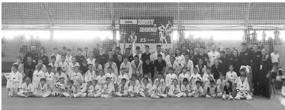
Os atletas da equipe Silva, que conquistaram o vice-campeonato da Copa Sudoeste