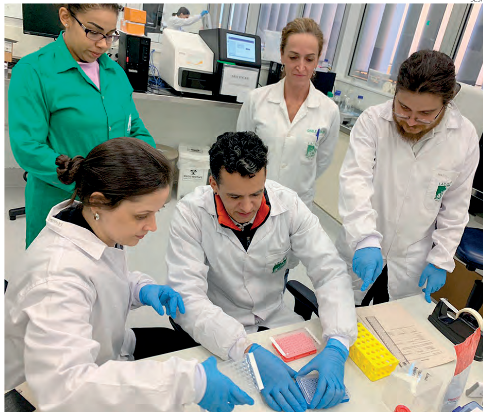
Com a conclusão da pesquisa, será possível mapear e conhecer de maneira mais profunda a origem e evolução da doença