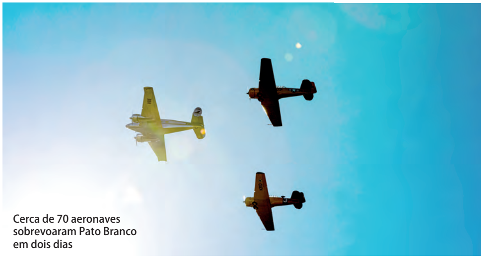
Cerca de 70 aeronaves sobrevoaram Pato Branco em dois dias