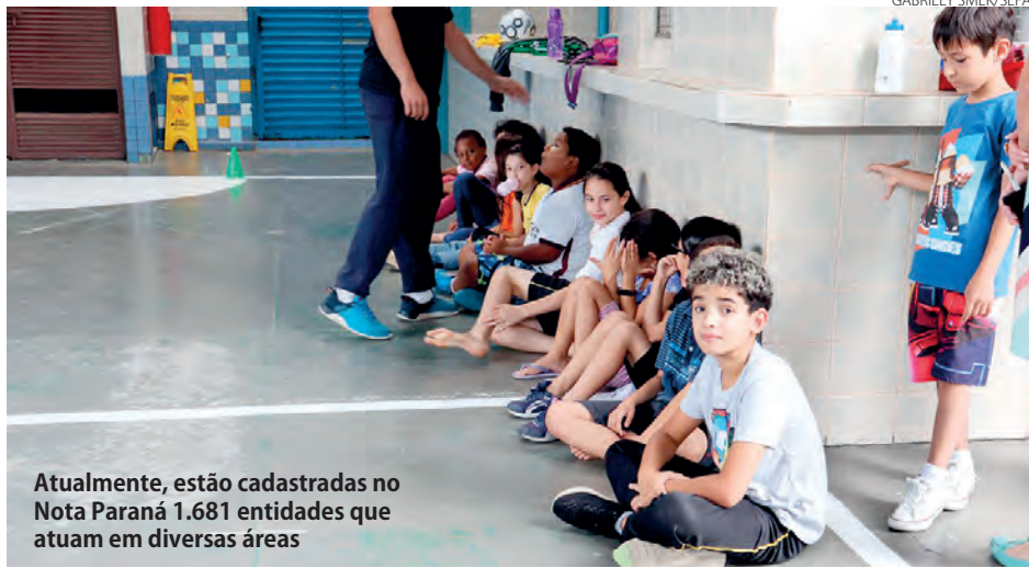
Atualmente, estão cadastradas no Nota Paraná 1.681 entidades que atuam em diversas áreas