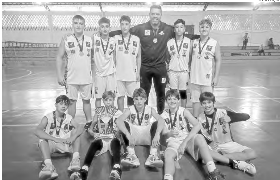
A equipe de basquetebol masculino de Pato Branco conquistou o título ao vencer Francisco Beltrão

Pato Branco disputou os Jimsops com 150 atletas em sete modalidades, ficando em segundo lugar na classificação geral. O destaque foi o xadrez, representado pelos