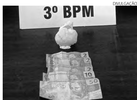
Os rapazes vieram de Santa Catarina para adquirir a droga em Pato Branco

Eles foram entregues, juntamente com o carro e a cocaína, na Delegacia da Polícia Civil de Pato Branco. A pena prevista para o crime de tráfico de drogas é de 5 a 15 anos de reclusão e multa. Denuncie ligando 181, 190 ou baixe o APP 190 na Play Store. Sua identidade será preservada. (AB)