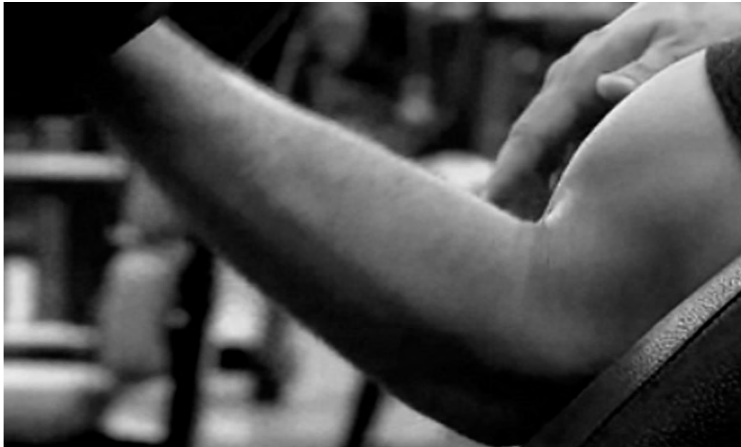
Decisão está publicada no Diário Oficial da União

De acordo com o CFM, a percepção é corroborada pelas sociedades brasileiras de Endocrinologia e Metabologia, de Medicina