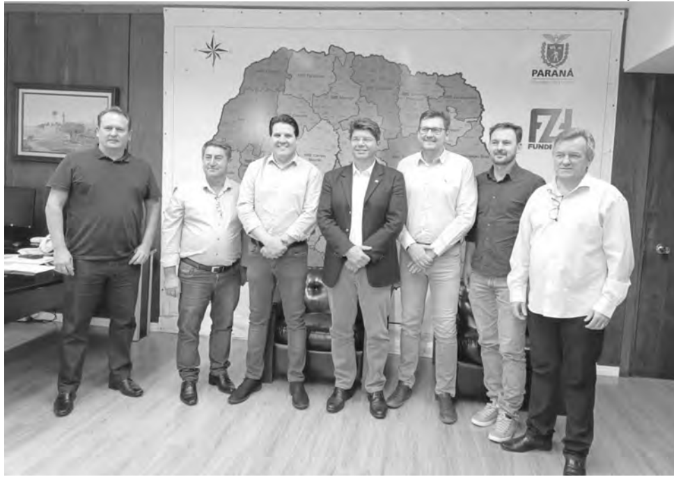
A expectativa de que as ações conjuntas sejam anunciadas nos próximos dias

Nessa terça-feira (11), voltou a reafirmar que os