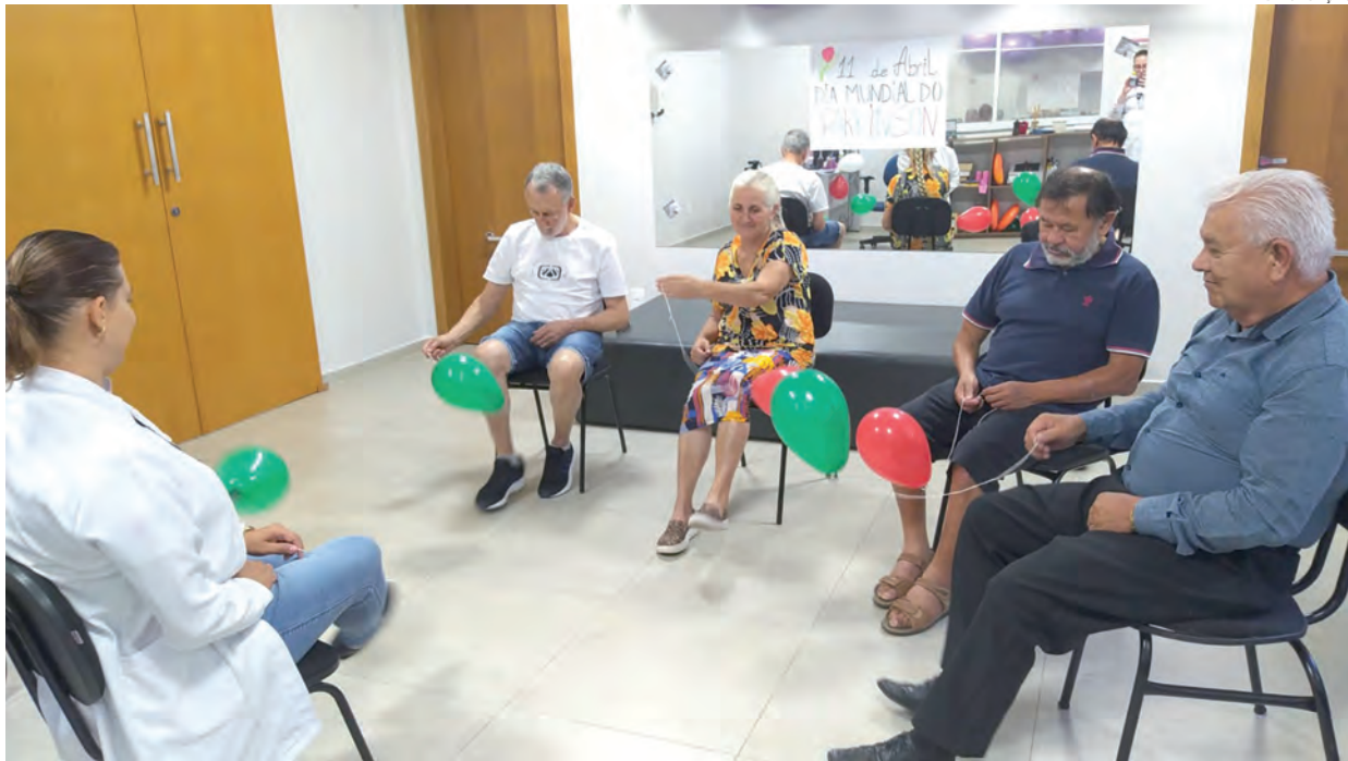
A Secretaria de Saúde de Palmas está realizando ações de conscientização da doença de Parkinson, a data é lembrada em 11 de abril