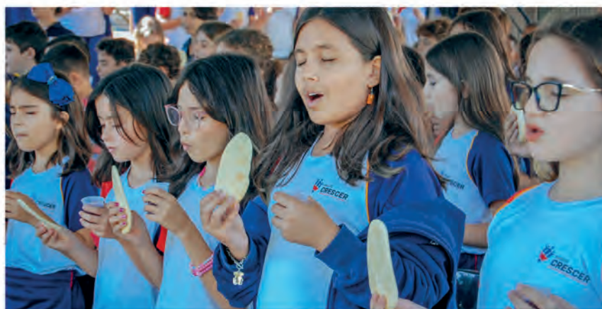
Todos os alunos da Escola Crescer participaram do projeto