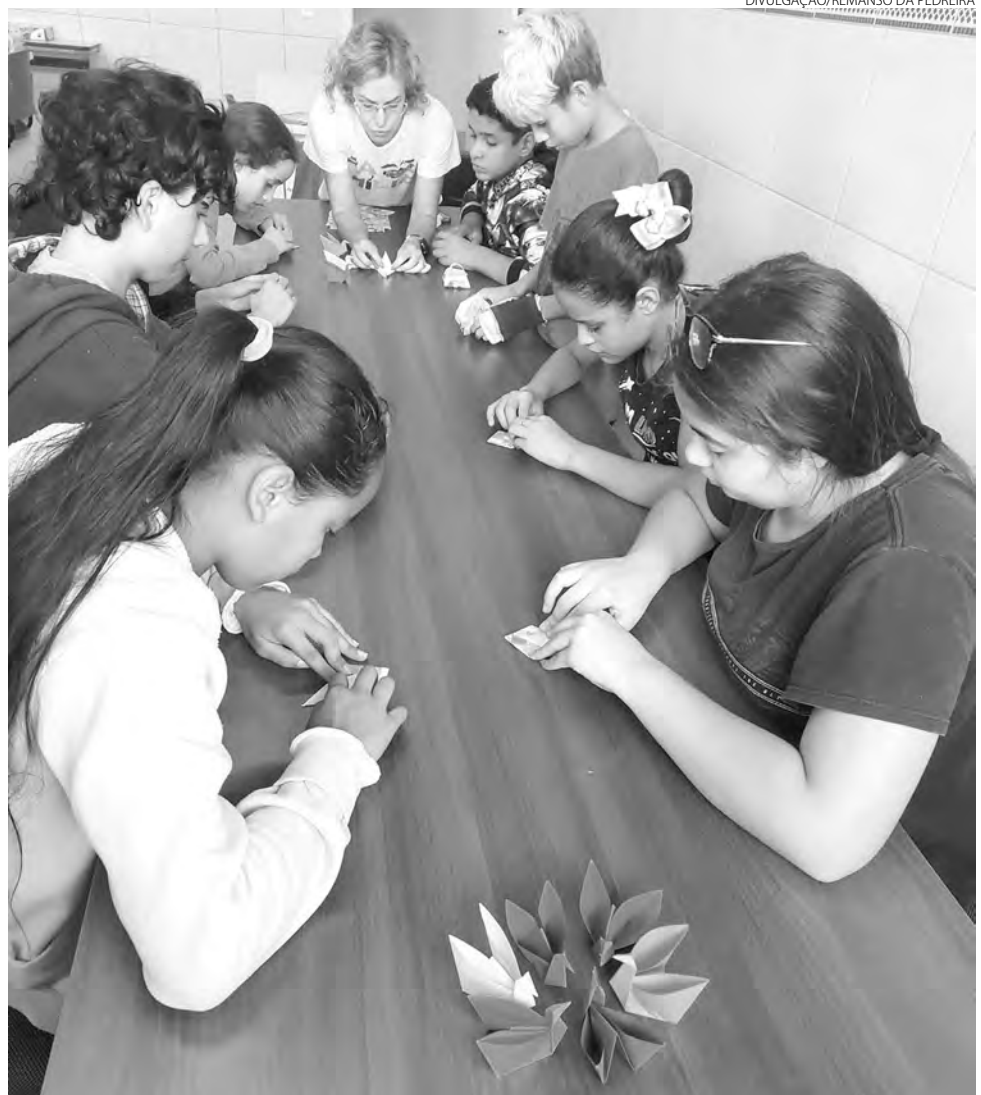
Atividades do Remanso da Pedreira foram retomadas em fevereiro

"Quem vivencia essas atividades sabe da importância da ONG para os participantes e saber que os alimentos básicos acabam faltando no dia a dia da ali-