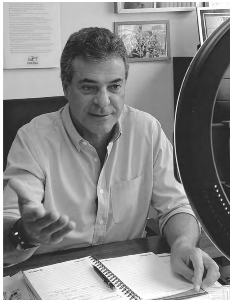
Richa afirma que o partido deve buscar novas lideranças