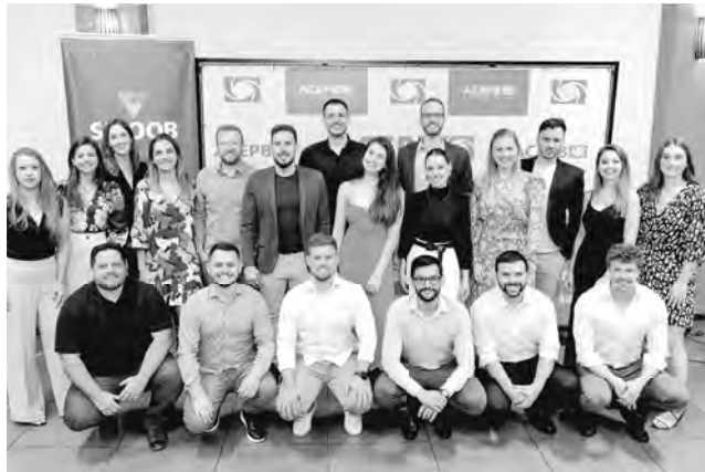
Nova diretoria da AcepB terá como um de seus objetivos, através dos núcleos, criar elo entre a Associação e comunidade

Segundo o novo presidente, 80% dos membros da diretoria da associação participaram ou ainda participam de algum núcleo, o que demonstra a capacidade que eles possuem para desenvolver novas lideranças empre-