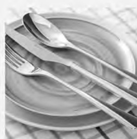
Faqueiro inox St James 101 peças