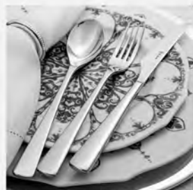
Faqueiro inox St James 77 peças