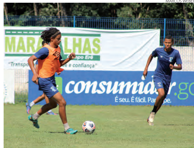
O Azuriz quer o apoio da torcida na busca pela classificação