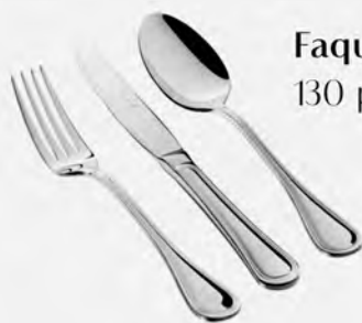
Faqueiro inox St James 130 peças