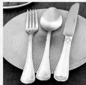
Faqueiro inox St James 48 peças