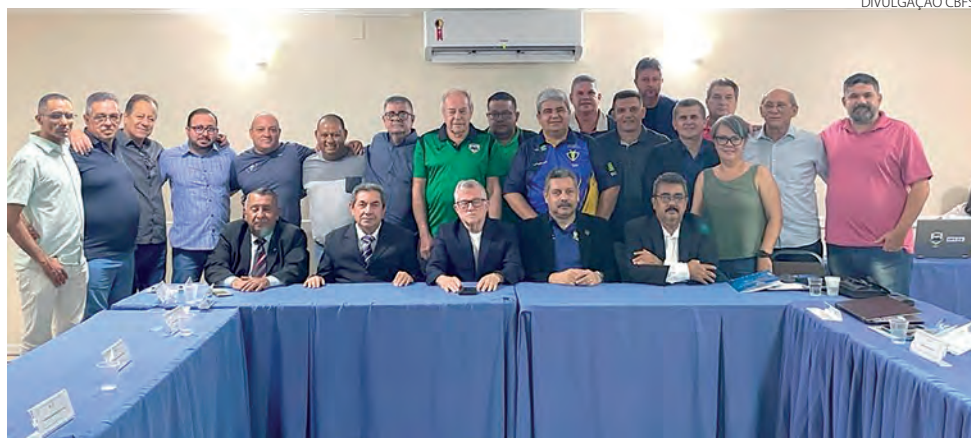
A nova diretoria da CBFS foi definida no último final de semana

Os certames nacionais de futsal promovidos pela Confederação Brasileira de Futsal têm por objetivo principal o desenvolvimento do futsal em âmbito nacional e a busca do seu alto rendimento. (Assessoria)