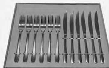
Faqueiro inox para churrasco 12 peças