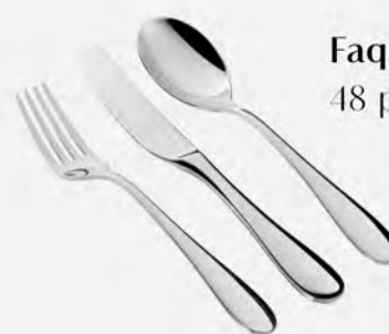
Faqueiro inox St James 48 peças