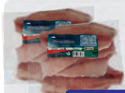
Filé de Tilápia União 800g