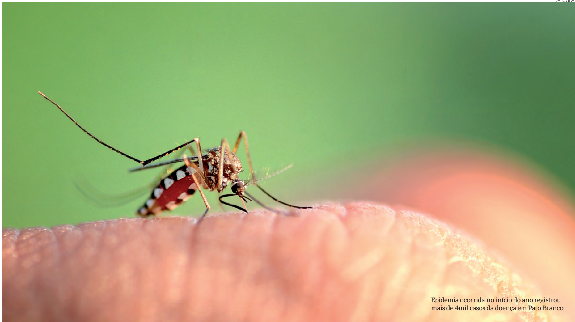
Epidemia ocorrida no início do ano registrou mais de 4mil casos da doença em Pato Branco