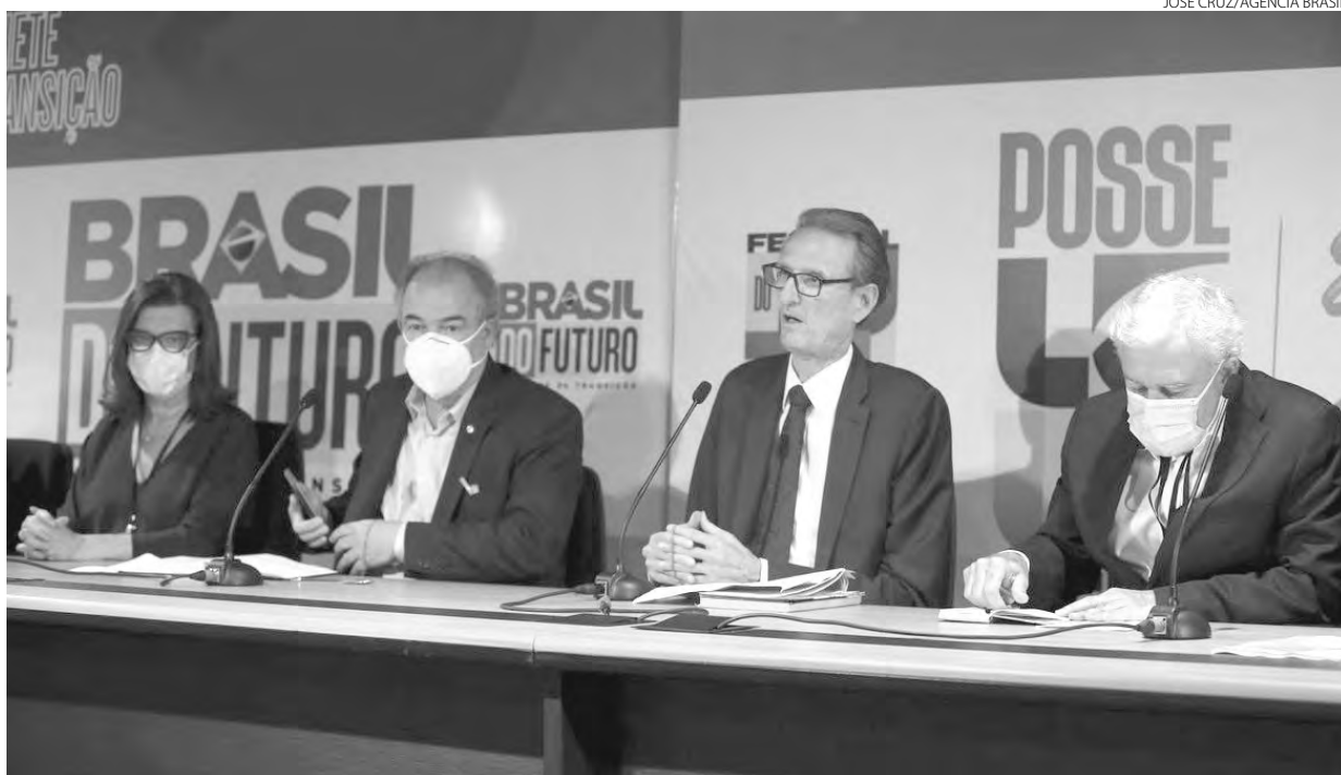
Grupo da transição atribui impacto a ações do atual governo no setor

A equipe de transição fará sugestões ao novo ministro de Minas e Energia para reduzir esses valores, como a rescisão dos contratos emergenciais com as usinas termelétricas e a revisão, junto ao Congresso, da obrigação de instalar esse tipo de usina em lugares distantes, longe do suprimento de gás e do centro de consumo. "Não aceitamos isso como prato feito. Existe espaço para negocia-