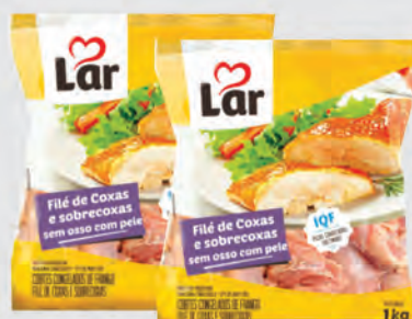
Filé de Coxa e Sobrecoxa Lar 1Kg