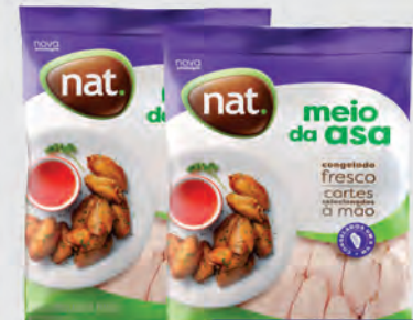
Meio da Asa Frango Nat 1Kg