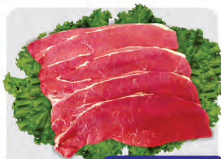
Bife Coxão Mole Bovino Kg