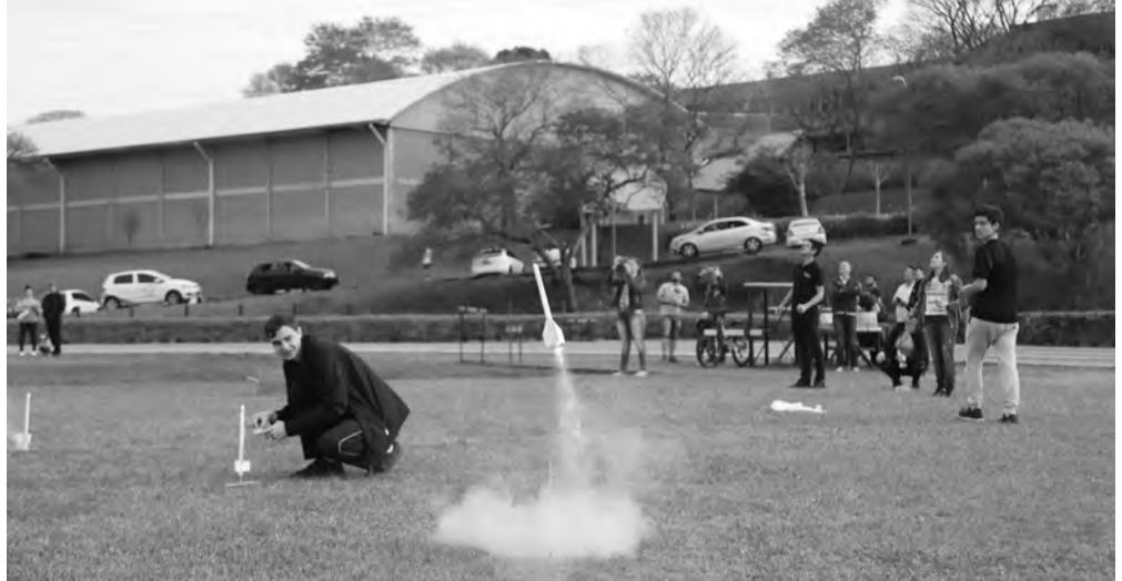
Competição de Foguetes Didáticos é programação tradicional da Mostra Astronômica