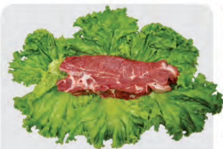
Filé Agulha Bovino Kg