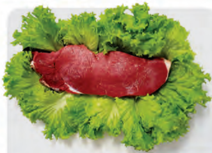
Coxão Mole Bovino p/ Churrasco Kg