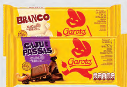
Chocolate Barra Garoto 80g