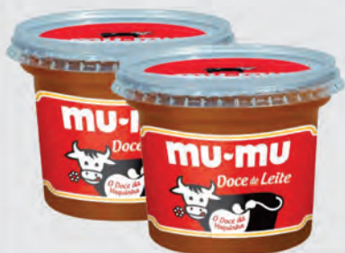
Doce de Leite Mu-mu Tradicional 350g