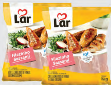
Filezinho Peito Frango Sassami Lar 1Kg