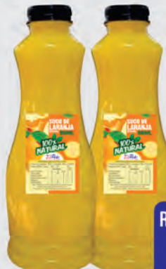
Suco de Laranja Natural Super Polo 800ml