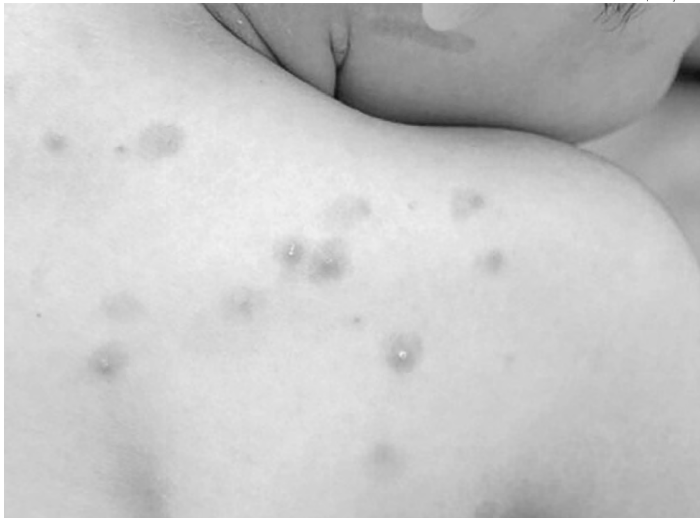
Brasil é o segundo país do mundo com maior número de casos registrados da doença