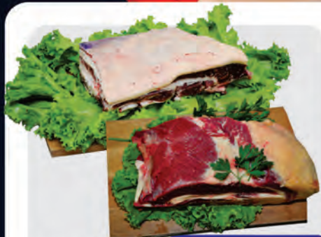
Costela Minga e Ponta de Peito Bovina Kg