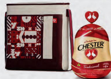
Kit Felicidade Perdigão 01 Chester + Bolsa Térmica