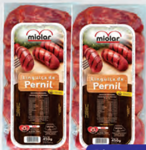
Linguiça Pernil Miolar 450g