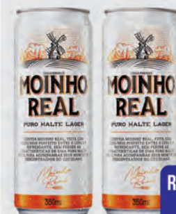
Cerveja Moinho Real Puro Malte 350ml