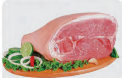
Pernil Suíno c/ Pele Kg