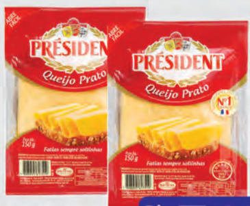
Queijo Prato Président Fatiado 150g