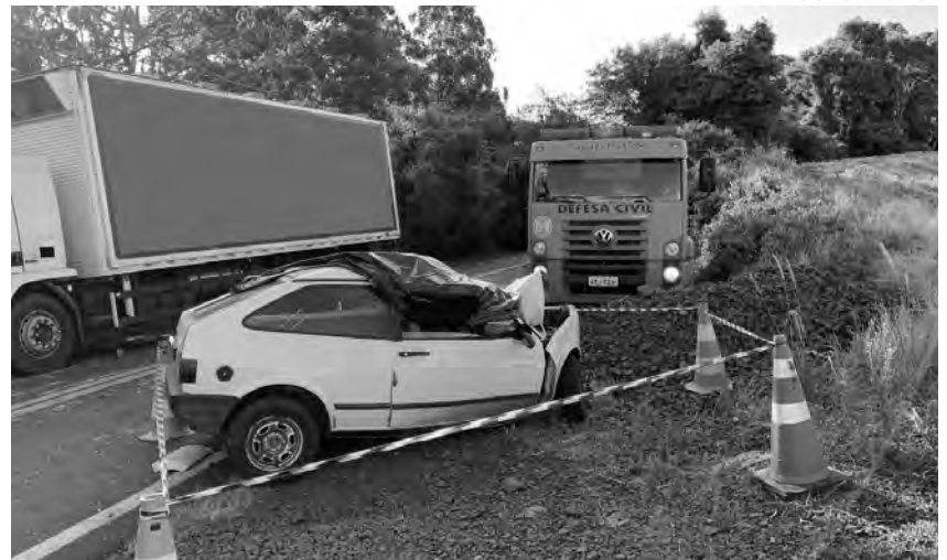
O Gol colidiu frontalmente contra um caminhão

Conforme informações do Corpo de Bombeiros, o acidente ocorreu próximo da ponte sobre o rio Pato Branco. Com o impacto da colisão, o motorista foi ejetado do Polo. Ele chegou a ser reanimado pelos bombeiros, mas morreu após dar entra-