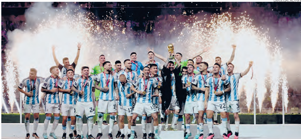
A Argentina ganhou o título nos pênaltis e Messi foi escolhido o craque da Copa

Na decisão, foi Messi quem colocou a Argentina na dianteira, ao converter pênalti, aos 22 minutos da etapa inicial. Pouco depois, o meia-atacante deu o toque genial, ainda no meio-campo, que