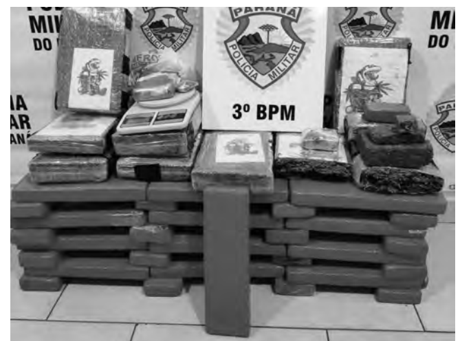
A maconha estava escondida no forro de uma residência