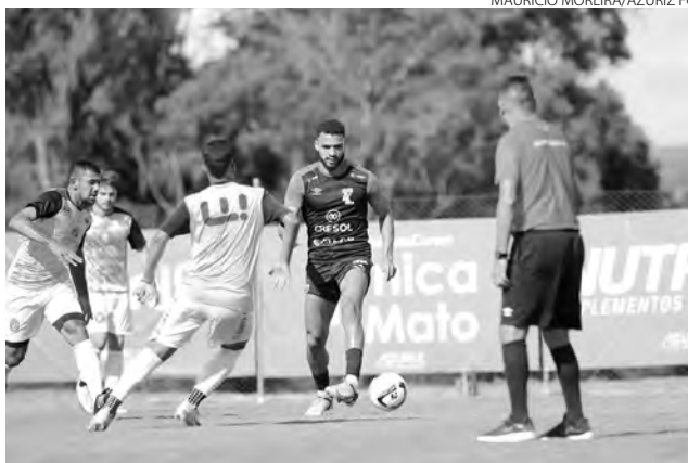
O amistoso serviu para o treinador avaliar os jogadores do Azuriz

O Azuriz tem uma base para a próxima temporada e está fazendo algumas contratações pontuais para reforçar a equipe no Campeonato Paranaense, na busca por vagas na Copa do Brasil e Série D do Campeonato Brasileiro. Os treinos prosseguem no CT Galha Azul e no próximo dia 23 será realizado mais uma amistoso,