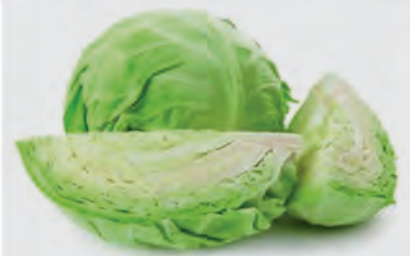
Repolho Verde Kg