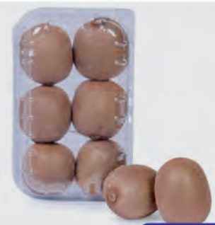
Kiwi Importado Bandeja 600g