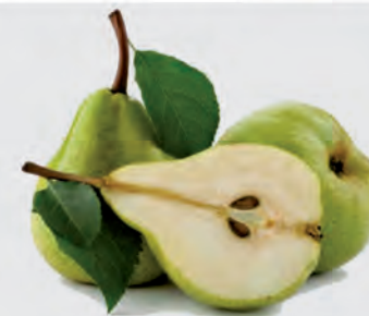
Pera Williams Importada Kg