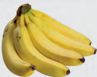
Banana Caturra Kg