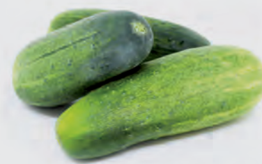
Pepino Salada Kg