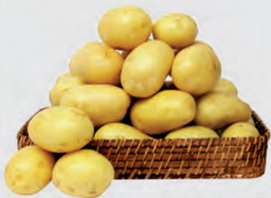
Batata Monalisa Kg