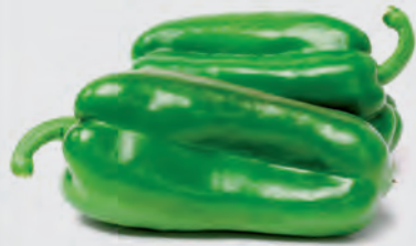
Pimentão Verde Kg