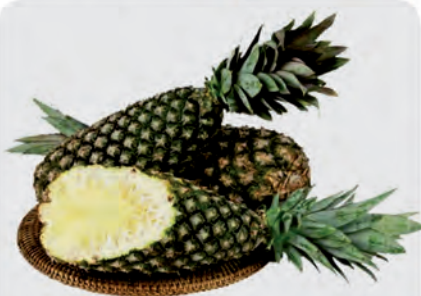
Abacaxi Pérola Unidade