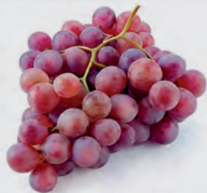
Uva Rosada Kg