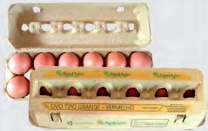
Ovos Vermelhos Real Agro Dúzia