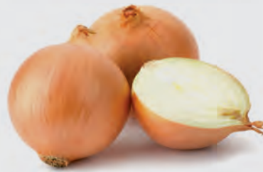
Cebola Nacional Kg