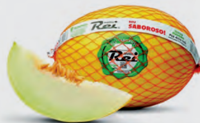
Melão Rei Kg