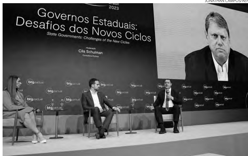
Ratinho Junior e os governadores do Rio Grande do Sul, Eduardo Leite, e de São Paulo Tarcísio Freitas participaram de mesa de debates

A Portos do Paraná prepara, ainda, estudos sobre dois outros leilões. A PAR03 será destinada à movimentação e armazenagem de grãos sólidos minerais, principalmente fertilizantes. A área tem 38 mil m 2 e engloba o pátio localizado em frente à sede administrativa da Portos do Paraná e o Terminal Público de Fertilizantes. O levantamento preliminar aponta a necessidade de investimentos mínimos de R$ 233 milhões, valor que ainda pode ser alterado. Já a PAR05, que possui cerca de 30 mil m 2 , está com os estudos em fase inicial.