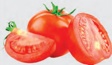
Tomate Longa Vida Kg