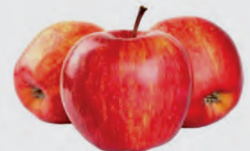
Maçã Gala Kg