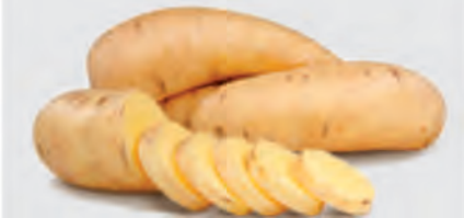
Batata Salsa Kg