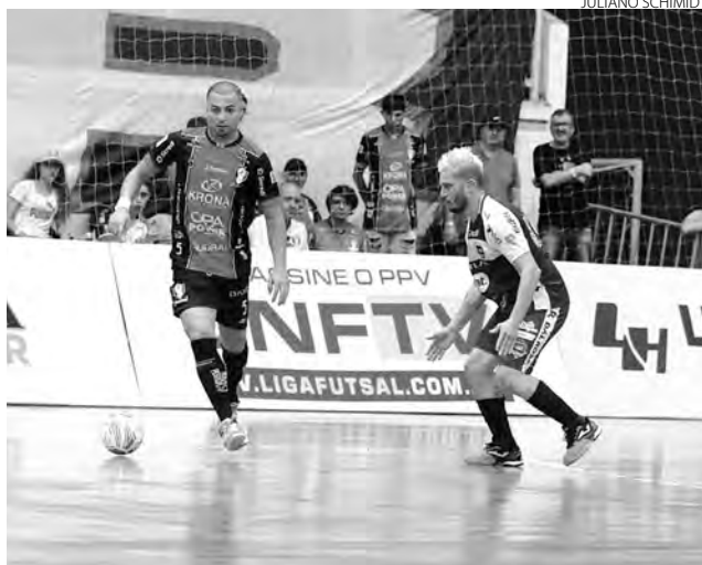
O Pato Futsal foi superado pelo Joinville

Agora o Pato Futsal está se preparando para enfrentar o Foz Cataratas, quinta-feira, pelo Estadual, onde ocupa o terceiro lugar do Grupo B, com 11 pontos. Neste confronto, o técnico Sérgio Lacerda, que cumpriu suspensão na vitória diante do Mangueirinha, volta a comandar a equipe