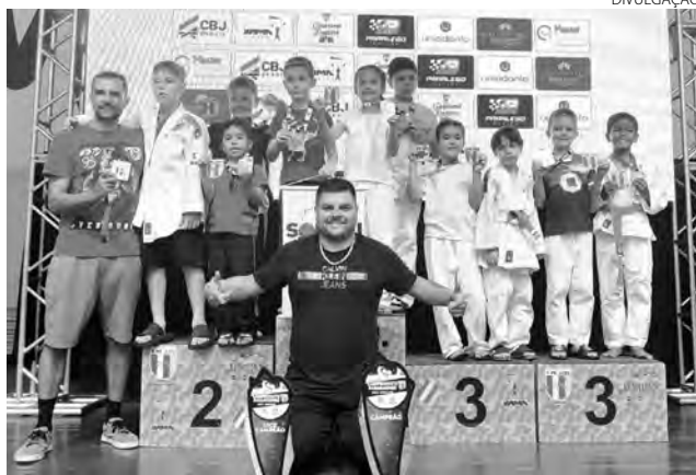
Os atletas da Academia Judô Sonkei, que se destacaram no Campeonato Paranaense