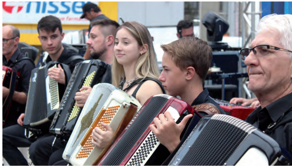
Orquestra Sanfônica da Pato Branco também se apresentou na praça

O músico lembrou que o instrumento tem um “apelido” em cada lugar, bem como é dinâmico. “Na Argentina o que eu toco é La Verdulera; nos chamamos de gaita ponto; no Nordeste é pé de bode; então eu defino como um instrumento versátil, podendo ser tocado em praça pública, acompanhado de uma orquestra sinfônica ou tocando solo”. Borghetti definiu que para ele o instrumento “é muito alegre” e