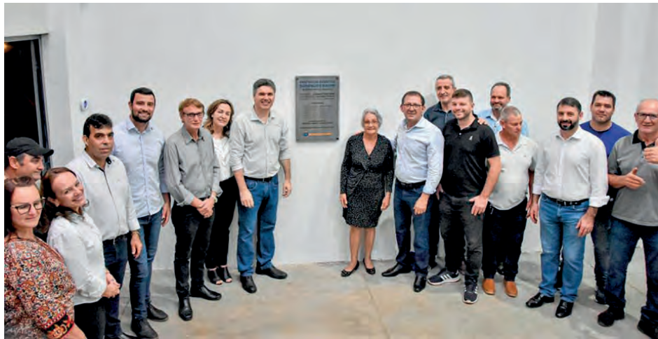
Inauguração contou com presença de lideranças locais