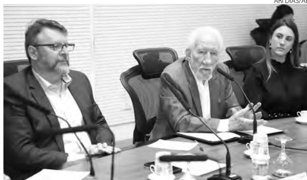
Piana abriu a semana, participando do lançamento do edital de adesão de startups ao BRDE Labs 2023

Criado em 2020, o programa de inovação aberta do BRDE faz a ligação de empresas paranaenses com startups de todo o País, com o objetivo de criar conexões e gerar futuros negócios. Ele conta com editais anuais e