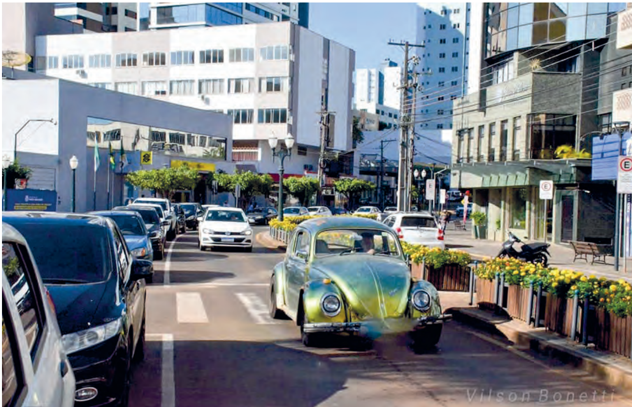
O fotógrafo Wilson Bonetti registrou o momento de passeio de um motorista em seu simpático Fusca verde na praça Presidente Vargas