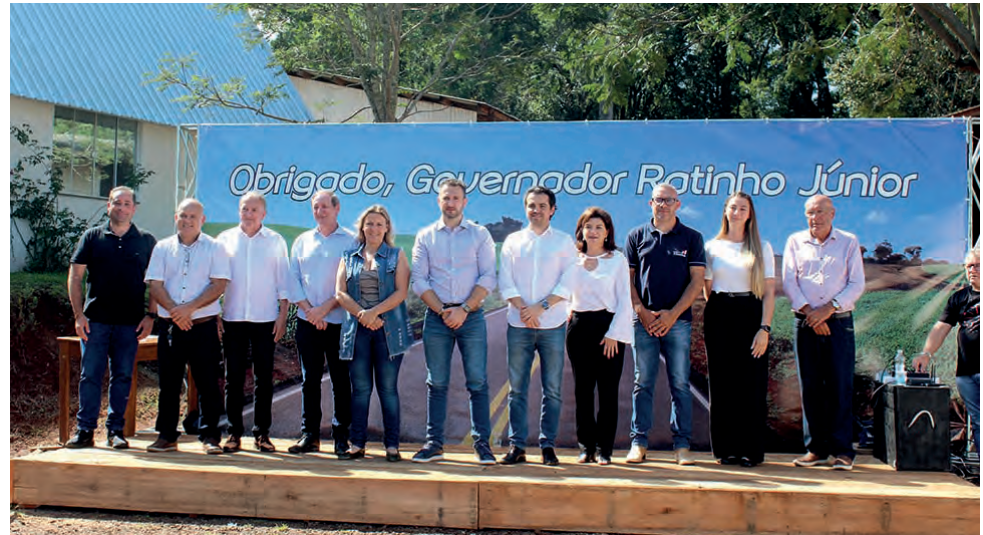
Inauguração aconteceu no último sábado (6)