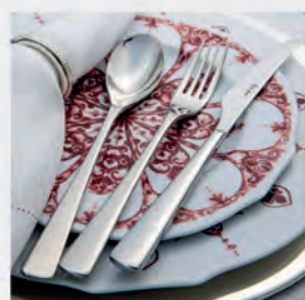
Faqueiro inox St James 77 peças