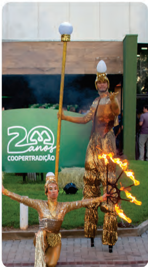
Grupo Felchak Produções