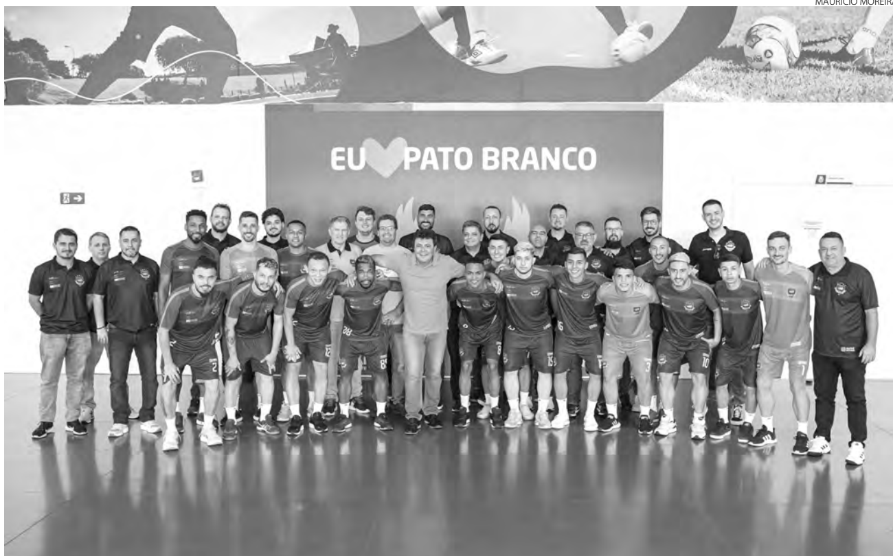
A apresentação do elenco foi realizada no Auditório do Largo da Liberdade