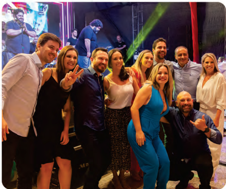
Equipe comercial da cooperativa e parceiros