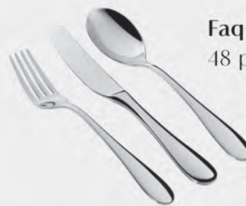
Faqueiro inox St James 48 peças