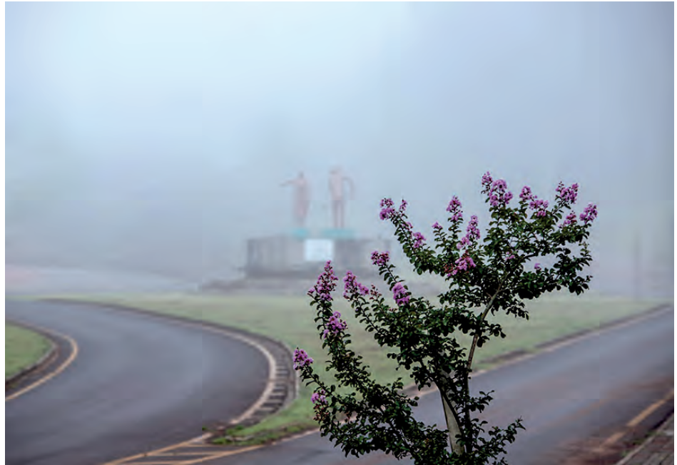
As primeiras horas da manhã dessa segunda-feira (23) lembrou o inverno em pleno verão