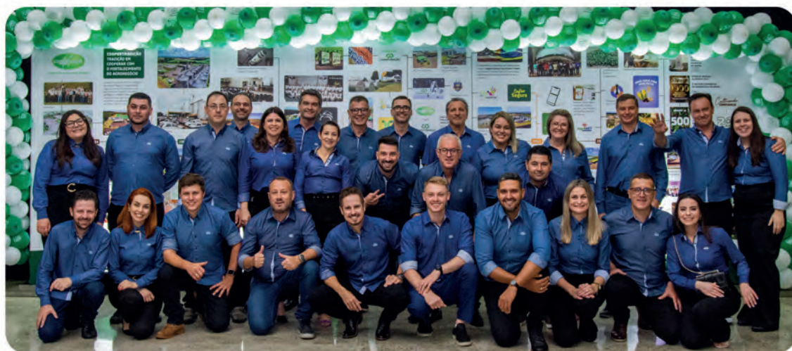
Equipe de colaboradores responsáveis pela organização e condução do evento