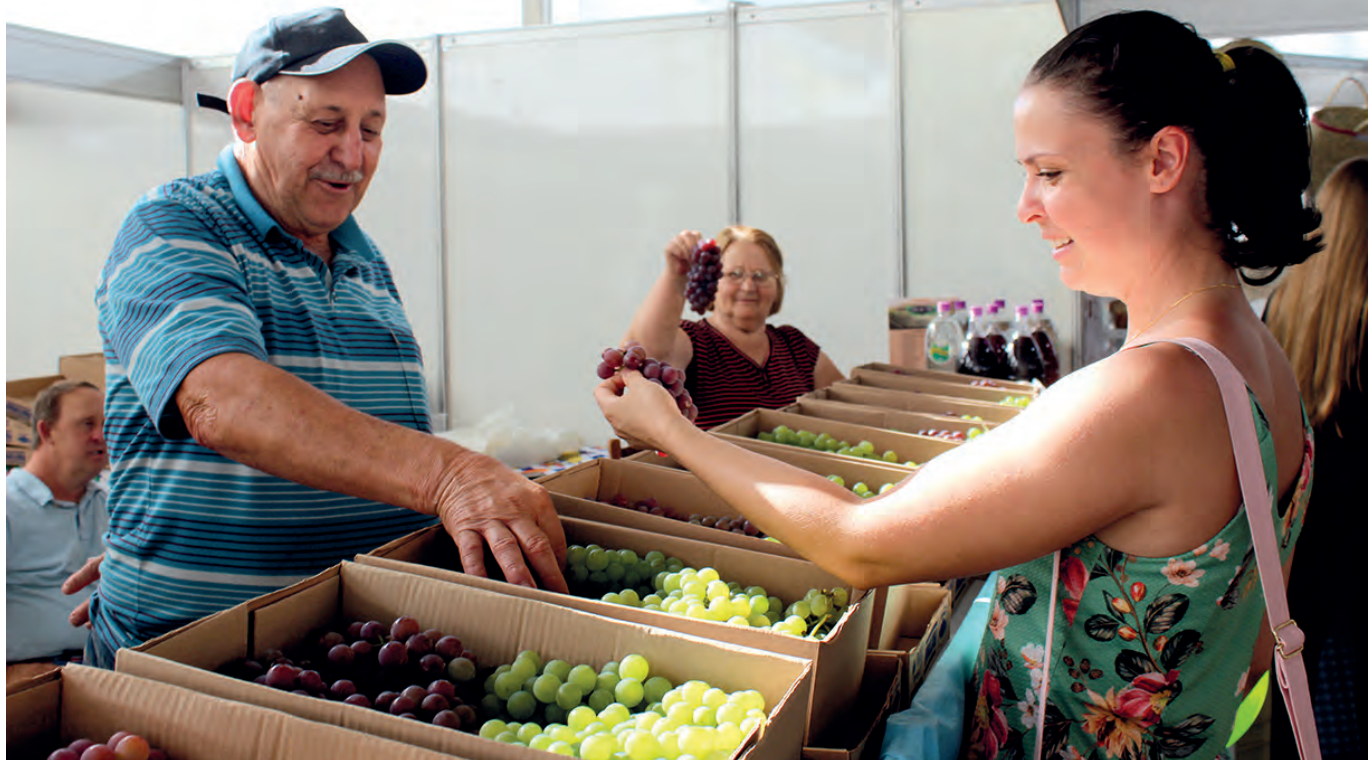
Comissão organizadora tinha como expectativa a comercialização de 30 toneladas de uva in natura

Vanessa Brugnera com AEN vanessa@diariosudoeste.com.br