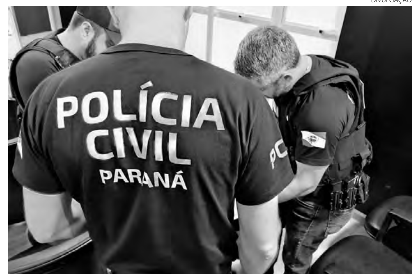
Mais de 50 policiais participam da operação, que contou com o apoio de um dos helicópteros da PCPR

As investigações continuam a fim de identificar outros integrantes da organização criminosa. (AEN)