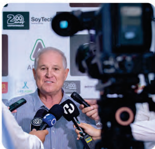
Coletiva de imprensa com mídia regional