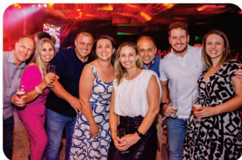
Cooperados da Coopertradição