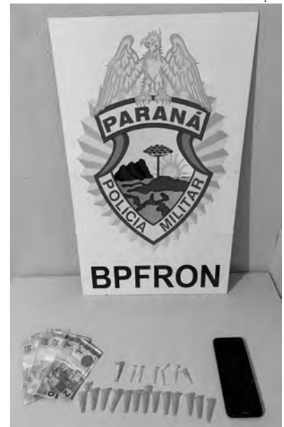
A cocaína apreendida em Santa Izabel do Oeste

O rapaz foi preso pela equipe policial. Ele foi entregue, juntamente com o crack apreendido, na Delegacia da Polícia Civil para as devidas providências.