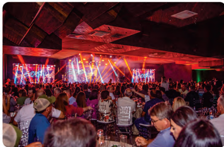
Evento reuniu cerca de 1200 pessoas