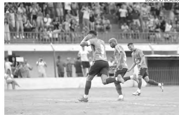
O Azuriz chegou a virar o placar, mas cedeu o empate nos acréscimos do segundo tempo

O resultado foi ruim para o Azuriz, que soma apenas dois pontos em três jogos, estando na oitava colocação no Campeonato Paranaense. O time comandado por Tcheco busca a reação nesta quarta-feira, quando recebe o São Joseense, às 19h15, no Estádio Os Pioneiros. (AB)