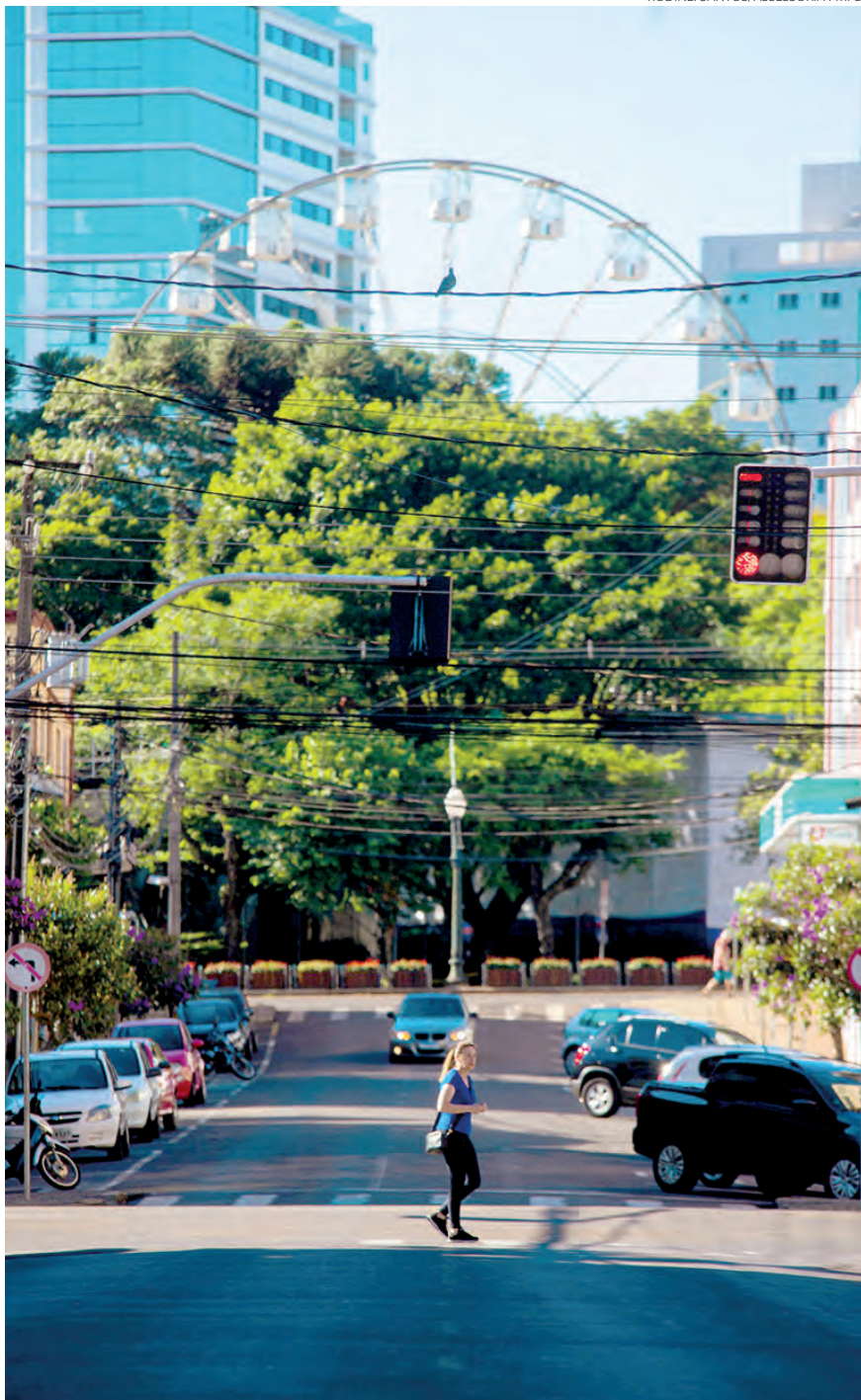
Este é o último final de semana para a população aproveitar os brinquedos na área central de Pato Branco