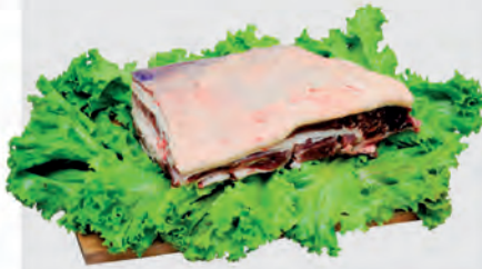
Costela Minga Bovina Kg