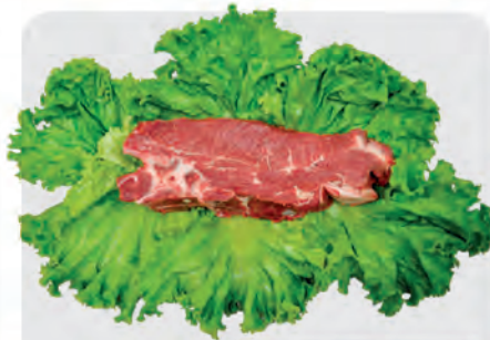
Filé Agulha Bovino Kg