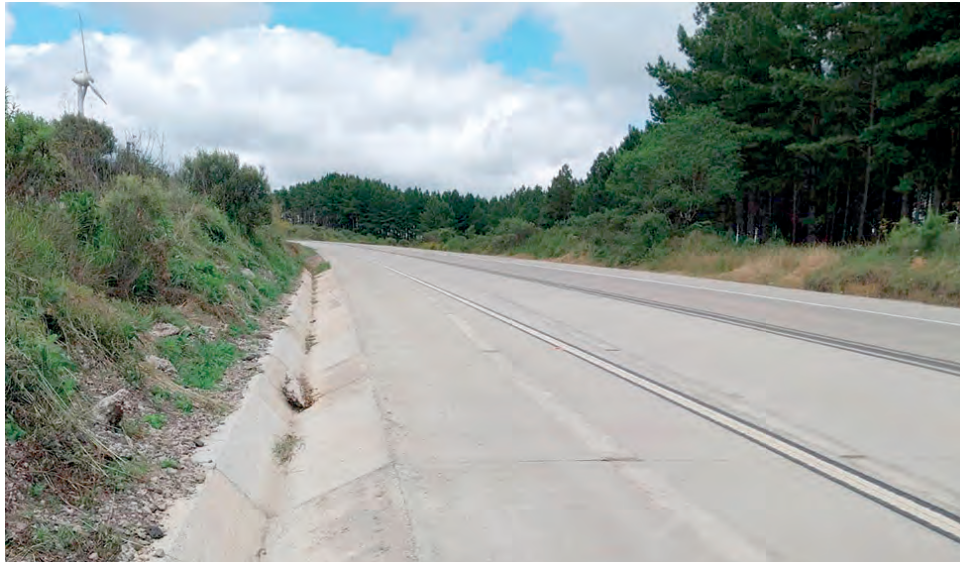
Os 59 quilômetros, da PR-280, entre Palmas e o trevo do Horizonte já foram concretados