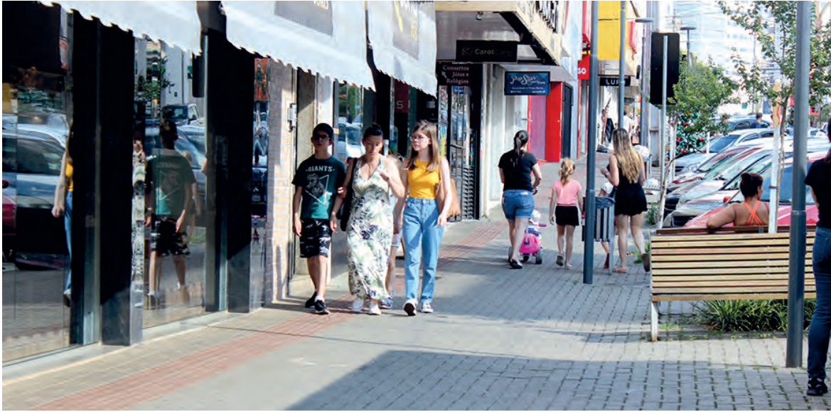
Comércio de Pato Branco ampliou horário de funcionamento antes do Natal