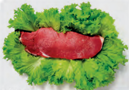
Churrasco Americano s/osso Bovino Kg