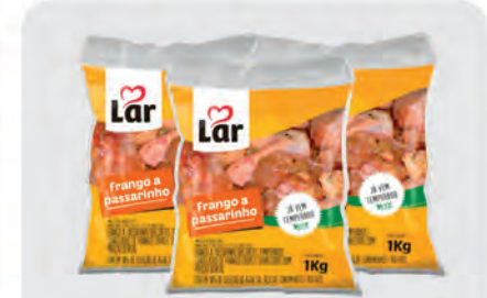
Frango a Passarinho Lar 1Kg