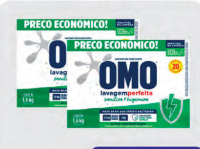
Sanitiza Roupas Omo Lavagem Perfeita 1,6Kg