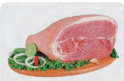
Pernil Suíno c/ Pele Kg