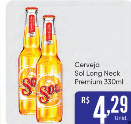
Cerveja Sol Long Neck Premium 330ml