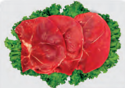
Bife Patinho Bovino Kg