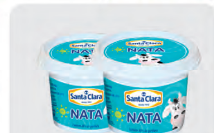
Nata Santa Clara 300g