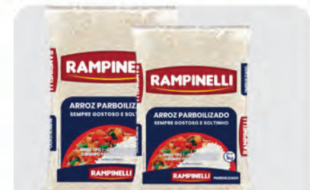
Arroz Parboilizado Rampinelli 5Kg