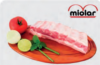
Costela Suína Miolar Temperada Kg