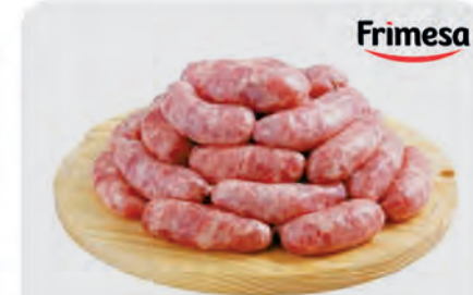
Linguica Toscana Frimesa Kg