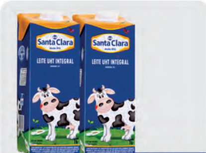
Leite Integral Santa Clara 1L