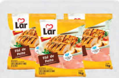
Filé de Peito Frango Lar 1kg