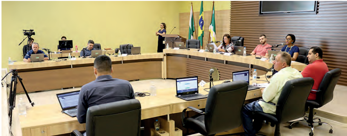
A aprovação do projeto dependia de dois turnos, ambos com maioria absoluta, ou seja, seis dos 11 votos

Ao justificarem a reprovação, os vereadores argumentaram que o projeto foi apresentado de maneira tardia pelo Executivo – a matéria foi protocolada no dia 16 de