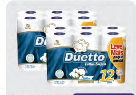
Papel Higiênico Duetto Leve Mais Pague Menos C/12 Rolos 30m