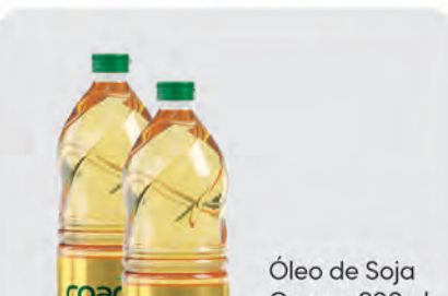
Óleo de Soja Coamo 900ml