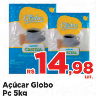
Açúcar Globo Pc 5kg