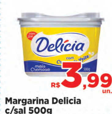
Margarina Delicia c/sal 500g