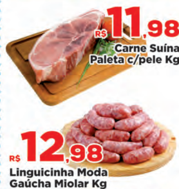
Carne Suína Paleta c/pele Kg