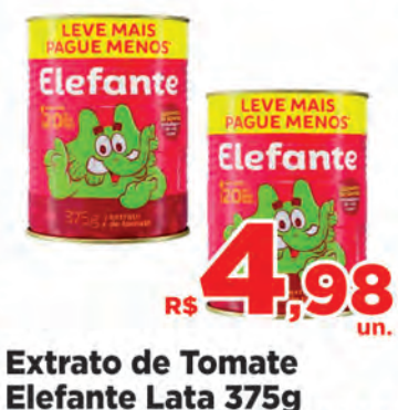
Extrato de Tomate Elefante Lata 375g