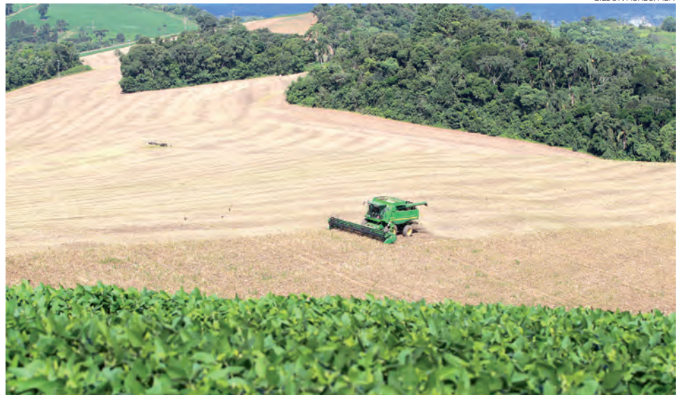
Apesar de problemas climáticos registrados entre setembro e outubro passado, a produção foi considerada de excelente qualidade

Sobre o trigo, o Boletim informa que o preço da saca também acumulou baixa. Em 12 de abril a cotação diária calculada pelo Departamento registrou média de R$ 81,24, valor 9% abaixo do praticado há um mês (R$ 93,47). Esses preços indicam um possível prejuízo