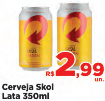
Cerveja Skol Lata 350ml