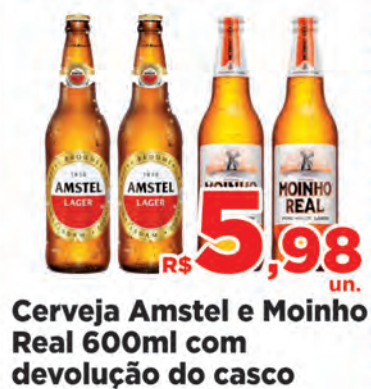
Cerveja Amstel e Moinho Real 600ml com devolução do casco