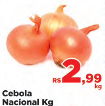
Cebola Nacional Kg