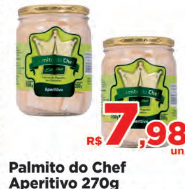
Palmito do Chef Aperitivo 270g