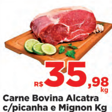
Carne Bovina Alcatra c/picanha e Mignon Kg