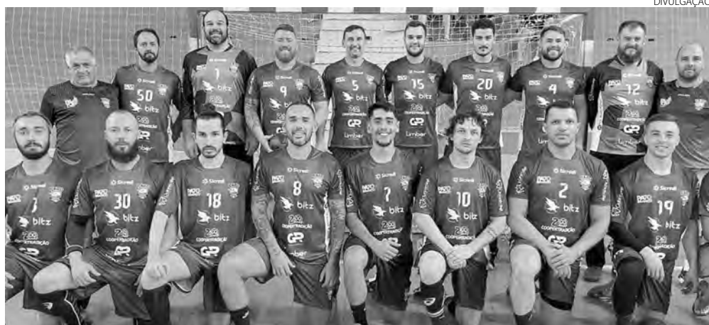
A equipe masculina do Pato Handebol enfrenta Mandaguai sábado, às 19h30, no Dolivar Lavarda