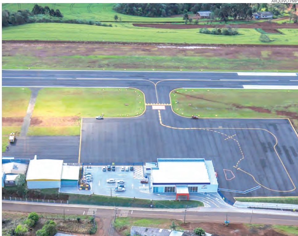
Segundo prefeito, instalação do Papi no aeroporto deve ser finalização em 30 dias

"O encontro teve como objetivo aproximar a com-