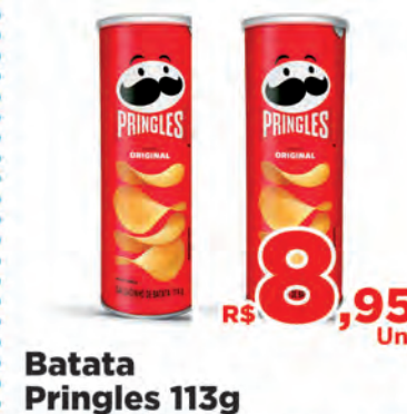
Batata Pringles 113g