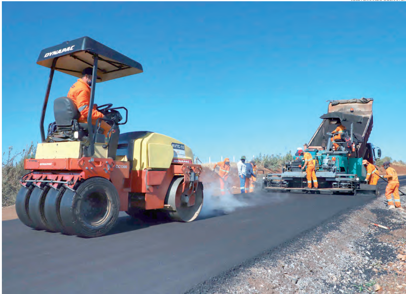
Dos 42 municípios do Sudoeste, 19 possuem até 7 mil habitantes