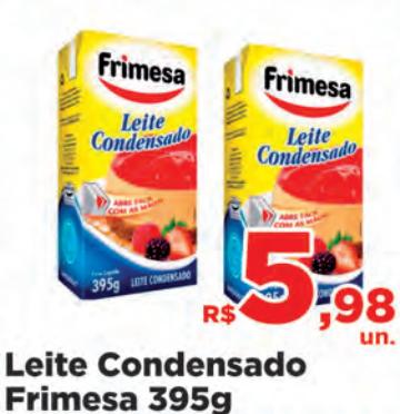
Leite Condensado Frimesa 395g