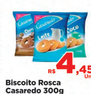
Biscoito Rosca Casaredo 300g