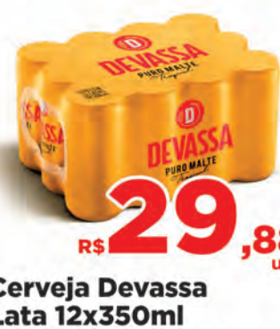
Cerveja Devassa Lata 12x350ml