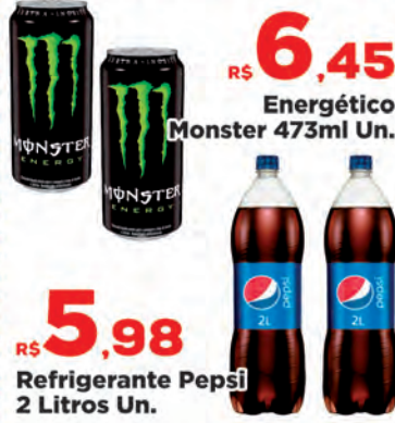
Energético Monster 473ml Un.