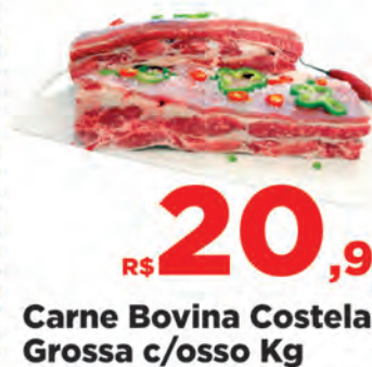
Carne Bovina Costela Grossa c/osso Kg