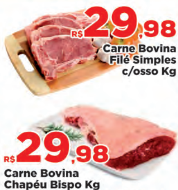
Carne Bovina Filé Simples c/osso Kg