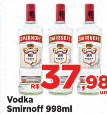
Vodka Smirnoff 998ml