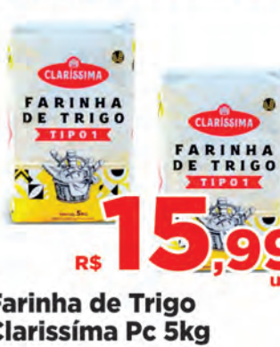
Farinha de Trigo Claríssima Pc 5kg