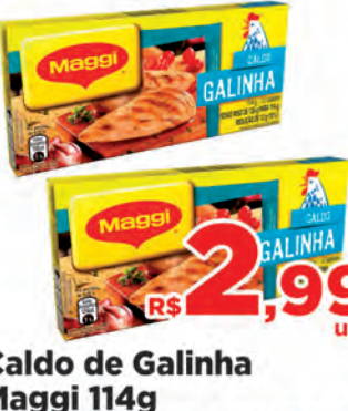
Caldo de Galinha Maggi 114g