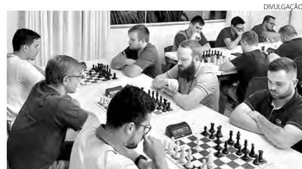
O xadrez está entre as modalidades em disputa

Os jogos estão sendo disputados no Largo da Liberdade, Sintético Araucária, AVM, ABS, Sesc, Sesi, Unidep, Ginásio Industrial, Ginásio Dolivar Lavarda, Grêmio Industrial Pato-branquense, Clube Pinheiros, Spa Tênis e Centro Aquático. (Assessoria)