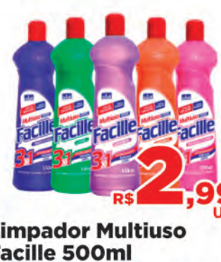
Limpador Multiuso Facile 500ml

46 3225-4911 - Pato Branco | Horário de atendimento: Segunda a sábado: 8h às 20h | Domingo das 8h às 12h