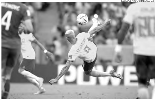
Richarlison fez os dois gols da vitória do Brasil sobre a Sérvia

O Brasil começou o segundo tempo mantendo a intensidade, e o gol parecia apenas questão de tempo. Aos 14 minutos, foi a vez de Alex Sandro chutar de fora da área, mas a bola ficou na trave. Aos 16 minutos, Richarlison abriu o placar em jogada que começou nos pés de Neymar. O camisa 10 limpou a marcação na