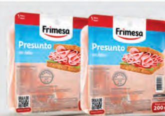
Presunto Cozido Frimesa Fatiado 200g