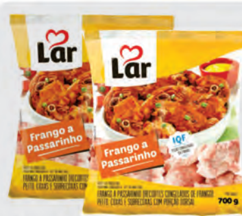
Frango a passarinho Lar 700g