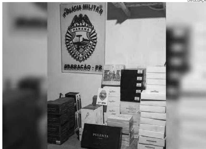
O menor estava transportando 266 garrafas de vinho

De acordo com a Polícia Militar, estavam realizando patrulhamento pela avenida Arnaldo Busato, em Barracão, quando avistaram um Gol, que estava totalmente rebaixado e desconfiaram que estava carregado com produtos contrabandeados. Os policiais deram voz de abordagem, mas o condutor não acatou e na fuga avançou preferências, colocando pedestres em risco. Após os alguns quilômetros de