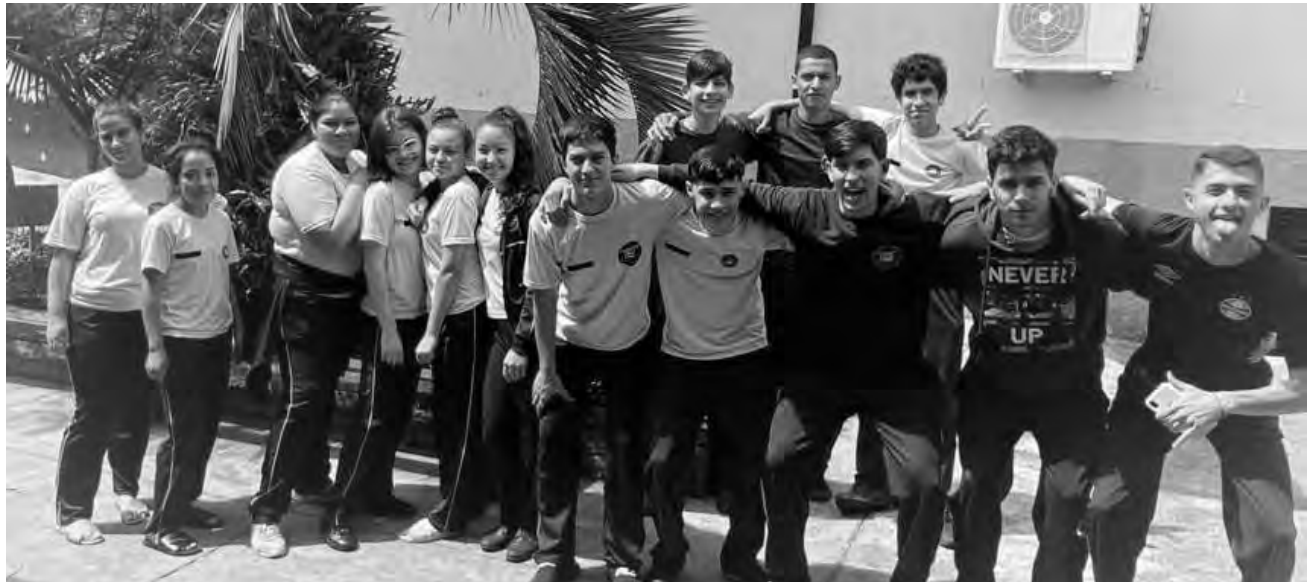
Apresentação aconteceu no último sábado

Buscando trabalhos dentro dos parâmetros de protagonismo estudantil, considerada uma ferramenta para que os alunos tracem sua