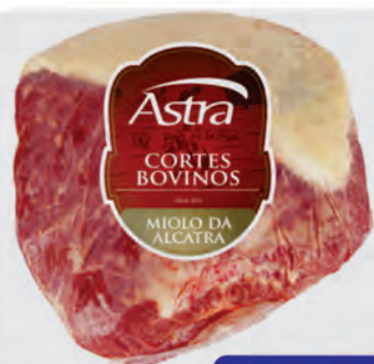
Miolo da Alcatra Bovina Astra Kg