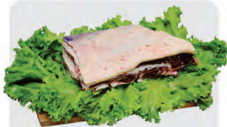
Costela Minga Bovina Kg