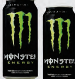
Energético Monster 473ml