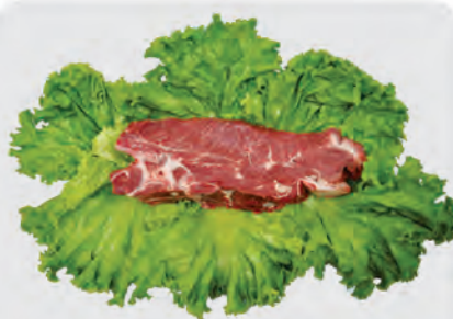
Filé Agulha Bovino Kg