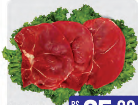
Bife Patinho Bovino Kg