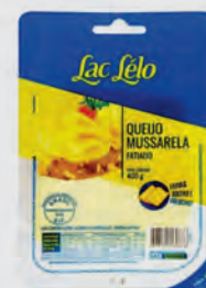
Queijo Mussarela Lac Lelo Tradic. Fatiado 400g