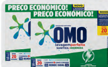
Sanitizante Pó Omo Lavagem Perfeita 1,6Kg