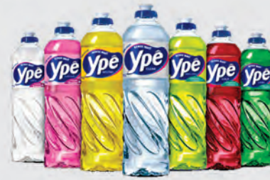
Detergente Líquido Ypê 500ml