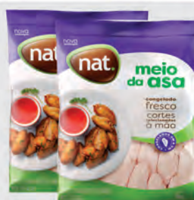
Meio da Asa Frango Nat 1Kg