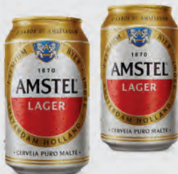
Cerveja Amstel Puro Malte Lata 350ml