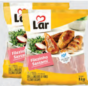
Filezinho Peito Frango Sassami Lar 1Kg