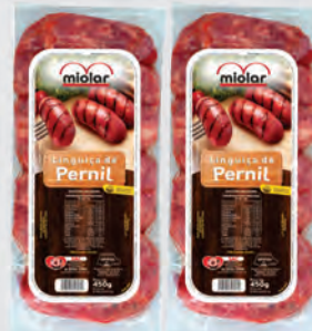
Linguiça de Pernil Miolar 450g