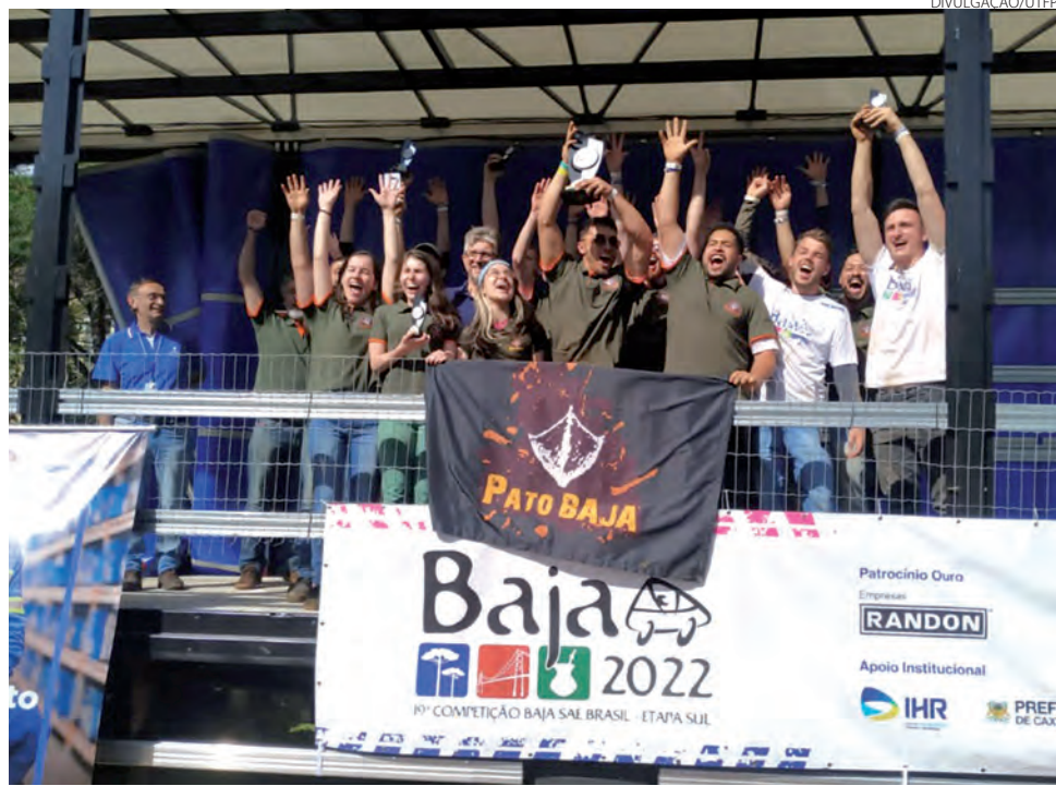
20 alunos participaram da competição

O segundo dia também rendeu premiações para os alunos, com a avaliação do protótipo segundo seu comportamento dinâmico, passando por provas de aceleração,