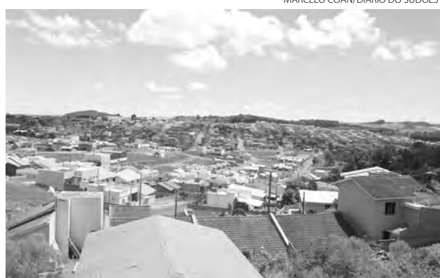
Segundo o Município, taxa de crescimento do Araucária Park é de 20% ao ano