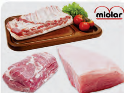
Picanha, Costela e Copa Suína Miolar Temperadas Kg