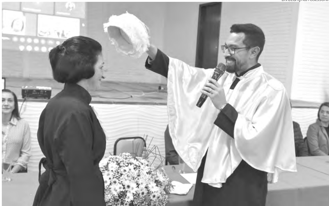
Professora tem mais de 30 anos de docência