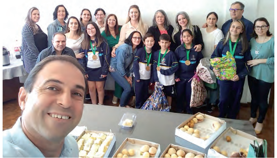
Na segunda-feira (24) houve a premiação das escolas participantes do Programa de Educação Ambiental (PEA), que na edição 2022 abordou o conceito de logística reversa. Pato Branco teve cinco escolas municipais premiadas Escola Vila Verde, Escola Vila Izabel, Escola Jardim Primavera, Escola São Luis e Escola Cachoeirinha.

SECRETARIA MUNICIPAL DE EDUCAÇÃO E CULTURA