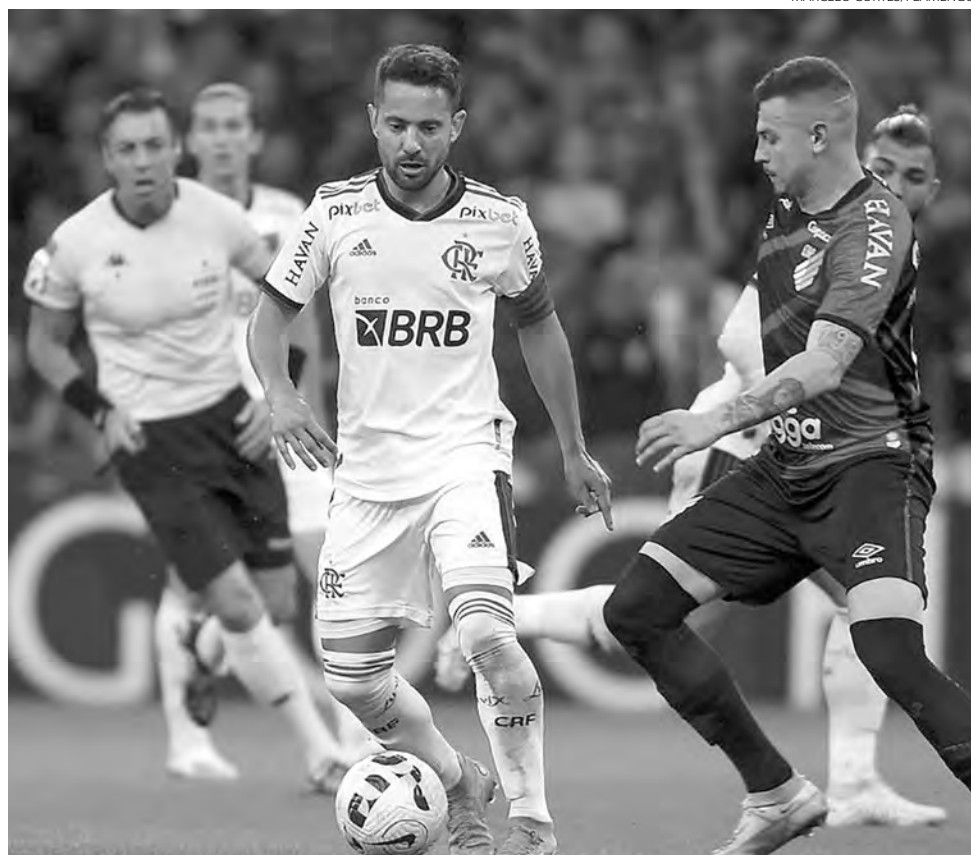
Flamengo e Athletico -PR se enfrentam neste sábado, pela final da Copa Libertadores da América