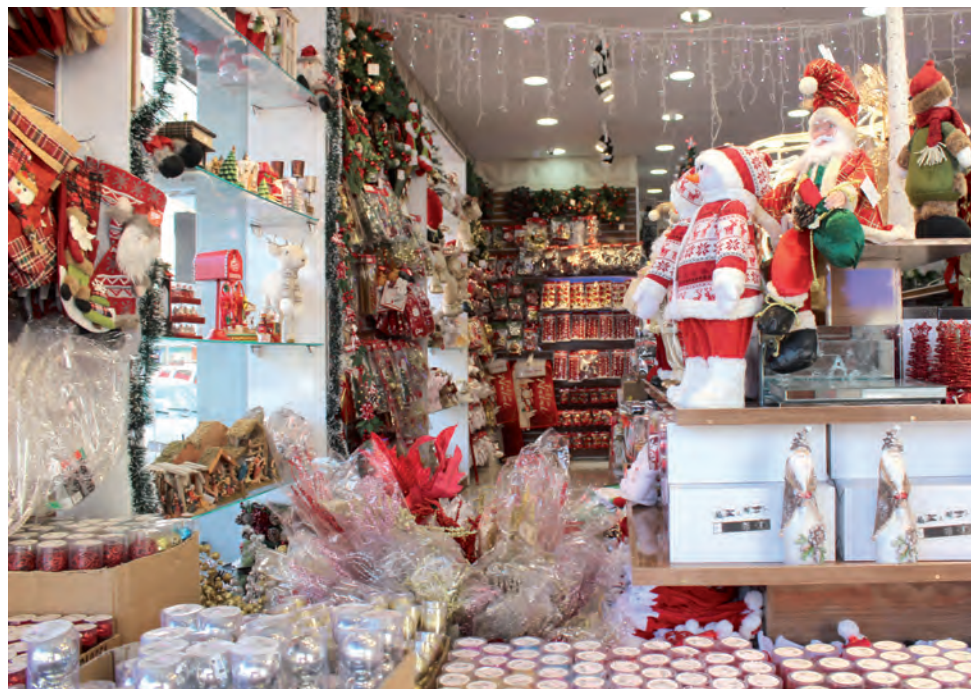
O comércio está preparado para atender os consumidores na primeira grande festividade, sem nenhuma restrição

Em alusão aos 70 anos de Pato Branco, serão sorte-