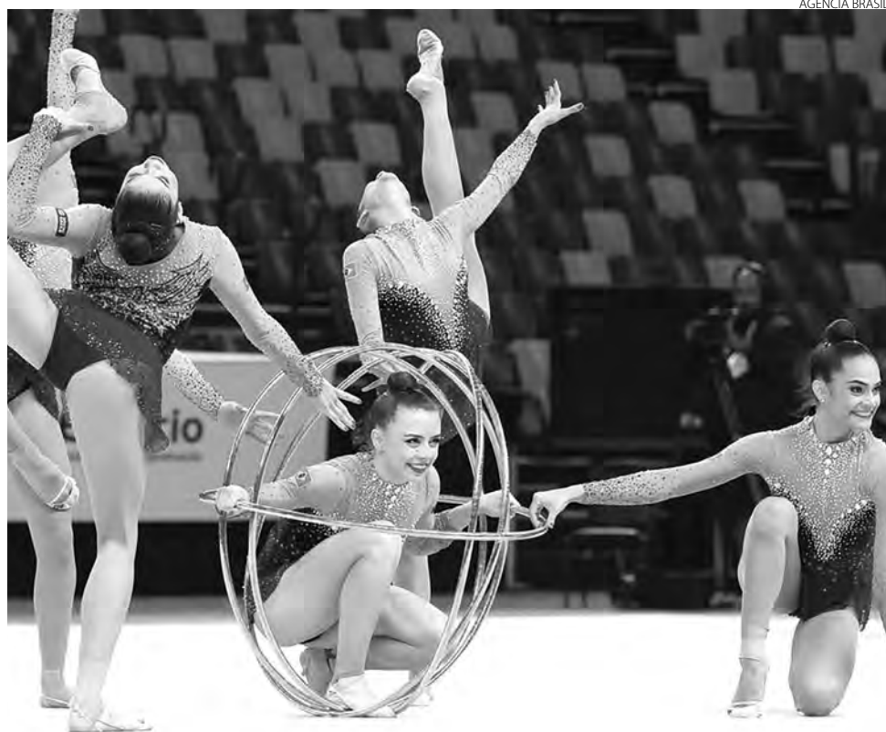
Competição começa 2ªfeira e acabará dia 15 de novembro

A entrada nos locais de disputas é gratuita para que o público possa acompanhar o evento, e também haverá transmissão no canal da CBDE no YouTube.