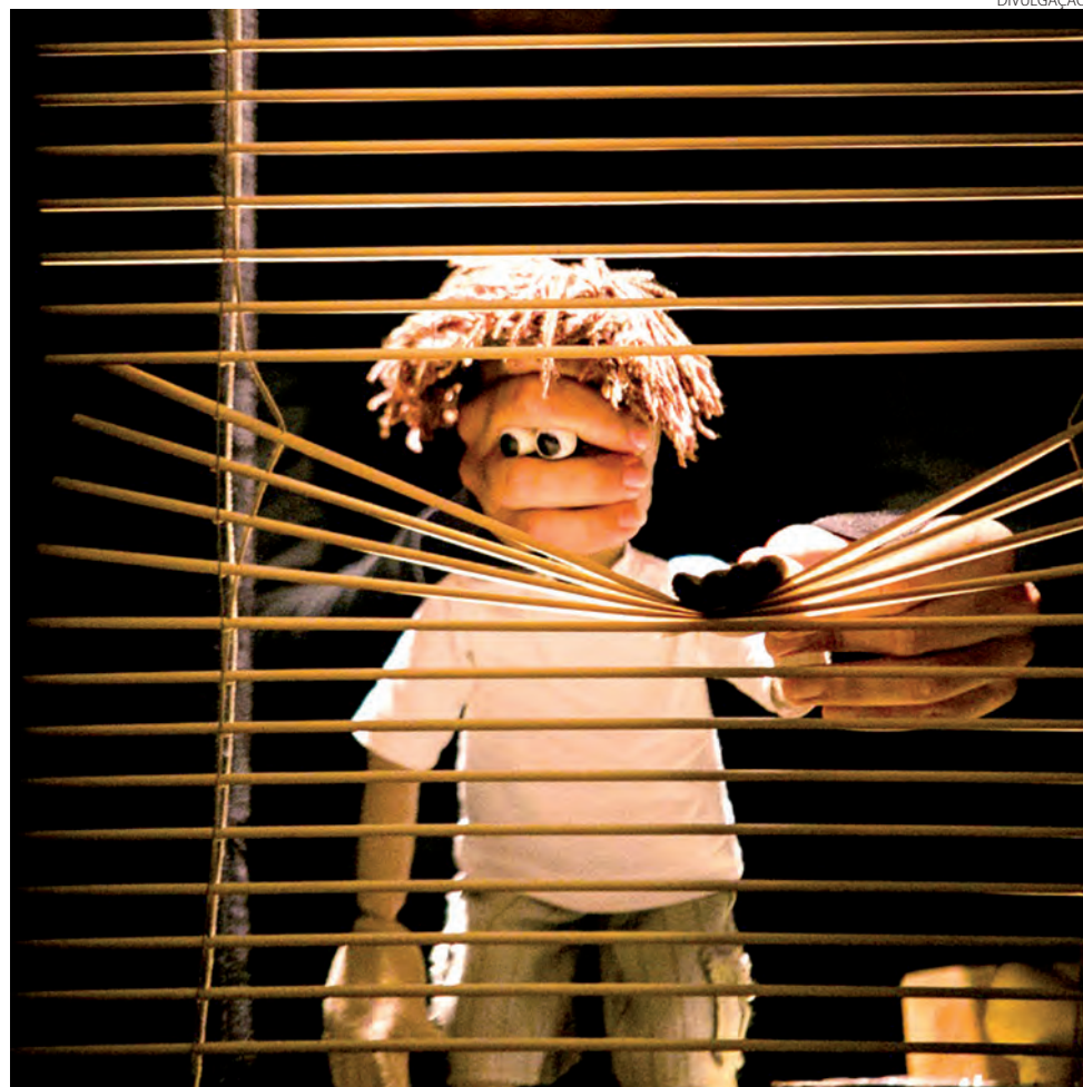
Peça teatral tem classificação livre

Sesi Cultura Paraná traz atrações no mês inteiro no Estado em homenagem às crianças