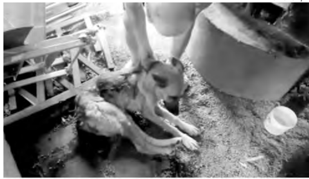
A cadela foi levada para uma clínica veterinária e está sendo bem tratada

mou que a cadela foi levada para uma clínica veterinária e está sendo bem tratada. Segundo o delegado, qualquer denúncia de maus-