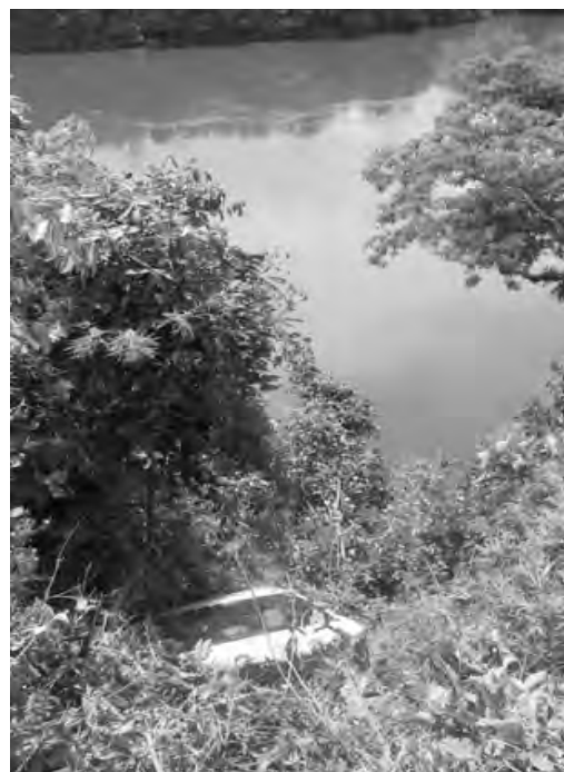
O Corolla que os bandidos roubaram durante a fuga foi encontrado abandonado

Os assaltantes abandonaram o Fox, que tem registro de roubo em Curitiba, nas imediações das agências e na fuga roubaram um Corolla, que posteriormente foi encontrado abandonado no interior de Sulina, em um matagal, onde a Polícia Militar localizou alguns pertences dos autores do roubo e um carregador com munições de pistola 9mm. Os bandidos teriam entrado numa área de mata, que foi cercada pelos policiais, inclusive com o apoio de um helicóptero, mas eles não tinham sido localizados até o fechamento dessa edição.