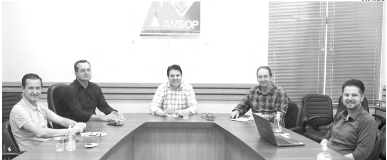
Reunião ocorreu na sexta-feira