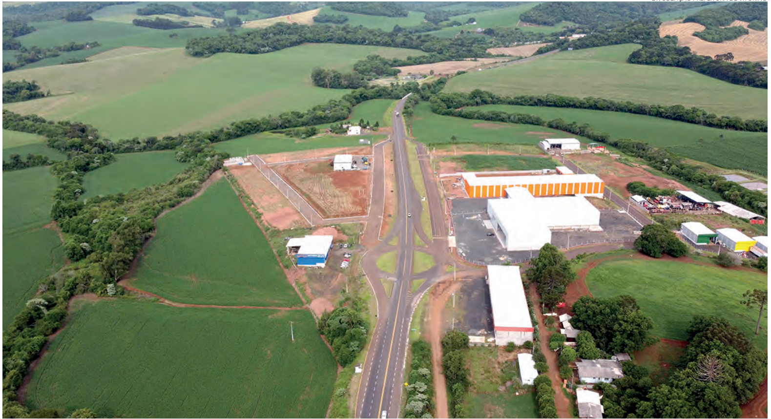
O complexo Cidade Industrial Vitorino I, anunciado este ano, tem capacidade de abrigar 16 novas indústrias

Com crescimento populacional apontado pelo Censo do IBGE em 2022 em 55%, chegando a 10.500 habitantes, o município de Vitori-