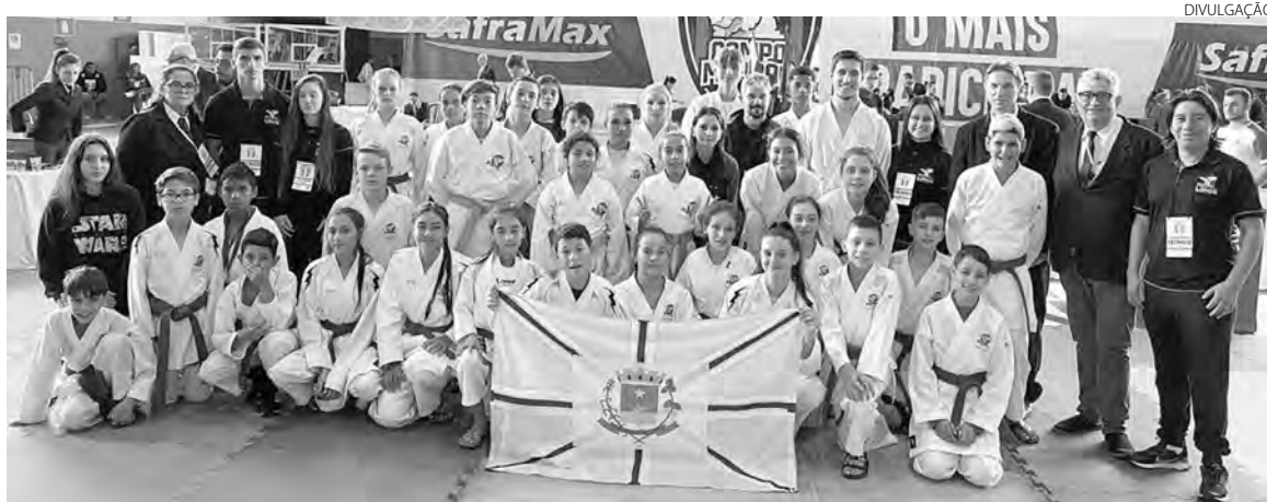
A equipe beltronense foi campeã geral com 418 pontos