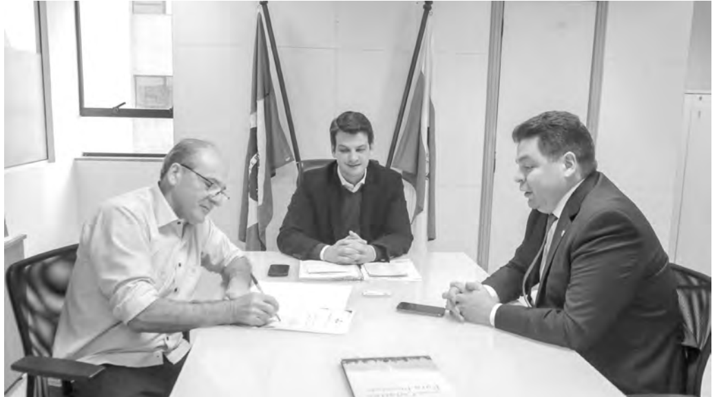
O futuro complexo esportivo recebeu recursos da Secid