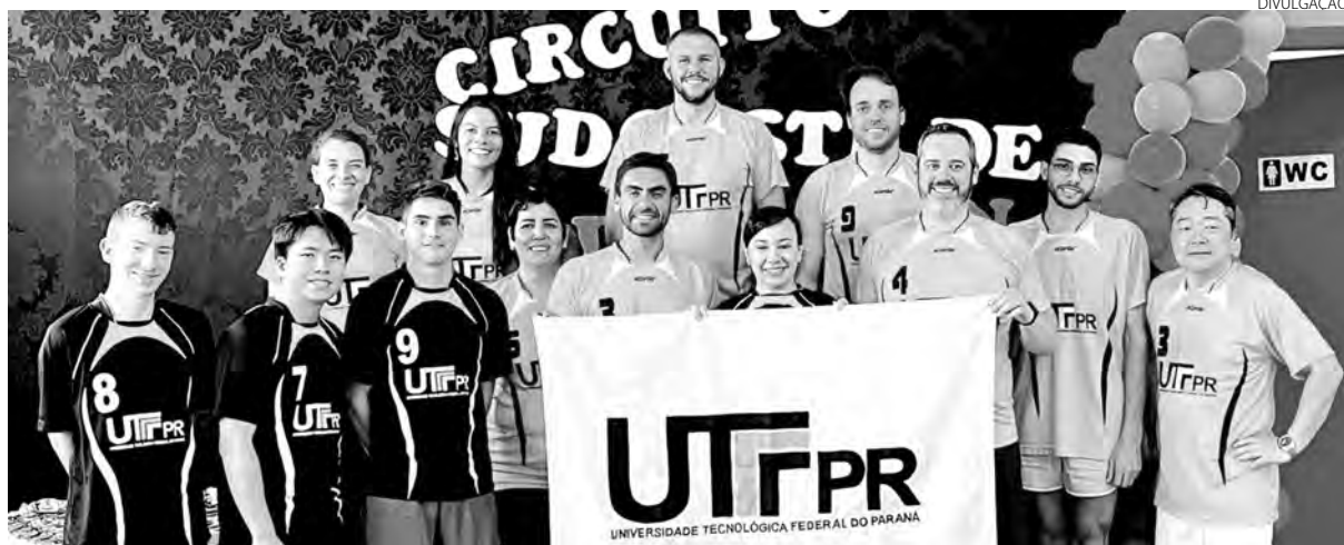
Os atletas da UTFPR que representaram Pato Branco na competição

No último final de semana foi disputado, em Chopinzinho, o 1º Circuito Sudoeste de Badminton, promovido pelo Departamento de Esporte da Prefeitura Municipal, juntamente com a Federação Paranaense de Badminton.