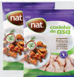
Coxinha da Asa Frango Nat 1Kg