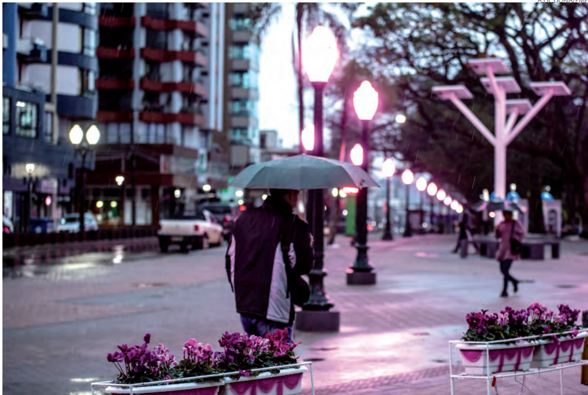
Manhã chuvosa de quinta-feira (6), em Pato Branco, com iluminação especial na praça Presidente Vargas, alusiva a campanha Outubro Rosa, de combate ao câncer de mama.

Cofundadora e CEO da Kaya Mind, primeira empresa brasileira especializada em dados e inteligência de mercado no segmento da cannabis, do cânhamo e de seus periféricos