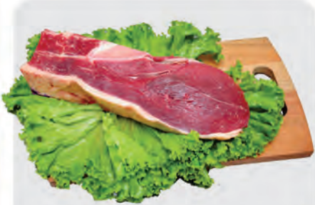
Alcatra c/ Osso Bovina Kg