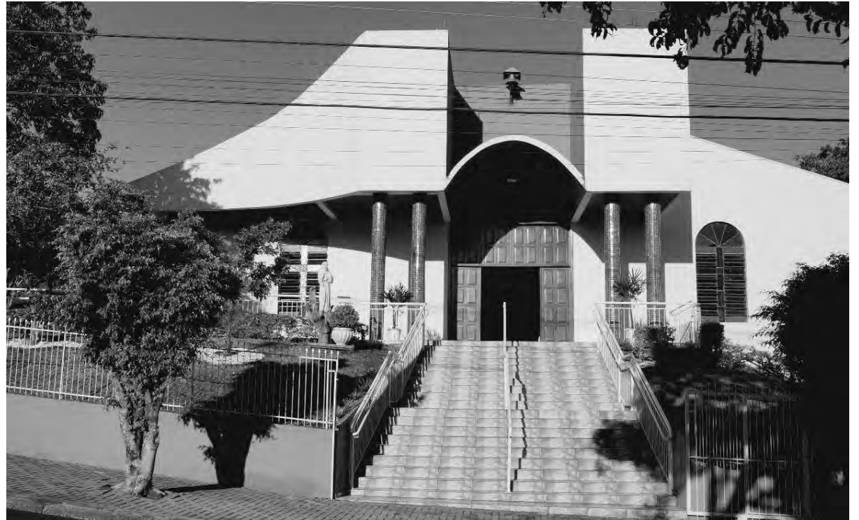
Recursos da festa deverão ser revertidos para reforma na entrada da igreja