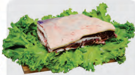
Costela Minga Bovina Kg