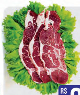
Filé Sete Bovino Kg