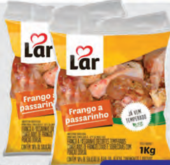
Frango a Passarinho Lar 1Kg