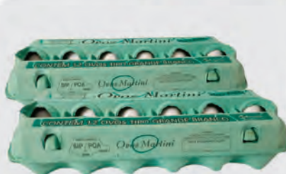
Ovos Branco Martini Dúzia