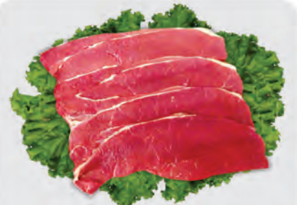
Bife Coxão Mole Bovino Kg