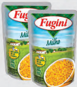
Milho Verde Fugini 170g