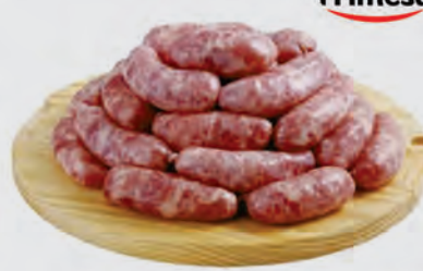
Linguiça Toscana Frimesa Kg