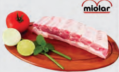
Costela Suína Miolar Temperada Kg