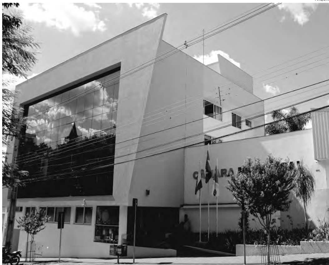
O Projeto de Lei foi apresentado em plenário na Câmara de Pato Branco na segunda-feira (3)

Podem se inscrever para receber o selo, as empresas do setor privado que tenham sede, filial ou representação no Paraná e empresas do setor público, estaduais e municipais.