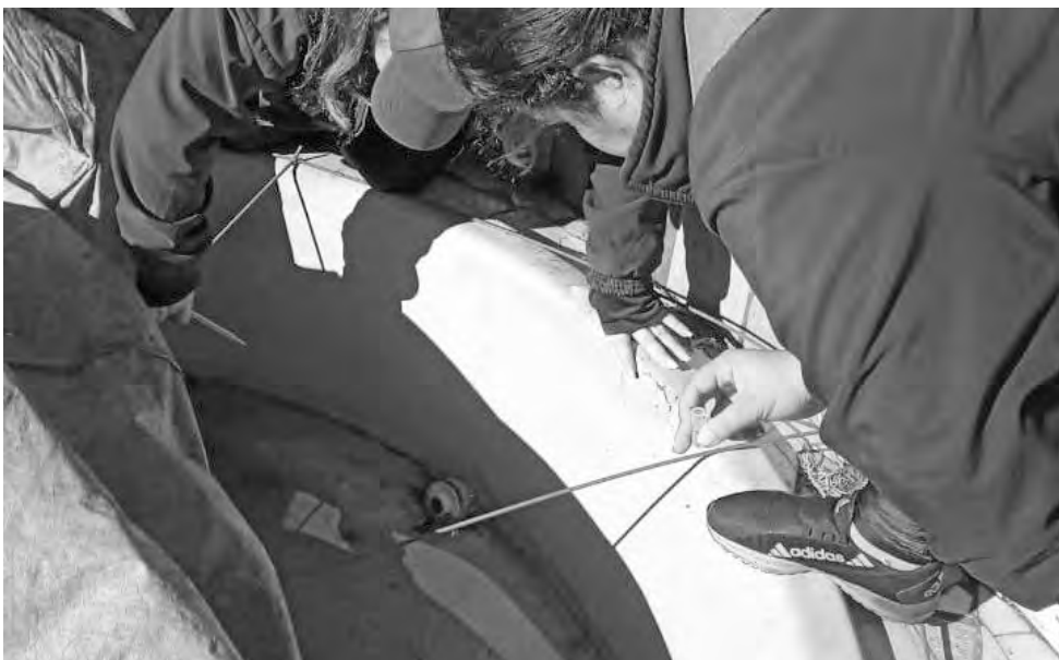
Agentes realizam mutirões para diminuir focos do mosquito