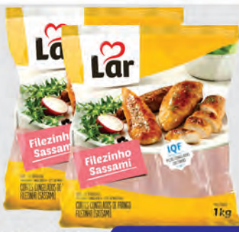
Filezinho Peito Frango Sassami Lar 1Kg