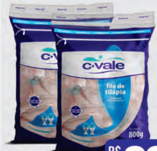
Filé de Tilápia C-Vale 800g