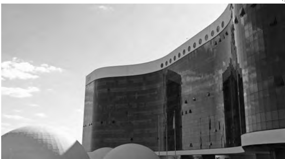
A propaganda eleitoral nas emissoras de rádio e televisão começa nesta sexta-feira (7)

Conforme prevê a Resolução TSE nº 23.610/2019, a propaganda para presidente da República será veiculada na televisão de segunda à sábado das 13h às 13h10 e das 20h30 às 20h40 (dez minutos de inserção diárias). No rádio, a propaganda para presidente vai ao ar de 7h às 7h10 e de