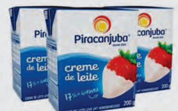
Crema de Leite Tradicional Piracanjuba 200g