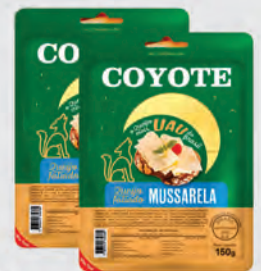
Queijo Mussarela Coyote Fatiado 150g