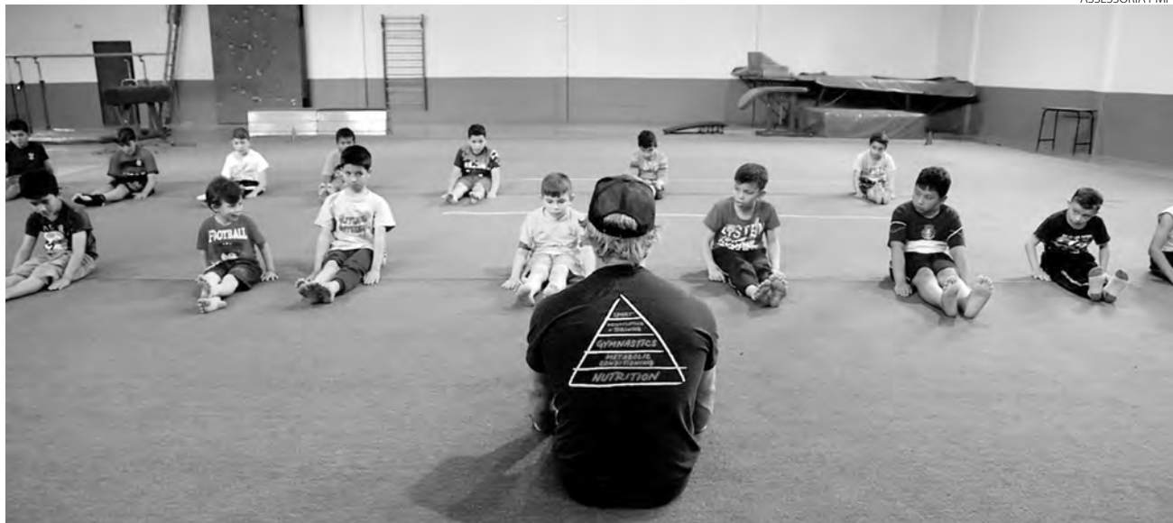
O projeto é realizado no ginásio do Centro Universitário de Pato Branco (Unidep)

Voltado para meninos de 5 a 12 anos, o projeto de Ginástica Artística já conta com a participação de mais de 70 crianças. Os treinos são realizados de segunda a sexta-feira, manhã e tarde, no ginásio do Centro Universitário de Pato Branco (Unidep).