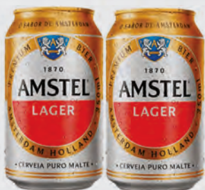
Cerveja Amstel Puro Malte 350ml