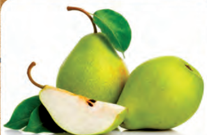
Pera Danjou Importada Kg