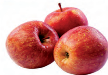
Maçã Fuji Cat 1 Importada Kg