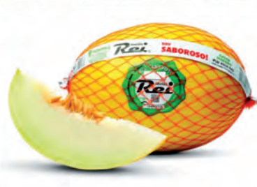
Melão Rei Kg