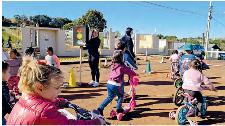
Atividade foi desenvolvida em todas as escolas municipais de Vitorino, que também envolveu o Cmei

Os professores e pedagogos organizaram materiais alusivos a carro, motocicleta e sinalização de trânsito, como faixa de pedestre e