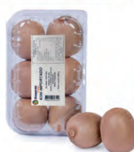
Kiwi Importado Bandeja 600g