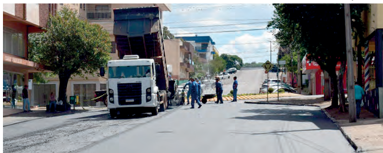
Neste momento, está sendo realizada a pavimentação em parte da área central