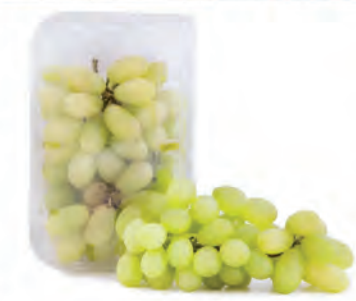
Uva Thompson Bandeja 500g