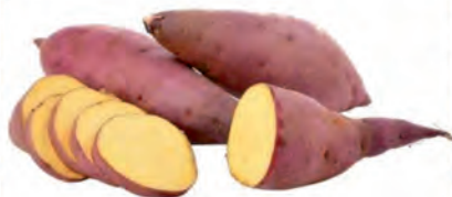
Batata Doce Roxa Kg