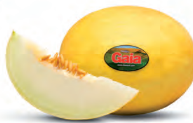
Melão Amarelo Gaia Kg