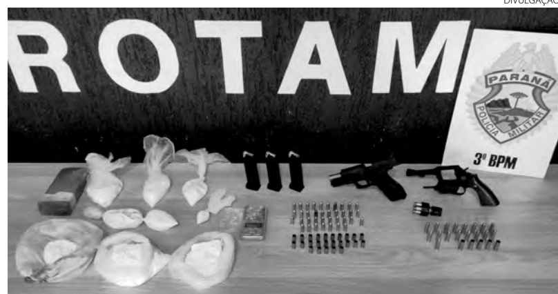
As drogas, armas e munições que foram apreendidas pela equipe da Rotam

Outra apreensão de droga ocorreu quarta-feira, em Ampére. Policiais do Batalhão de Polícia de Fronteira (BPFron) abordaram um