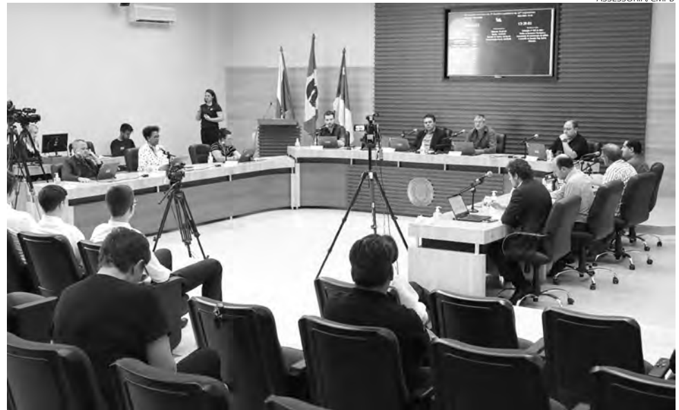
Os projetos aprovados, de autoria do Executivo, somam o total de R$ 7.936.559,59

Ainda aprovado, Projeto de Lei nº 141, de 2022, que autoriza abertura de crédito especial no orçamento do exercício de 2022, no valor de R$ 18.625,00, junto à Se-