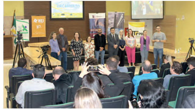
Com o lançamentos do Impostômetro ficará exposto permanentemente, teve início a Semana do Orçamento

O painel ficará exposto permanentemente e mostrará os dados referentes ao dia anterior. Também será possível mostrar os valores mensais e o montante arre-