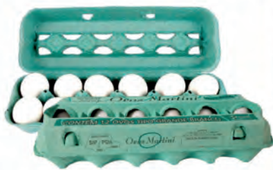
Ovos Branco Martini Dúzia