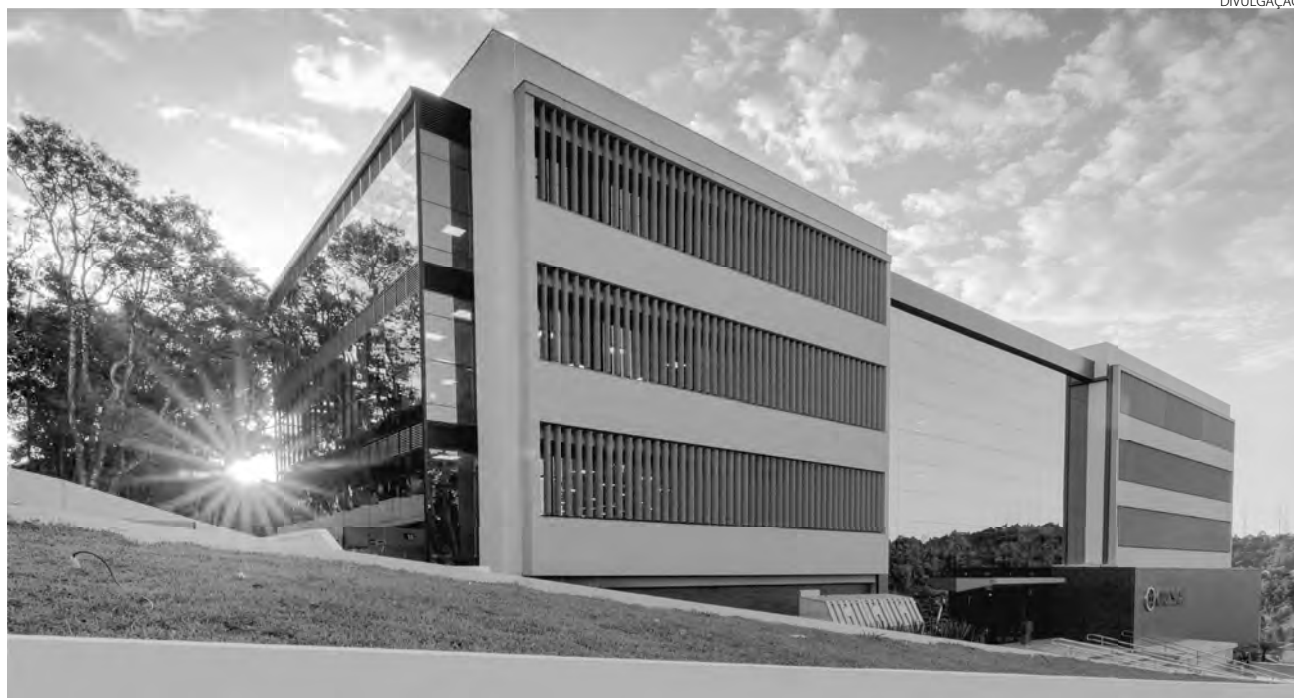
Agência de classificação de risco internacional revisou a Perspectiva do Rating de Longo Prazo para Positiva