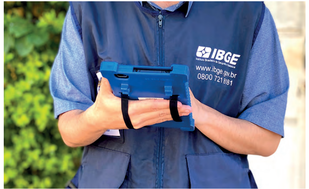
31,4% questionários aplicados em Pato Branco estão em andamento, segundo o portal do IBGE

Ainda levando em consideração a informação disponibilizada na terça, no Paraná, foram contadas 5.295.389 pessoas em 1.934.565 domicílios. O número de pesso-