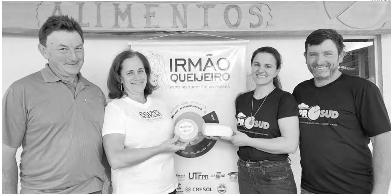
Proprietários das Queijos Martinazzo de Itapejara D'Oeste e Irmãos Queijeiros de Chopinzinho. As duas queijarias receberam medalha de Prata no 2º Concurso Mundial do Queijo do Brasil