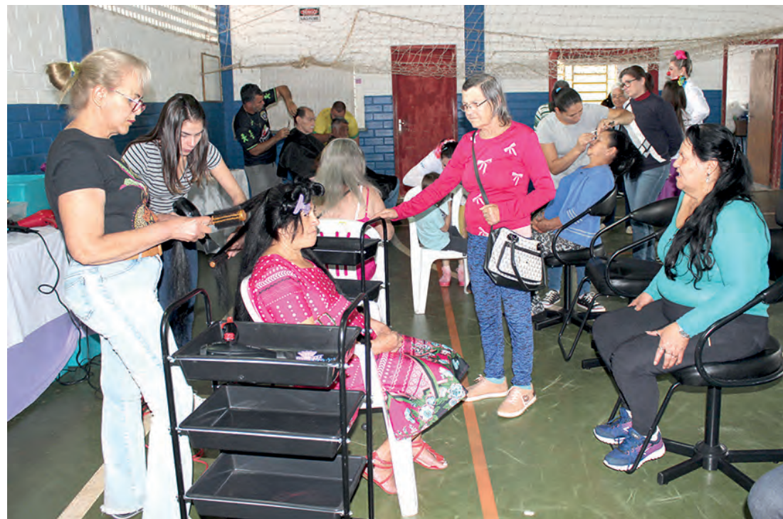
Serviços de beleza, de saúde e informações estavam disponíveis