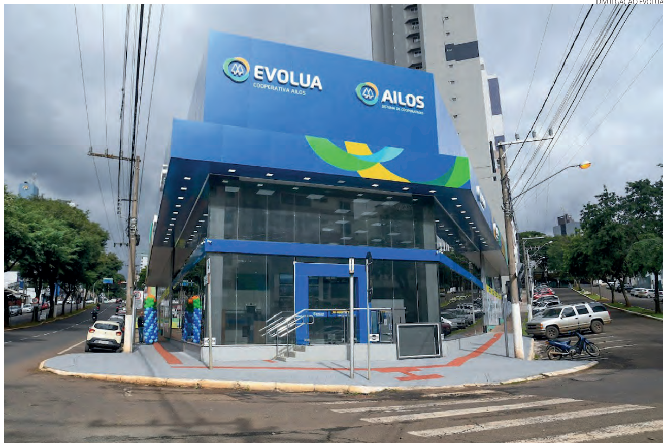
Agência Evolua Chapecó – Nereu Ramos, uma das três unidades da Evolua no município catarinense

São duas as condições para que as empresas obtenham crédito via Pronampe. Uma delas é autorizar o compartilhamento de dados através do sistema e-CAC. A outra diz respeito à quantidade de colaboradores: é necessário manter o quadro igual ou superior ao último dia do ano anterior à contratação do financiamento e permanecer com essa quantidade por 60 dias após a liberação do crédito. “A empresa precisa comprovar que mantém a mesma quantidade de colaboradores que tinha em 31 de dezembro de