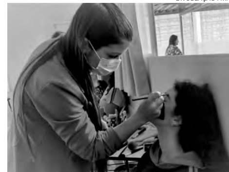
Programa atende adolescentes em situação de vulnerabilidade