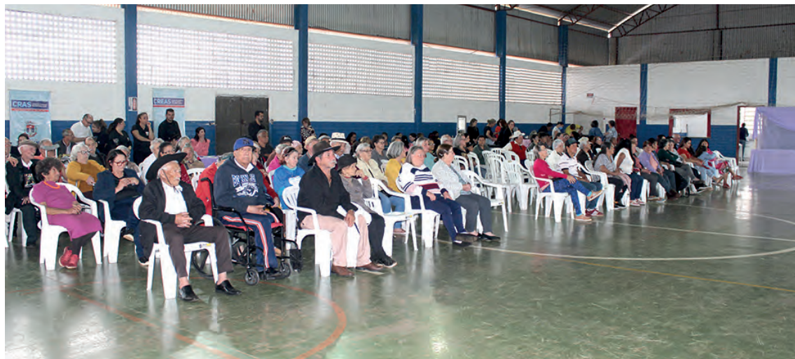
Público participante do evento

Na opinião da coordenadora, a integração dos participantes valoriza a convivência dos idosos. "Os idosos muitas vezes ficam sozinhos em casa, então a gente traz eles para o Cras para fazer