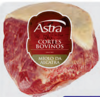
Miolo da Alcatra Bovino Astra Kg