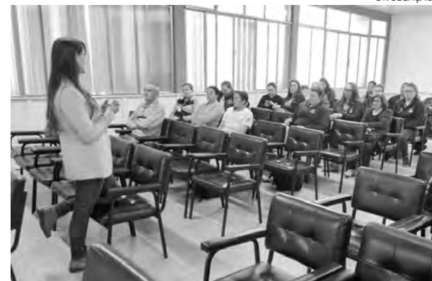
Ação foi desenvolvida na programação do Setembro Amarelo