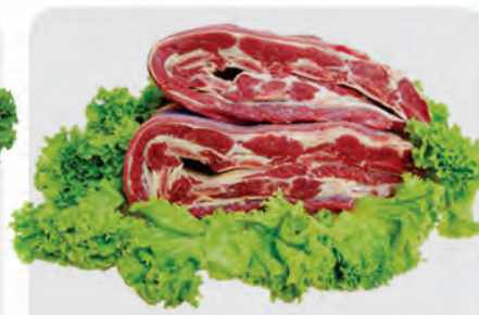
Costela Ripa Bovina Kg