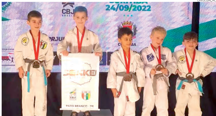
Os atletas da categoria Sub-9 do Judô Sonkei se destacaram na Copa Paraná