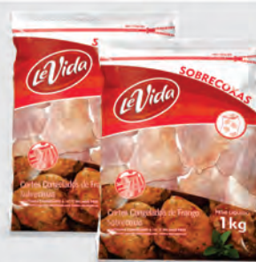
Sobrecoxa Frango Le Vida 1Kg