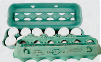
Ovos Branco Martini Dúzia