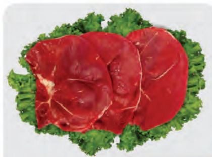
Bife Patinho Bovino Kg