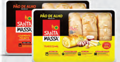
Pão de Alho Santa Massa 400g