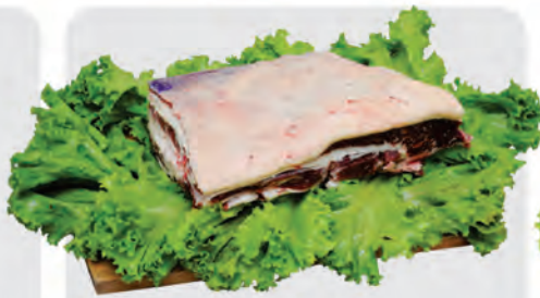
Costela Minga Bovina Kg