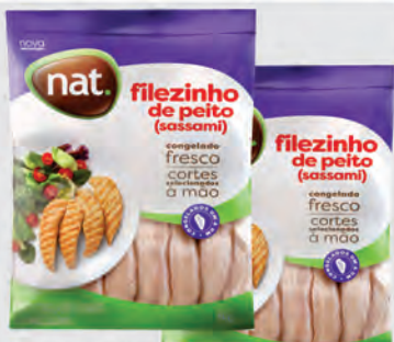
Filezinho Peito Frango Sassami Nat 1Kg