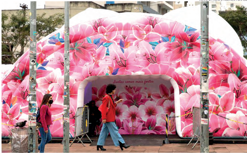
Busto feminino gigante instalado pelo movimento Coletivo Pink – Por um Outubro Além do Rosa

O autoexame é importante, reforçam especialistas, mas a mamografia é o principal exame para detectar o câncer de mama na fase inicial. De acordo com a Sociedade Brasileira de Mastologia (SBM), o autoexame é indicado como autoconhecimento em relação ao próprio corpo, mas não deve substituir os exames realizados ou prescritos pelo médico, já que muitas lesões, ainda pequenas, não são palpáveis. Contudo, 64% das mulheres que participaram da nova pesquisa do Ipec dizem acreditar que o procedimento seria o principal meio para o diagnóstico do câncer de mama no estágio inicial.