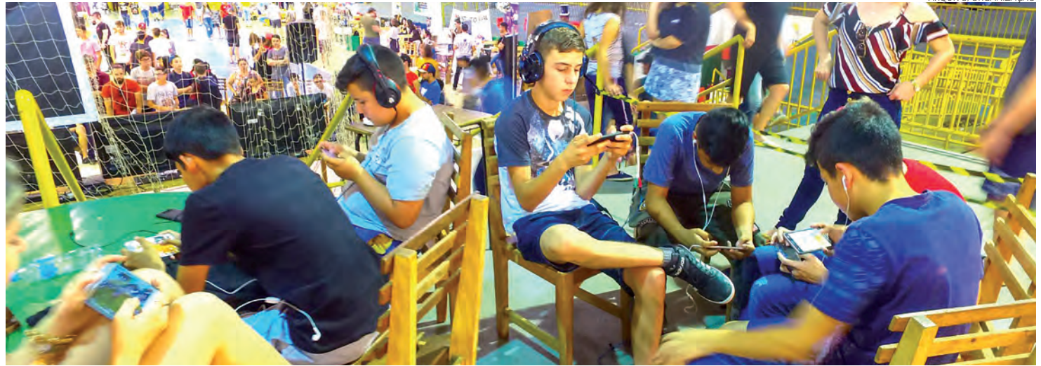
Esta será a terceira edição do evento