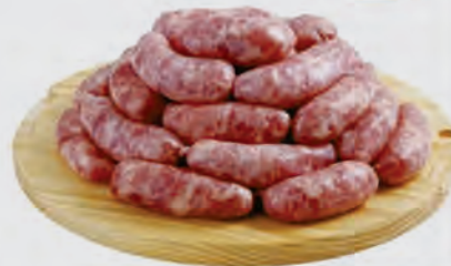
Linguíça Toscana Frimesa Kg