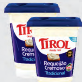
Requeijão Cremoso Tirol 180g