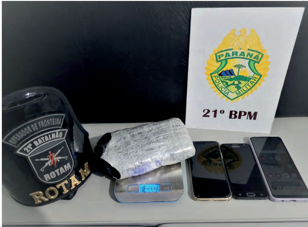
As duas mulheres alegam que foram contratadas para transportar a droga

O preso, de 30 anos, foi entregue, juntamente com as drogas e o dinheiro, na Delegacia da Polícia Civil de Guaíra para as devidas providências.