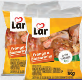
Frango à Passarinho Lar 1Kg