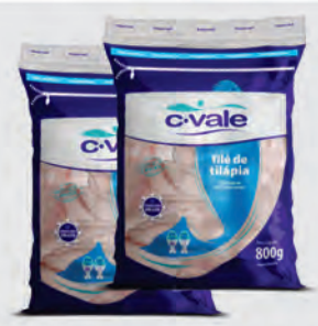
Filé de Tilápia C-Vale 800g