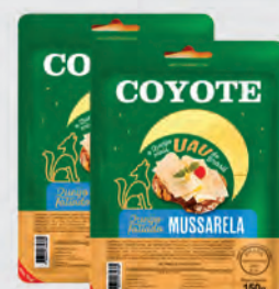
Queijo Mussarela Coyote Fatiado 150g