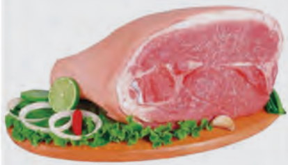
Pernil Suíno c/ Pele Kg