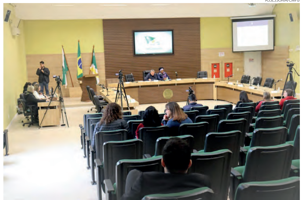
No quadrimestre, a receita arrecadada foi de R$ 163.951.443,08 e a despesa foi de R$ 160.432.871,37

A apresentação dos dados foi realizada pela diretora do Departamento de