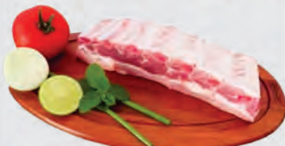
Costela Suína Miolar Temperada Kg