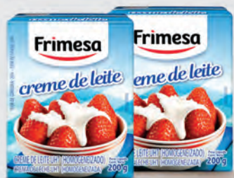
Creme de Leite Frimesa Tradicional 20% Gordura 200g