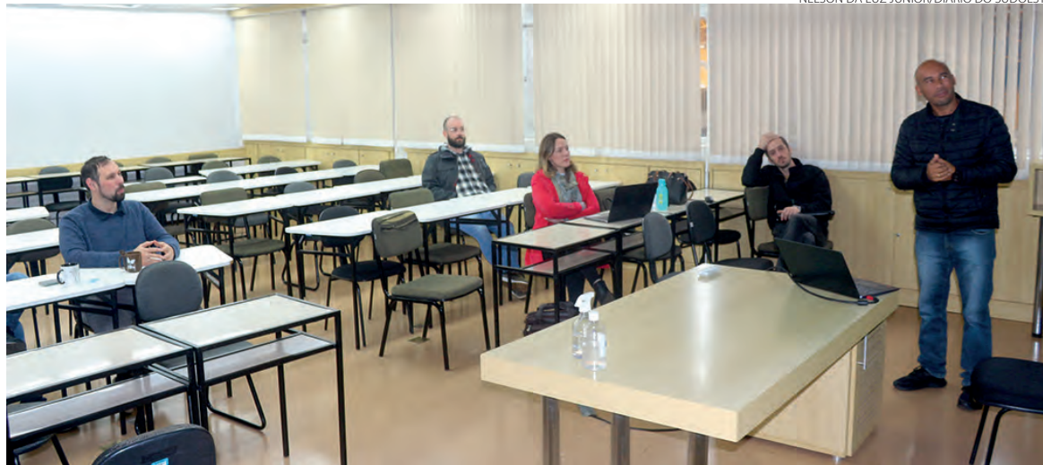
Pesquisador espanhol (à esquerda na foto) trocou de experiências com professores do PPGTP

O pesquisador visitante atua em diferentes frentes de estudo, principalmente na síntese e preparação de materiais de carbono, que podem ser aplicados em processos de absorção e processos catalíticos. Outra linha de pesquisa de Tuesta é o tratamento de águas