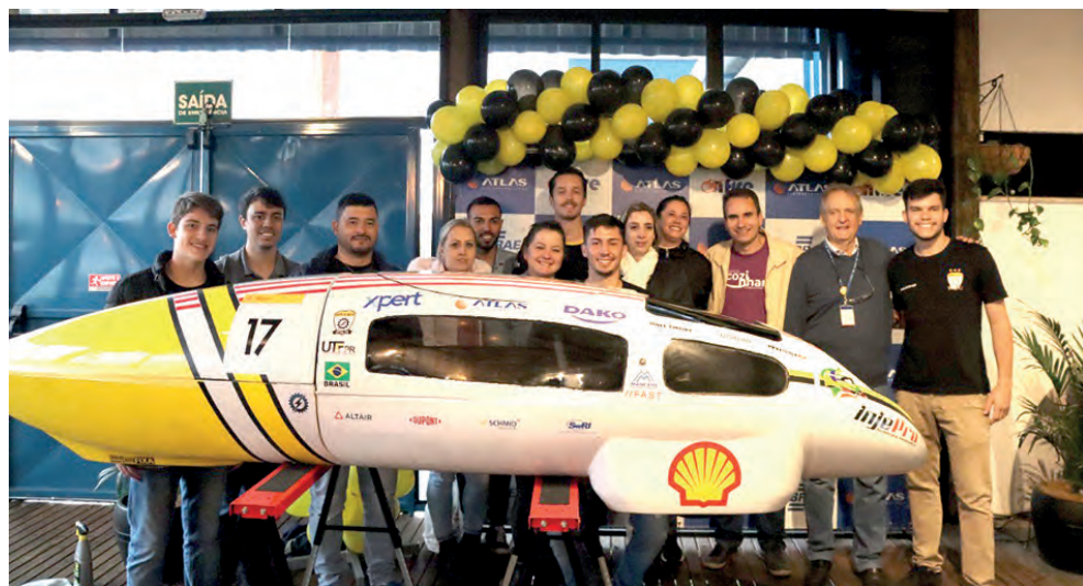
Atlas Eletrodomésticos recebe a equipe da Pato a Jato, campeã da competição Shell Eco Marathon 2022