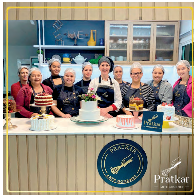
Módulo 1 do Curso de Bolos Artesanais Pratkar. É sempre maravilhoso poder compartilhar momentos deliciosos com todas! A próxima turma será de bolos artesanais, e o curso será realizado nas noites dos dias 27, 28 e 29 de setembro. Confira a página do Pratkar Arte Gourmet no Instagram e reserve a sua vaga.