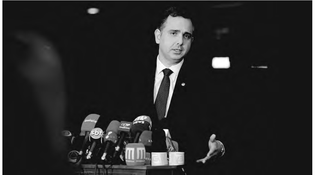
Rodrigo Pacheco, presidente do Senado, em entrevista na quinta-feira (8)