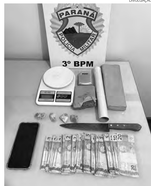
As drogas e o dinheiro que foram apreendidos em Coronel Vivida

Questionados, o condutor relatou não possuir a Carteira Nacional de Habilitação (CNH) e que o objeto dispensado seria uma porção maconha. Diante do relato, a equipe realizou diligências e logrou êxito na localização do objeto em questão, e constatou tratar-se de 25 gramas de crack. Desta forma os abordados receberam voz de prisão por tráfico de drogas e foram encaminhados para os procedimentos da Polícia Judiciária. Ainda foram confeccionadas as notificações de trânsito cabíveis e o veículo retido. (AB com Assessoria)