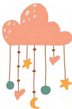
Layla Vendrusculo Rodrigues

"Não deixem que o mal vença vocês, mas vençam o mal com o bem." (Rm.12:21)