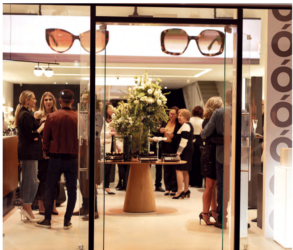
A Especialista Ótica Black é uma loja moderna, ampla e agradável, que estará sempre alinhada às tendências mundiais