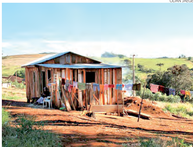
A Terra Indígena Mangueirinha é a maior acomodação indígena do Sudoeste

Além das perguntas realizadas a todos os brasileiros, como se frequentam a escola, renda e entre outras questões, os indígenas deverão responder se se consideram indígenas, etnia a qual