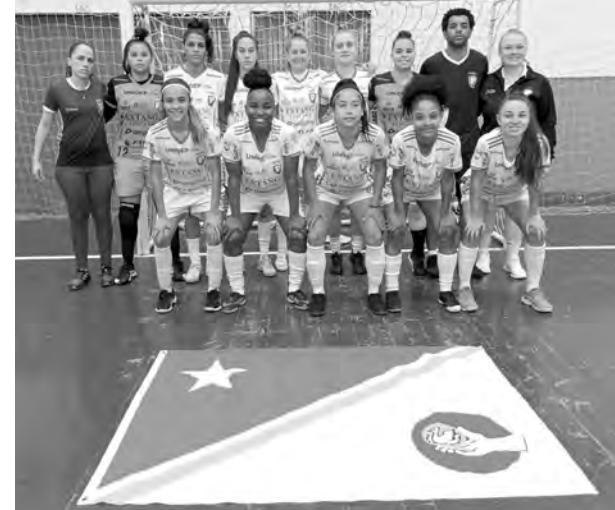
A equipe de futsal feminino de Pato Branco está classificada para a fase final dos JAPs