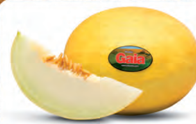
Melão Amarelo Gaia Kg