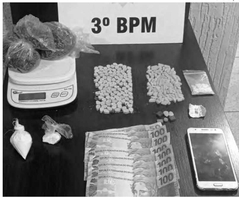
O rapaz estaria comercializando vários tipos de drogas

Os policiais da Rotam deram voz de prisão para a moradora