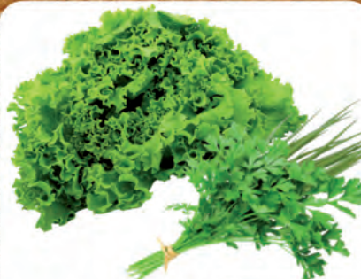
Alface Crespa e Tempero Verde Do Preto Unidade