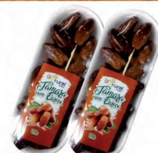
Tâmara c/ Caroço Rural Brasil 200g