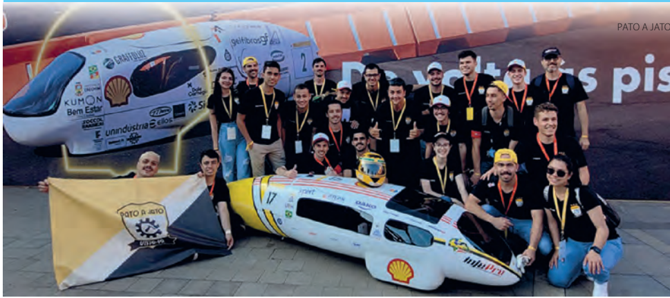
Pato a Jato é tetracampeã brasileira de competição de eficiência energética