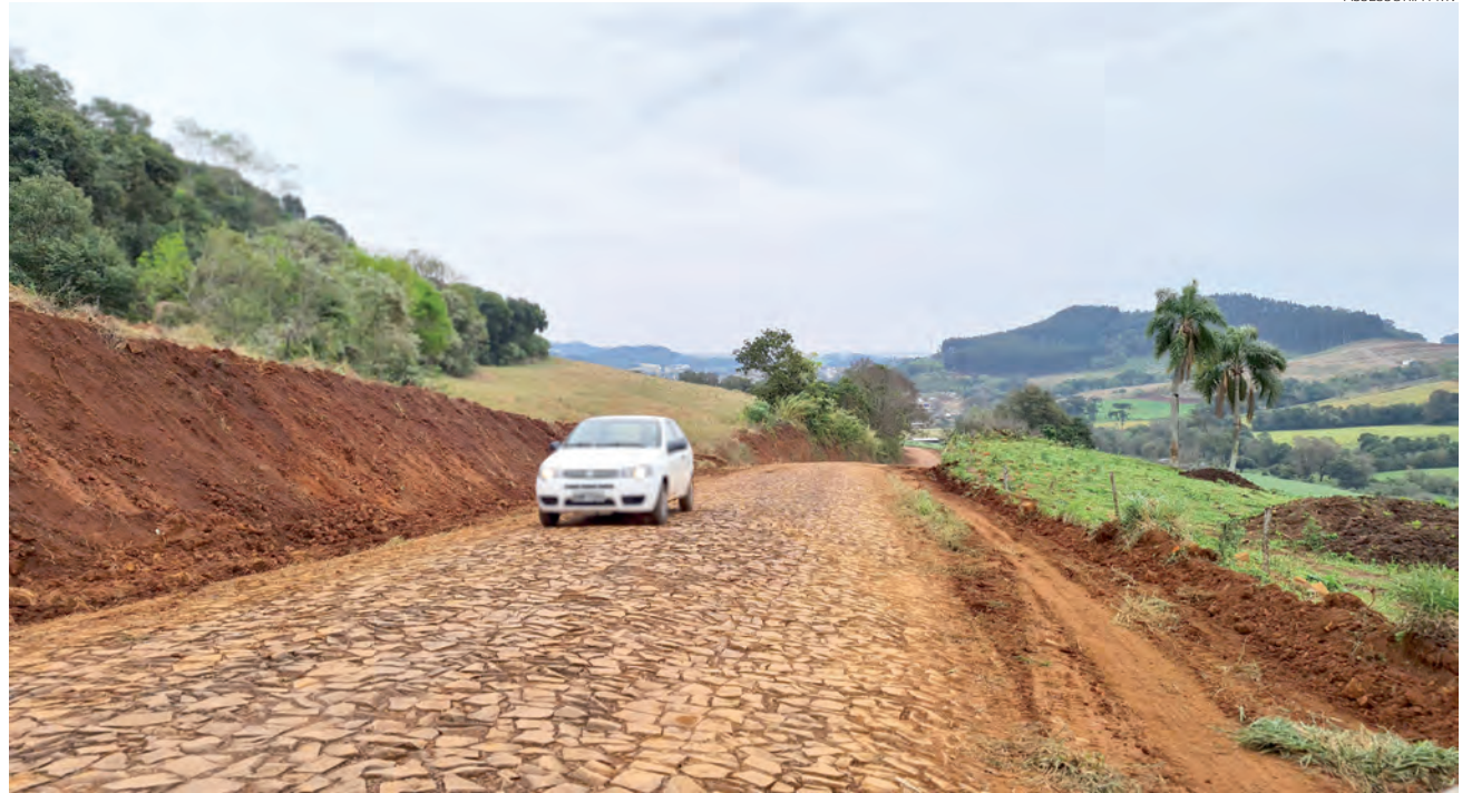
Trecho a ser pavimentado é de pouco mais de 5,4 mil metros