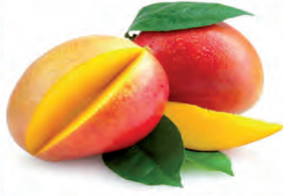
Manga Tommy Kg