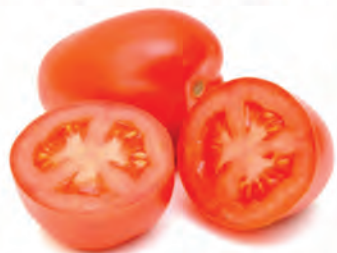
Tomate Saladete Kg

NÃO VENDEMOS POR ATACADO. MÁXIMO DE 12 UNIDADES DO PRODUTO ANUNCIADO. IMAGENS MERAMENTE ILUSTRATIVAS.