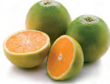
Laranja Pera Kg