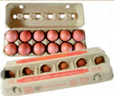
Ovos Vermelho Mantiqueira Dúzia