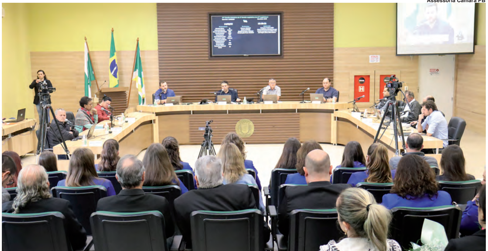
Assessoria Câmara PB

Tricampeão estadual, Pato Basquete inicia defesa do título no sábado PÁG. 11