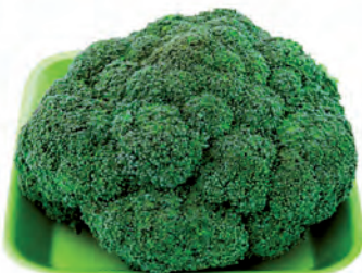
Brócolis da Ilha Bandeja