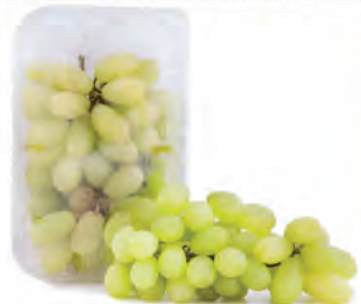
Uva Thompson Bandeja 500g