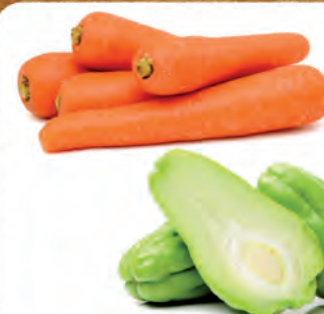
Cenoura Kg Chuchu Kg