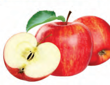
Maçã Gala Importada Kg