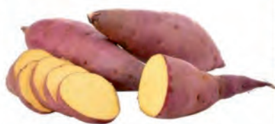
Batata Doce Roxa Kg