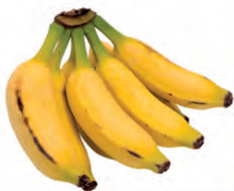
Banana Prata Kg