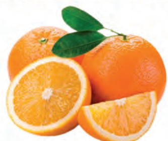
Laranja Bahia Importada Kg