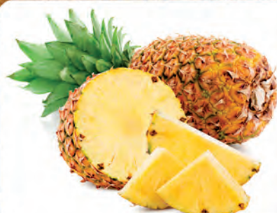
Abacaxi Hawaí Unidade