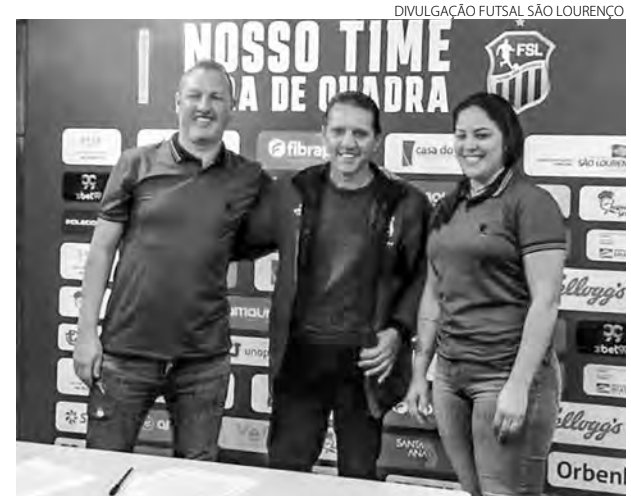
Confirmação da presença do São Lourenço na LNF 2023 foi na segunda-feira

"É uma emoção muito grande poder decidir mais uma vez a Copa do Brasil em meu estado, agora com a camisa do Pato Futsal. Queremos muito esse inédito título para a cidade de Pato Branco", afirma o camisa 7.