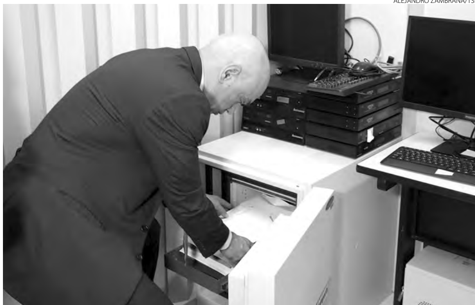
Alexandre de Moraes falou na cerimônia de lacração das urnas

Feita a verificação, a entidade fiscalizadora pode assinar digitalmente a versão final dos softwares. A partir de então, caso haja alguma modificação intencional ou erro durante a cópia, a assinatura se torna inválida. “Isso garante a autenticidade do programa, confirman-