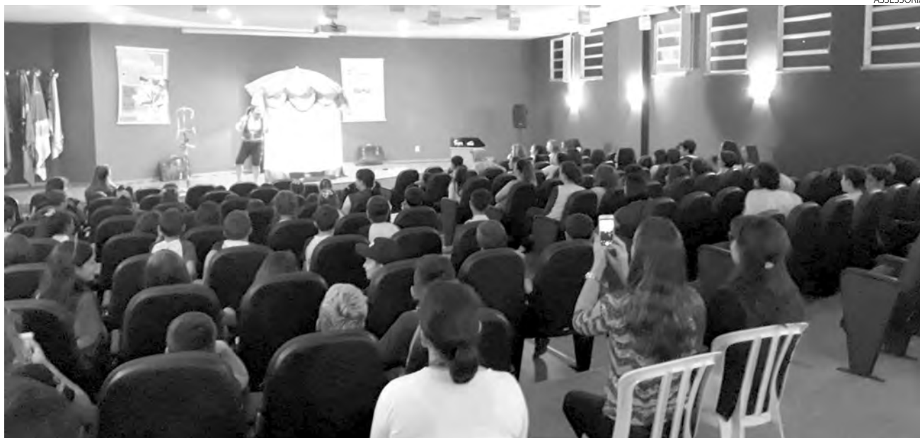
Último evento presencial reuniu mais de 2.500 pessoas

Aline Vezoli com assessoria redacao@diariodosudoeste.com.br