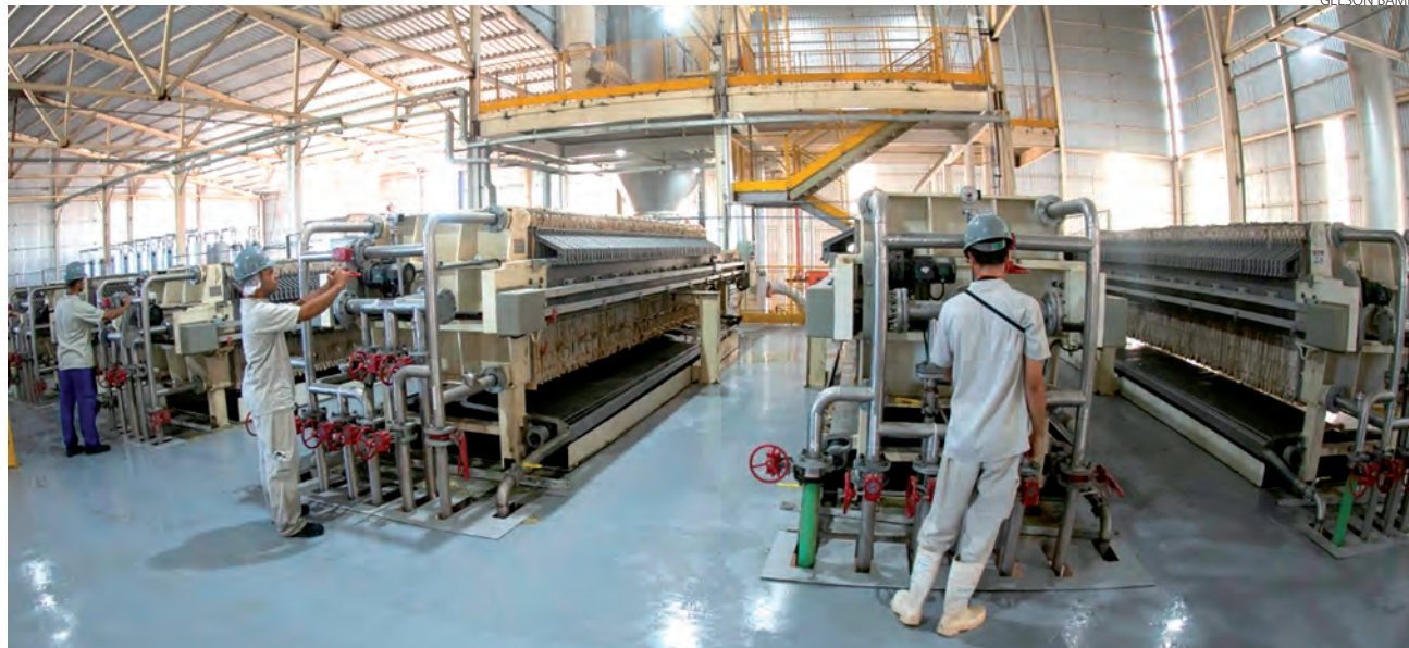
Última pesquisa antes das eleições majoritárias de 2 de outubro mostra otimismo na indústria