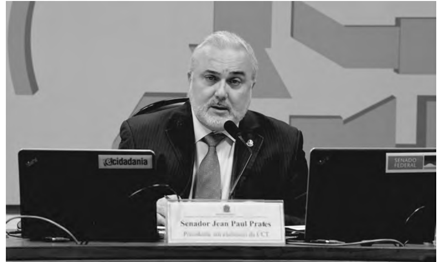
A PEC 22/2022 é assinada pelo senador Jean Paul Prates (PT-RN)

A proposta do senador Jean Paul prevê que a Lei Orçamentária da União para 2023 contere rubrica específica de apoio a estados, municípios e Distrito Federal e aos hospitais fi-