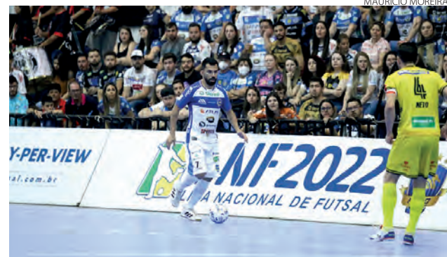
O Pato Futsal enfrenta o Praia Clube pelas oitavas de final da LNF

Com a vitória no jogo de ida, em Pato Branco, por 1 a 0, o Pato Futsal tem a vantagem do empate no tempo normal para ficar com a vaga na próxima fase. Já o Praia Clube precisa vencer no tempo normal para levar a disputa à prorrogação. Caso o jogo se encami-