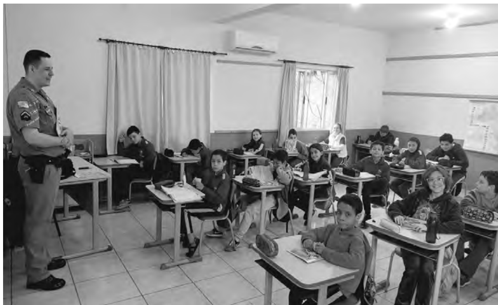
Cem alunos das duas escolas contempladas farão parte do Proerd 2022