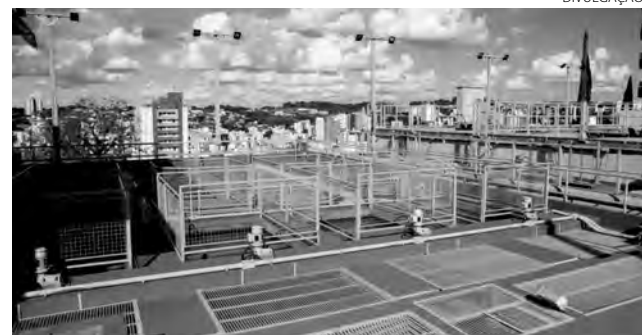
A estatal construiu 14 novas estações de tratamento de esgoto no estado