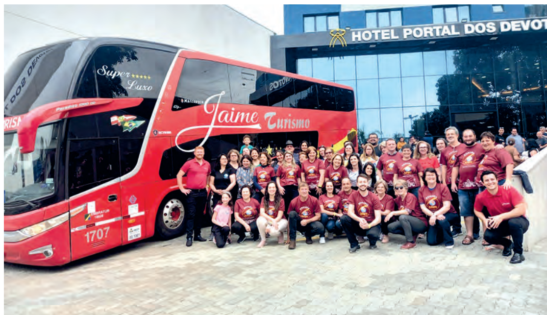
O Movimento de Cursilhos de Cristandade da Diocese de Palmas-Francisco Beltrão participou da 2ª Romaria Nacional em Aparecida do Norte/SP. Foi um momento de descontração, paz, alegria e muita emoção junto de nossa Mãe Aparecida. Poder rever amigos do país todo, amigos que tem o mesmo sentido de viver em Cristo é muito gratificante. Venha você também fazer parte deste Movimento. Mais informações? Siga o Cursilho nas redes sociais: Facebook: Cursilho Pato Branco; Instagram: @cursilhopatobranco