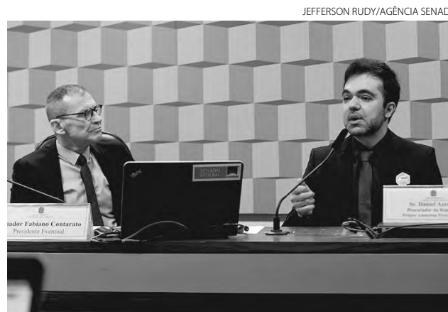
A audiência sobre regularização fundiária ocorreu na quarta-feira (21)