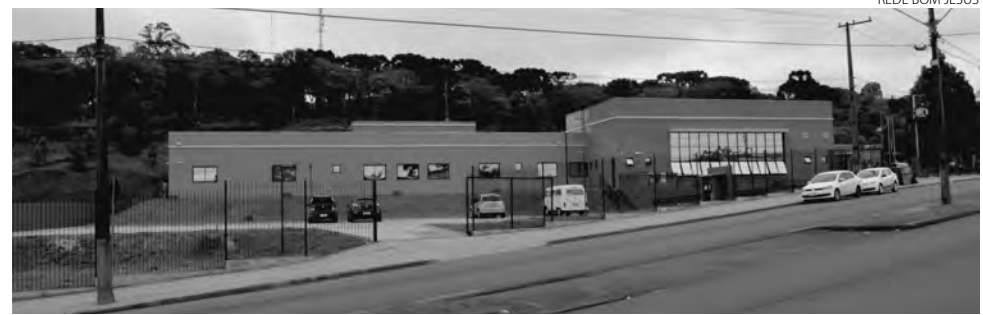
REDE BOM JESUS

Este ano, seguindo recomendação do MP, o Executivo de Palmas, encaminhou ao Legislativo projeto de lei para alterar o regimento