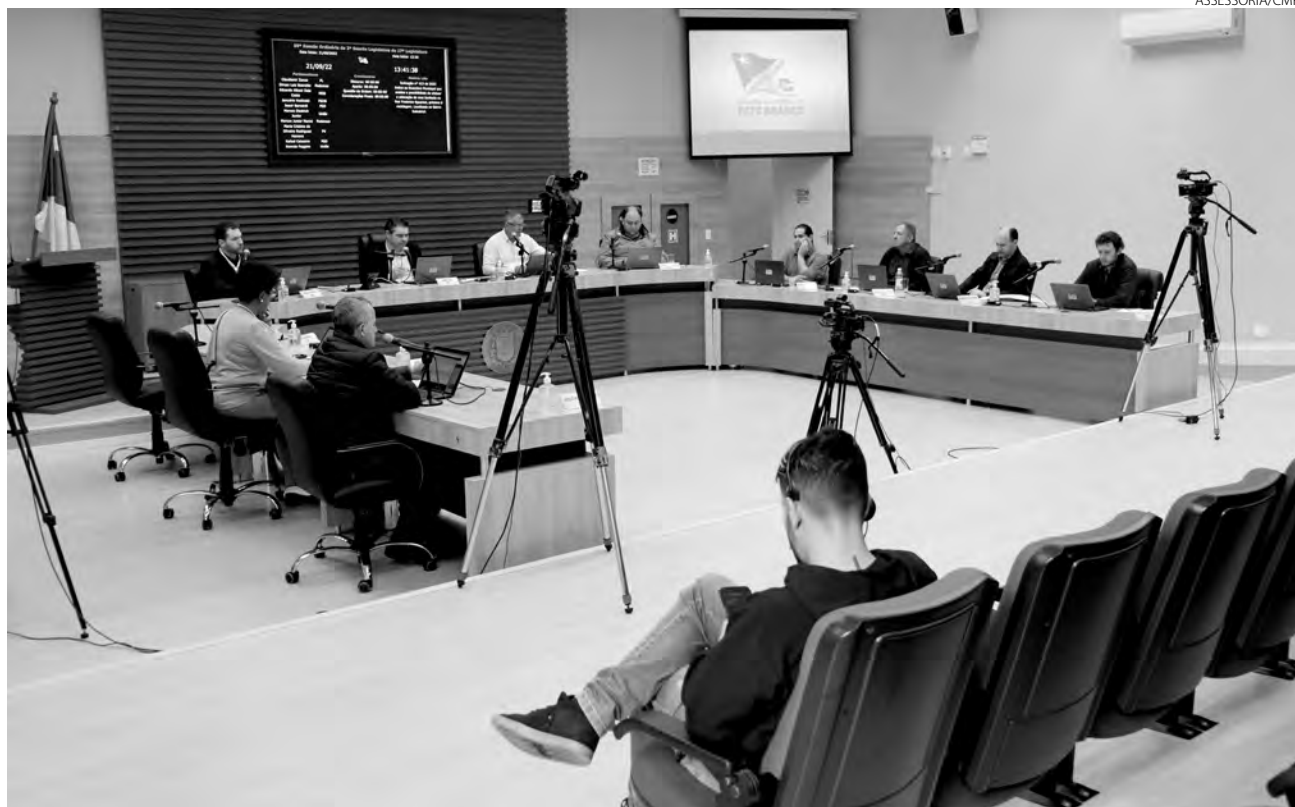
Os projetos foram aprovados em segunda votação na sessão de quarta-feira (21), da Câmara Municipal de Pato Branco

“O recurso será destinado à suplementação da Ação nº 2.180 - Manutenção das Atividades de Datas Comemorativas, por meio da anulação parcial de dotações do Departamento de Cultura e excesso de arrecadação, e será utilizado na realização do evento Natal 2022, proporcionando momentos prazerosos de interação entre a comunidade, atraindo turistas e fomentando o comércio local. A comemoração do Natal já é tradição em nosso município, sendo considerada um dos eventos mais importantes do calendário municipal de fes-