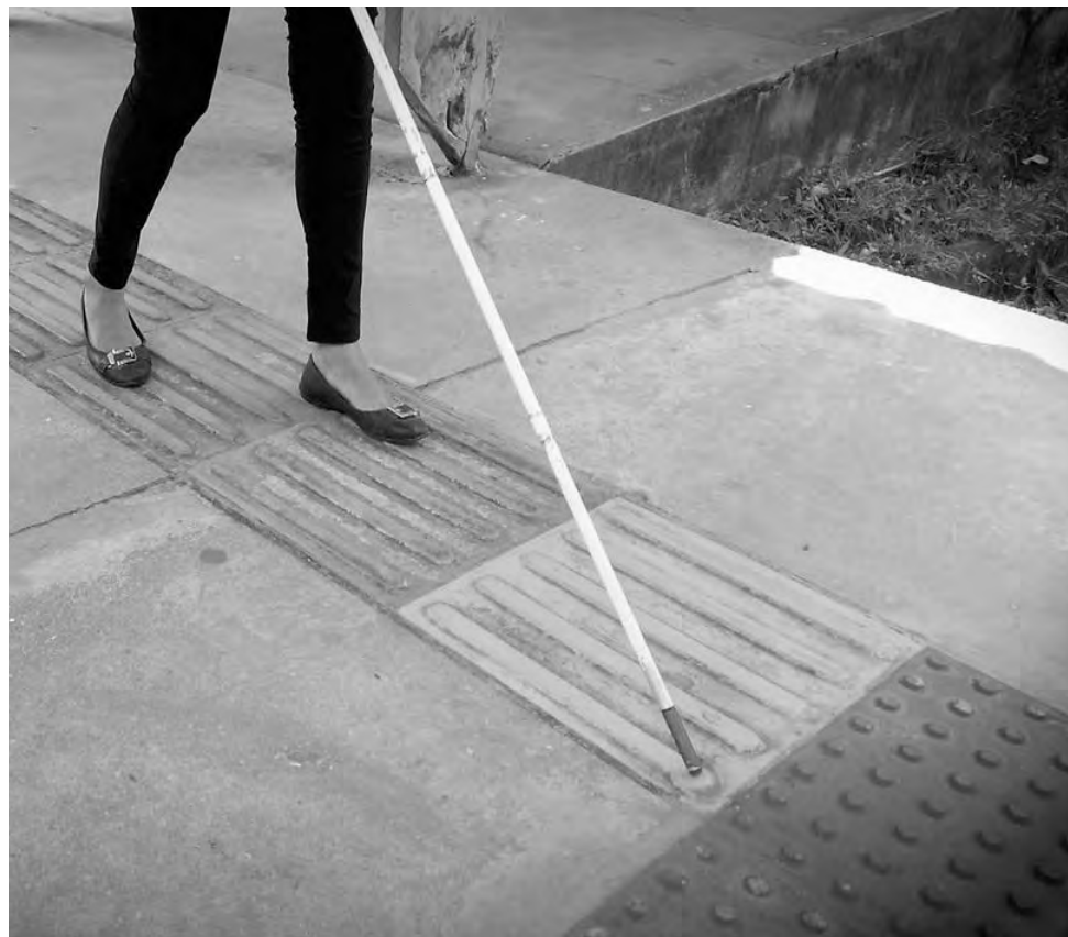
Dados são da pesquisa Pessoas com deficiência e desigualdades, de 2019

No Brasil, 55% das escolas dos anos iniciais do ensino fundamental estavam adaptadas para alunos com deficiência. Nas esco-