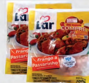
Frango a Passarinho Lar 700g