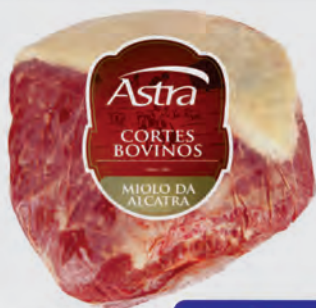
Miolo da Alcatra Bovina Astra Kg