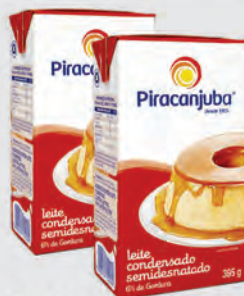
Leite Condensado Semidesnatado Piracanjuba 395g