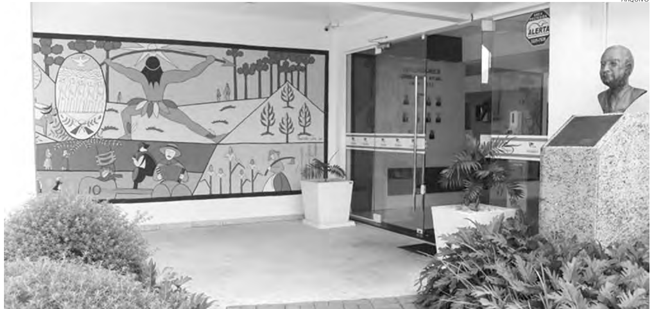
A Câmara Municipal de Pato Branco aprovou o projeto, em segunda votação, na sessão de quarta-feira (24)