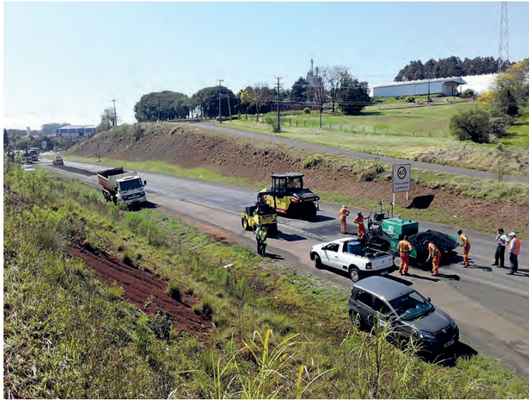
Segundo o Dnit, ponte apresentou defeito

O Diário também questionou se há algum estudo sobre a vida útil da ponte em questão, ou se ela precisa de alguma intervenção maior. A resposta obtida pela reportagem é de que “Existem programas de monitoramento e manutenção periódicos das Obras de Arte Especiais (OAEs), — pontes, trincheiras e viadutos — e a ponte em questão faz parte de contrato dentro do Programa de Manutenção e Reabilitação de Estruturas (Proarte)”, ainda foi revelado que “não foi identifica-