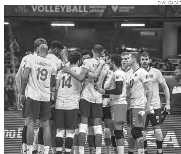
De cara nova, seleção vai em busca do tetracampeonato