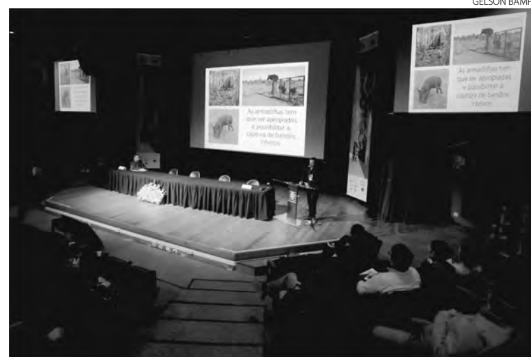
População descontrolada de javalis tem impactos ambientais, socioeconômicos e sanitários à sociedade

Uma dica importante sobre o destino dos javalis e javaporcos é a não recomendação do consumo da carne desses animais. “Como não há inspeção sanitária, o consumo representa um risco à saúde