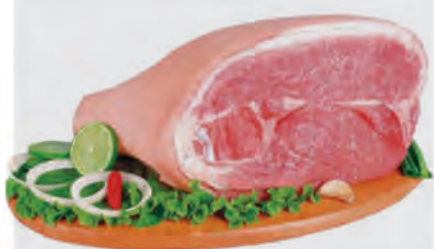
Pernil Suíno c/ Pele Kg