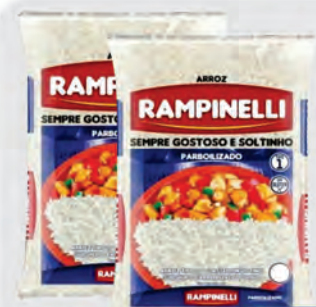
Arroz Parboilizado Rampinelli 5Kg