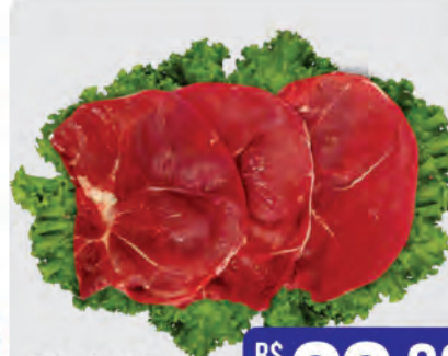
Bife Patinho Bovino Kg