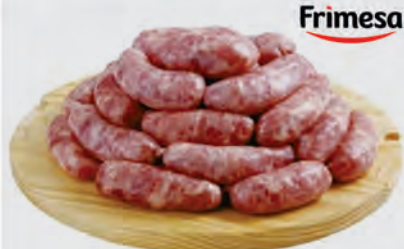
Linguíça Toscana Frimesa Kg