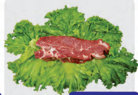
Filé Agulha Bovino Kg