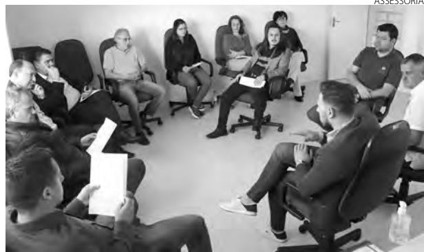
A reunião ocorreu na tarde de quarta-feira (24), na Casa de Leis

O Projeto de Lei do Plano Especial de Urbanização será votado na próxima segunda-feira (29), durante a sessão ordinária. "Estes empresários nos trouxeram algumas sugestões para integrar o PEU e estão levando como informação de que este é o primeiro passo, já que está sendo realizada a revisão e a atualização do Plano Diretor Municipal, e é neste instrumento de planejamento da cidade que eles realmente poderão contribuir com essas observações, para serem discutidas entre os arquitetos e os engenheiros responsáveis", reiterou o presidente do Legislativo.