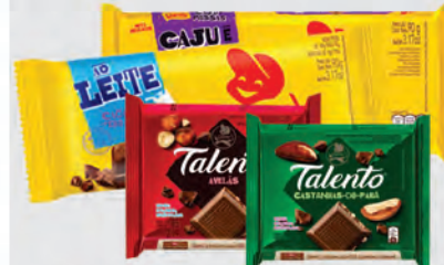
Chocolate Barra Garoto 90g e Chocolate Talento 85g