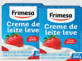
Crema de Leite Leve Frimesa 17% Gordura 200g