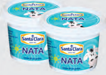
Nata Santa Clara 300g