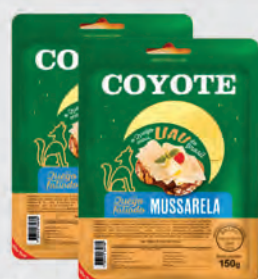
Queijo Mussarela Coyote Fatiado 150g