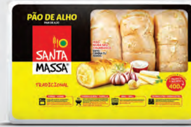
Pão de Alho Santa Massa Tradicional 400g