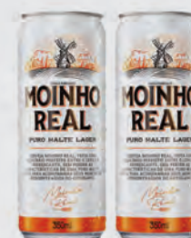
Cerveja Moinho Real Puro Malte lata 350ml