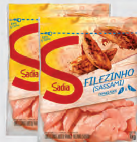
Filezinho Peito Frango Sassami Sadia 1Kg