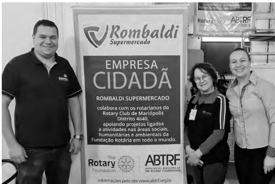
Entrega do Banner Característico da Empresa Cidadã

É um programa de doações que atesta a responsabilidade social de uma empresa ao torná-la parceira do Rotary em sua obra.