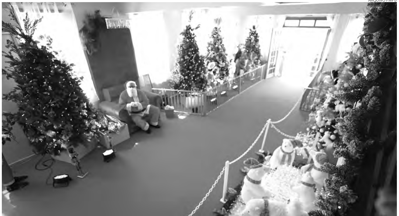
Coordenação do Natal de Pato Branco promete reutilizar decorações de edições anteriores

O prefeito de Pato Branco aproveitou a reunião desta terça-feira (16) para afirmar que o município disponibilizará 4 mil ceias de natal completas para a população carente do municí-