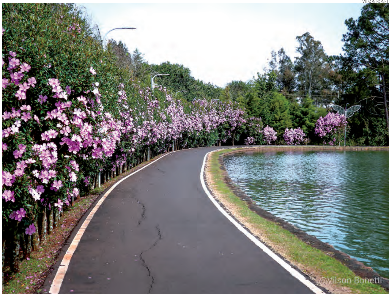
Registro florido do Parque Ambiental Vitória Piassa – Parque do Alvorecer, em Pato Branco, na manhã de terça-feira (16)