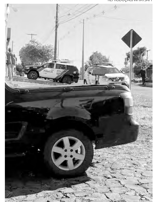
Crime aconteceu na última quinta-feira (11)