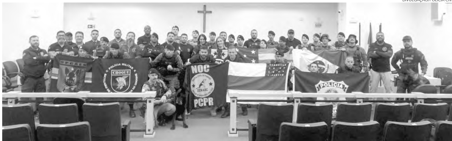
Aula inaugural do curso aconteceu nesta terça-feira