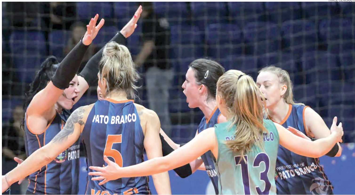
Título da Série B, foi definido no set de desempate