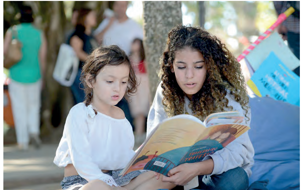
Campanha Leia com uma Criança quer fortalecer vínculos afetivos