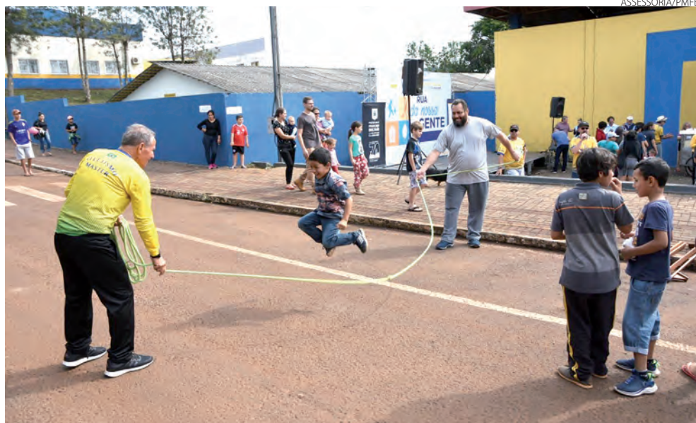
Francisco Beltrão realizou no sábado (13), no bairro Padre Ulrico, a primeira edição do projeto de lazer "Rua da Nossa Gente". O evento reuniu centenas de crianças e familiares. A próxima edição será em outubro, no bairro São Miguel.