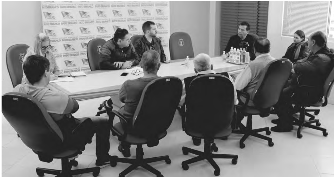
Encontro aconteceu na Câmara Municipal de Pato Branco

Redação com Assessoria da Câmara Municipal de Pato Branco