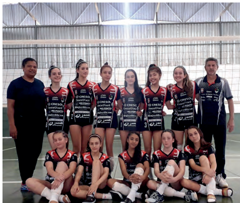
A equipe de vôlei da Acel, de Chopinzinho, campeã dos jogos escolares do Paraná, na categoria B