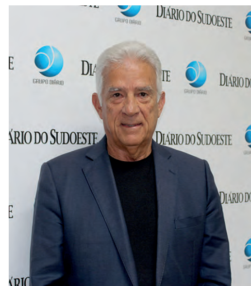
Pré-candidato pelo Cidadania a Deputado Federal, Rubens Bueno cumpriu agenda em Pato Branco nessa quinta-feira (4)