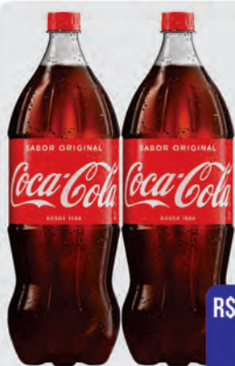
Refrigerante Coca-cola 2L Tradicional