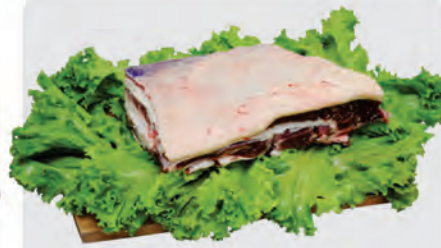
Costela Minga Bovina Kg