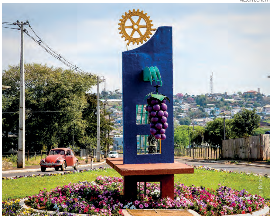
Registro de um dos cartões postais do município de Mariópolis, terra da Festa da Uva, com seus tradicionais parreirais e a comercialização de vinho e uva in natura.