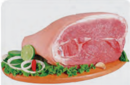
Pernil Suíno c/ Pele Kg