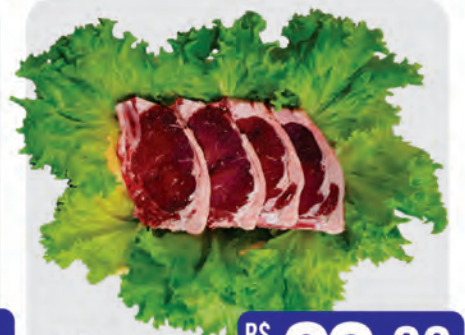
Filé Simples Bovino Kg