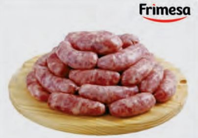
Linguiça Toscana Frimesa Kg