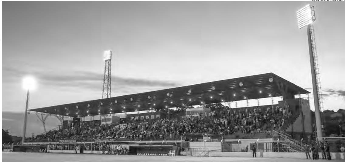
O cerimonial de abertura começa às 19h30 no Estádio Os Pioneiros