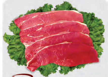
Astra Bife Coxão Mole Astra Bovino Kg