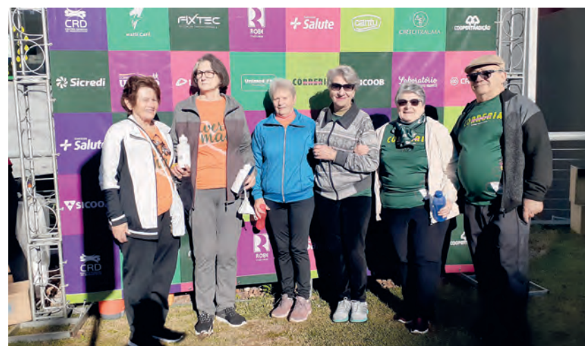
Unidos pela saúde os amigos se reuniram no último domingo (31), para a caminhada pelo centro de Pato Branco, animação não faltou