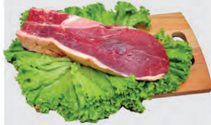
Alcatra c/ Osso Bovina Kg