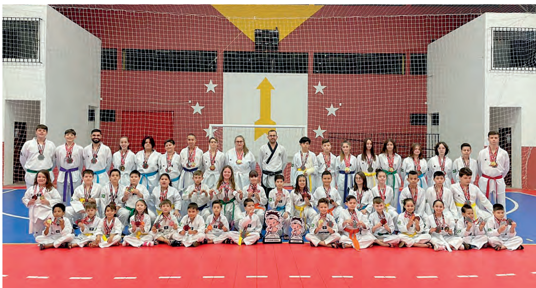
Atletas da equipe Sales Taekwondo, de Vitorino, que conquistaram 33 medalhas de ouro, 36 de prata e 35 de bronze na Copa Paraná. A equipe ficou com o segundo lugar geral