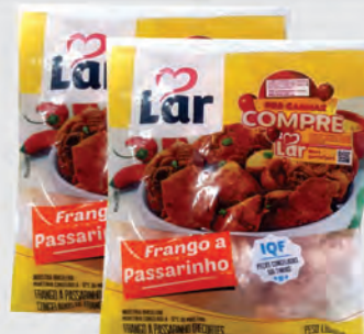
Frango a Passarinho Lar 700g