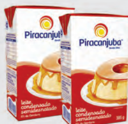
Leite Condensado Semidesnatado Piracanjuba 395g