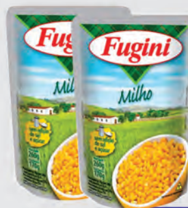
Milho Verde Fugini Sachê 170g