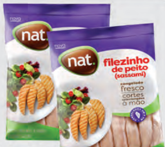
Filezinho Peito Frango Sassami Nat 1Kg