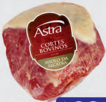
Miolo da Alcatra Bovina Astra Kg