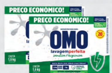
Sanitizante Pó Omo Lavagem Perfeita 1,6Kg