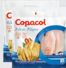
Filé de Tilápia Copacol 800g