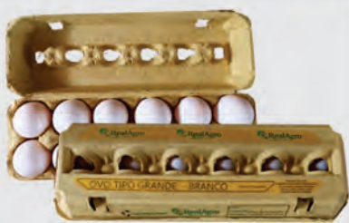
Ovos Branco Grande Real Agro Dúzia