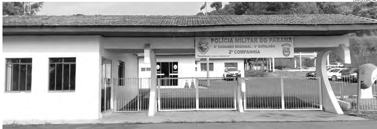
A estrutura que irá abrigar a 12ª Companhia Independente