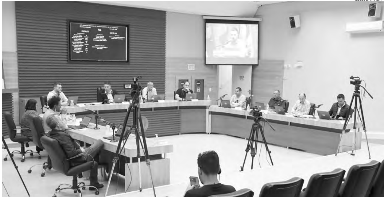
O Projeto de Lei nº 65, de 2022, foi aprovado na sessão de quarta-feira (4)