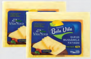
Queijo Mussarela Bela Vila Fatiado 150g