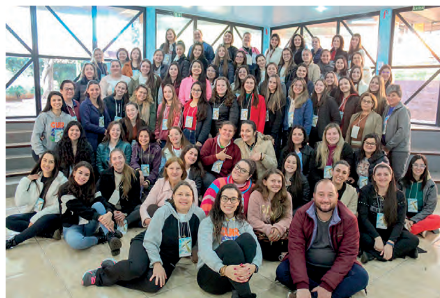
Nos últimos dois fins de semana, a Diocese de Palmas/Francisco Beltrão realizou o 31º Cursilho Jovem masculino e feminino. O encontro da retomada reuniu mais de 70 jovens. Com a chegada dos novos Cursilhistas, os grupos se renovam e se enchem de energia. Siga o movimento nas redes sociais: Facebook.com/cursilhopatobranco e Instagram.com/cursilhopatobranco