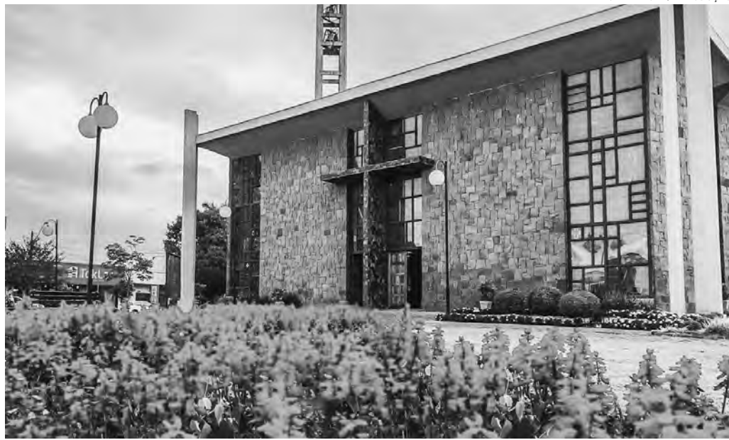
Turismo religioso é uma das vertentes que passam a ser exploradas no município