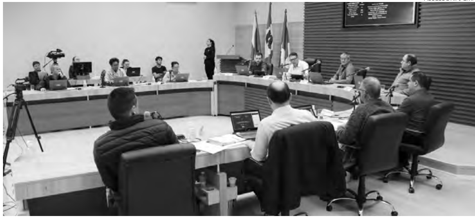
Após recesso legislativo, a Câmara de Pato Branco retomou as sessões na tarde dessa segunda (1º)

Segundo o projeto, o Município pretende “instalar o sistema de britagem de rochas em imóvel recentemente adquirido para a instalação da Usina de Asfalto, objetivando reduzir os