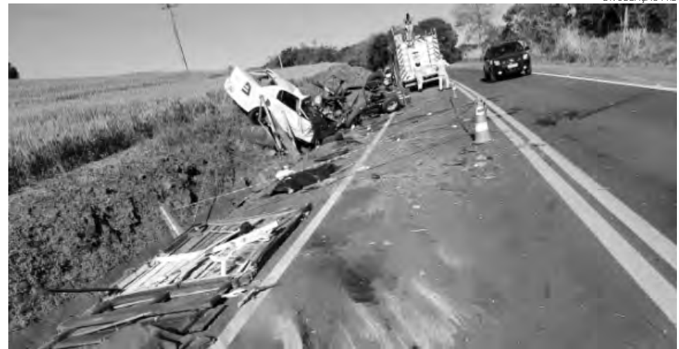
O Astra colidiu frontalmente contra a carreta agrícola

Outra colisão frontal ocorreu domingo, por volta das 19h, na PR-483, em Francisco Beltrão. O acidente envolveu um Gol, placas