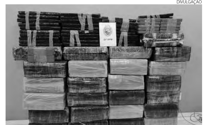
A droga estava sendo transportada em uma Saveiro, que foi abandonada pelo condutor

Trata-se de um adolescente, de 17 anos, que foi