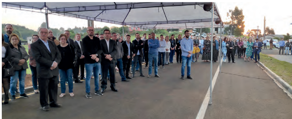
Solenidade foi acompanhada por representantes da comunidade regional