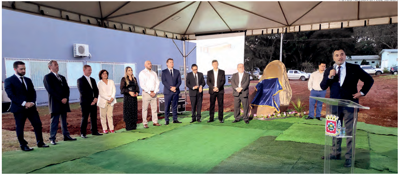
Autoridades no lançamento da pedra fundamental

Já os recursos e trâmites de execução da obra, como licitação, contratação de empresa, pagamentos e fiscalização são responsabilidades do TJPR. De acordo com informações apuradas no lançamento, a previsão é de que a obra comece ainda