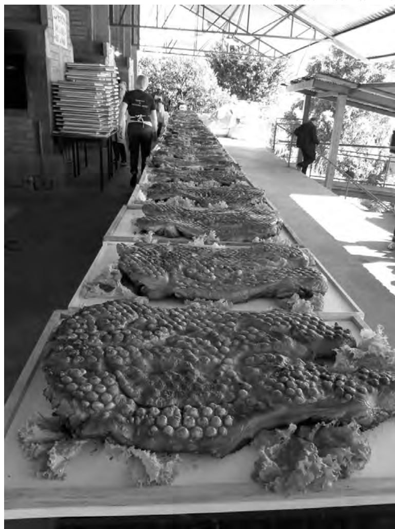
13º Almoço Leitão Light

Há 14 anos, o Evento do Leitão Light promovido pelo Rotary Club de Pato Branco-Amizade ajuda a comunidade local, e também internacional, a implementar projetos de grande alcance humanitário.