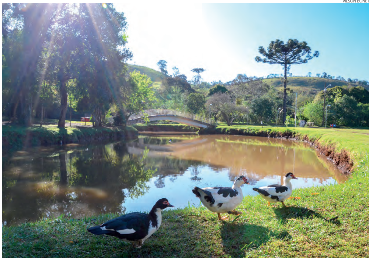
Registro de uma cena campestre na manhã de segunda-feira (1º), no Parque Cecília Cardoso, localizado no bairro Bonatto, em Pato Branco.