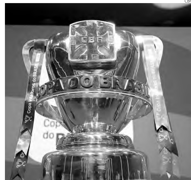
Jogos de ida serão na próxima quarta (24) no Maracanã e Morumbi

Os clubes que avançarem à final receberão R$ 25 milhões de premiação da CBF. Já quem se sagrar campeão do torneio receberá R$ 60 milhões.