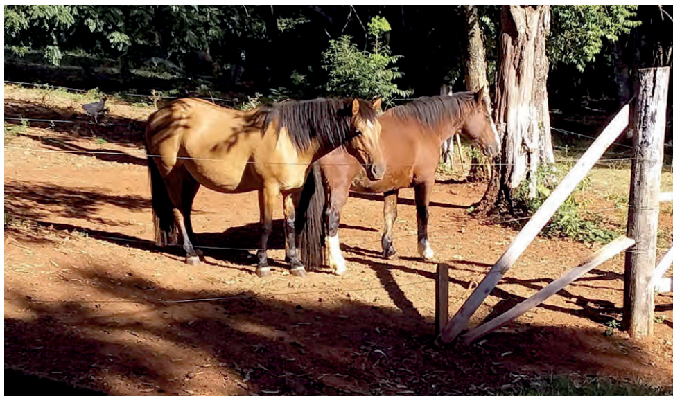
Cavalos são chamados de Chico e Butiá