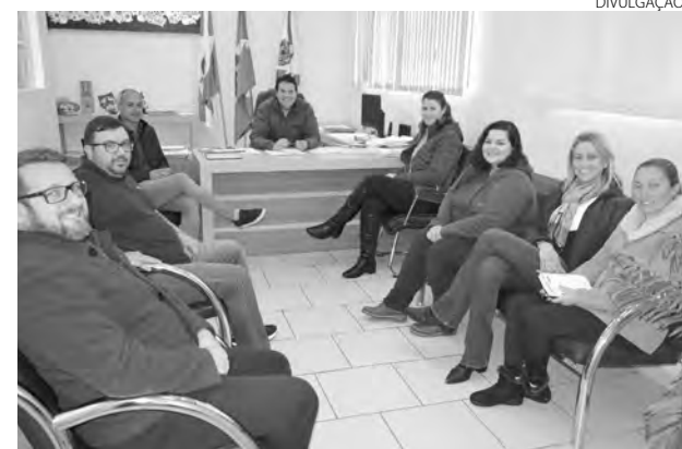
Reajuste dos professores foi anunciado ainda no início do ano