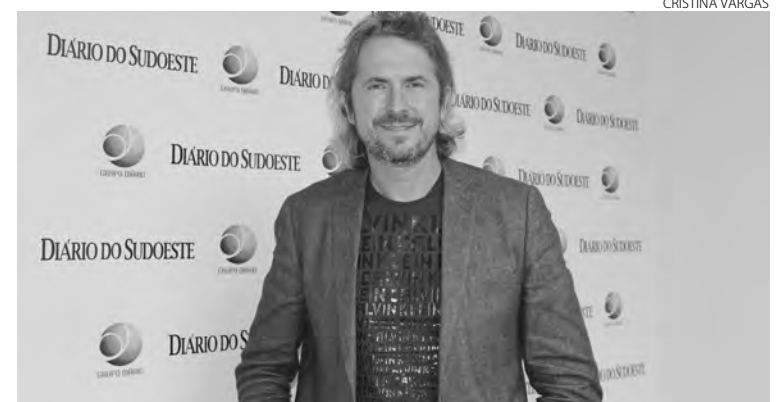
Zeca Dirceu, candidato a reeleição como deputado federal pelo PT

"Quero continuar sendo deputado federal para defender es-