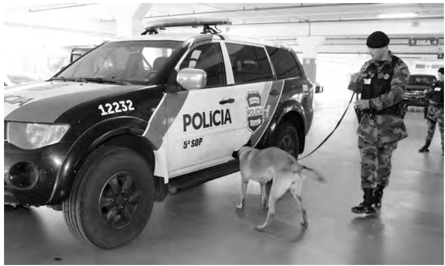
Foram simuladas situações de busca em veículos

A turma também deverá participar de ações práticas na região, em operações reais. O treinamento serve também para aperfeiçoar os cães. Cinco dos animais que estão sendo usados nas práticas serão doados para as polícias de alguns estados. “Agora é uma prova para verificar se eles tem condições de seguir trabalhando. O treinamento com o cão é constante, a gente vai observando, vai pontuando, muitas vezes você tem que voltar um pouquinho no treinamento para corrigir algumas falhas para ser bem assertivo”, continua o major.