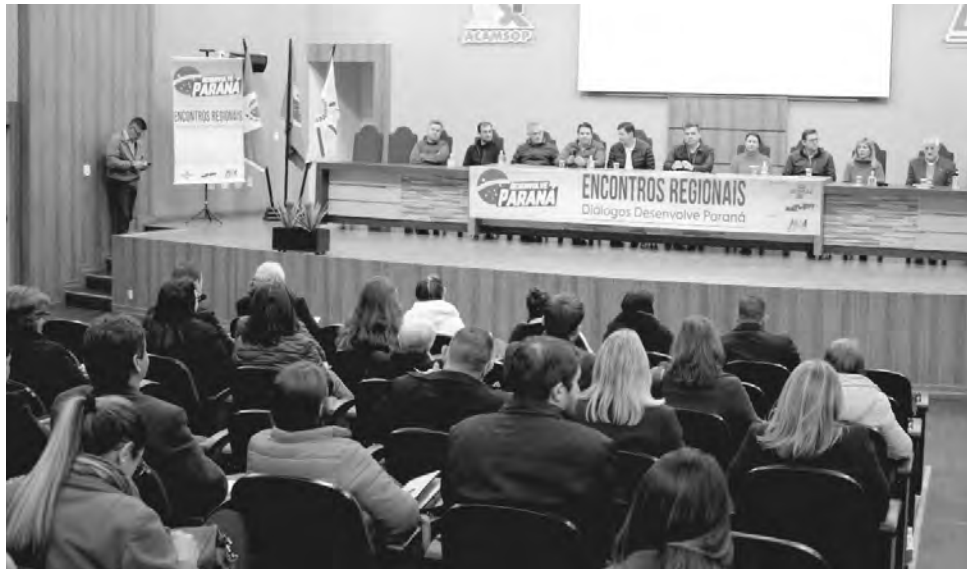
O encontro regional foi realizado na sexta-feira (19), na sede da Amsop, em Francisco Beltrão

“O sudoeste e o oeste do Paraná, especificamente,