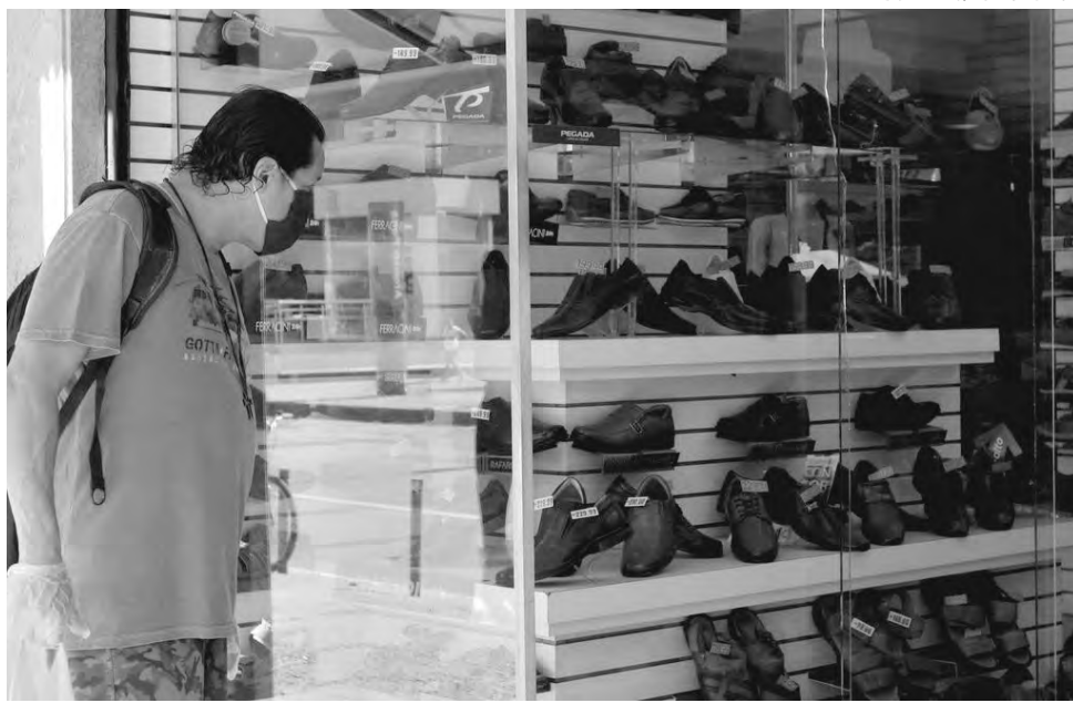
Setor de calçados esteve entre os mais atingidos pela queda

De acordo com ele, o setor de tecidos, vestuário