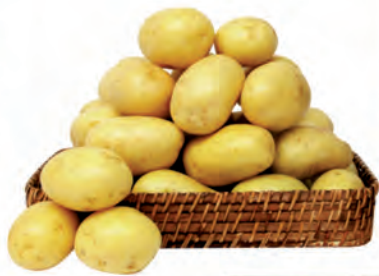
Batata Monalisa Kg