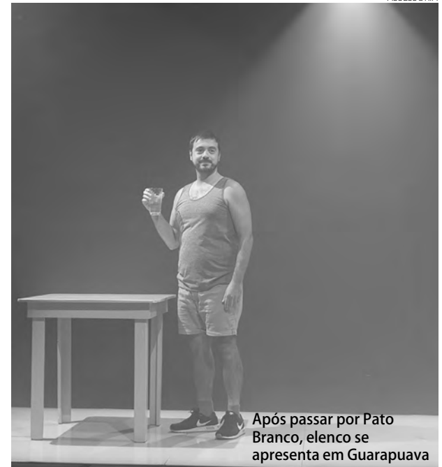
Após passar por Pato Branco, elenco se apresenta em Guarapuava

Mais informações pelo WhatsApp (46) 3220-5524 | 46 9 8801 2273