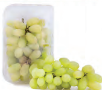
Uva Thompson Bandeja 500g