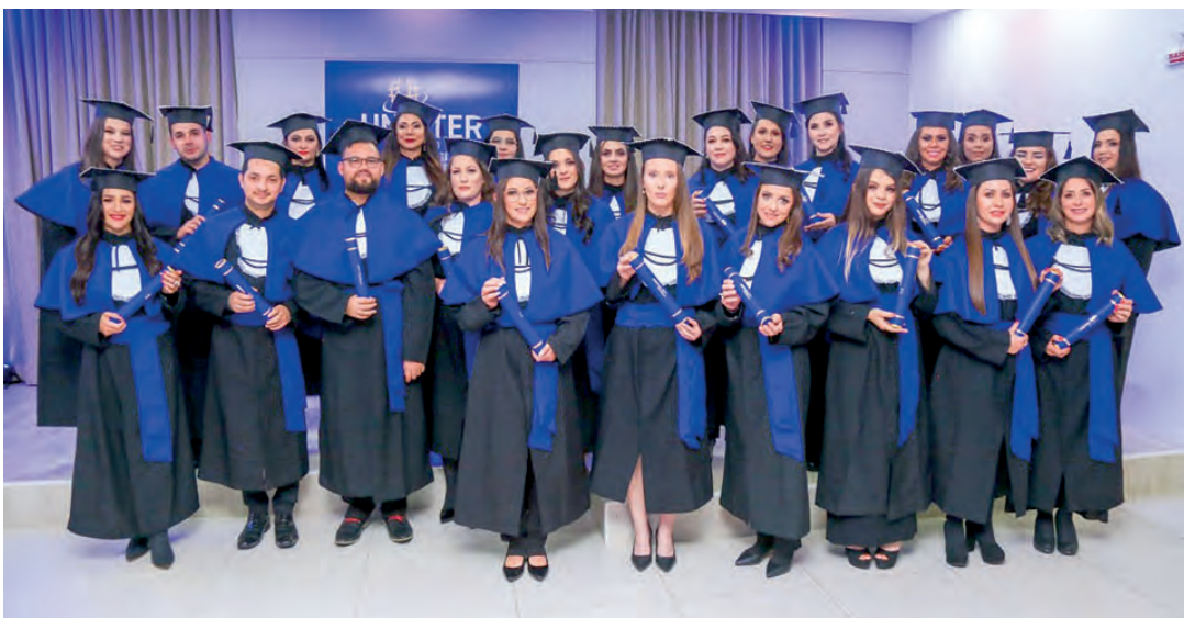
Mais uma turma de alunos Uninter que recebeu o seu diploma na formatura que aconteceu no dia 30 de julho, no auditório do Polo Uninter Pato Branco. A equipe do Polo parabeniza os formados e deseja a todos muito sucesso