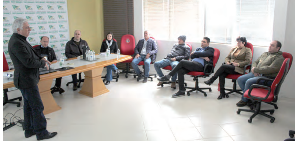
NELSON DA LUZ JUNIOR/DIÁRIO DO SUDOESTE