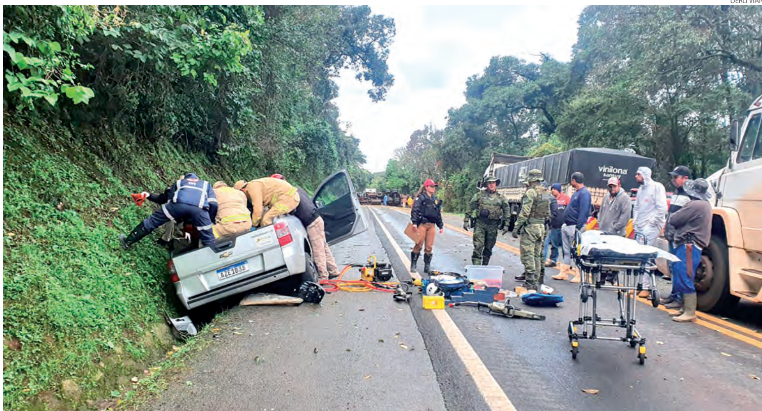
Equipes de segurança e salvamento durante o resgate do condutor da caminhonete que se envolveu em acidente na PR-182, entre Ampère e Francisco Beltrão