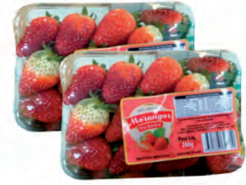
Morango Tio André Bandeja 200g