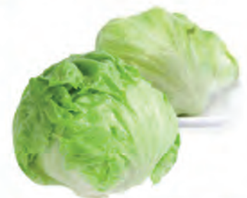
Alface Americana Verdura &amp; Vida c/ 1