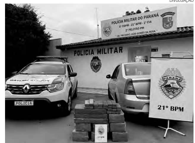
A maconha estava sendo transportada para Lages (SC)

O homem foi preso em flagrante por tráfico de drogas. Ele foi entregue, juntamente com a maconha e o veículo, na Delegacia da Polícia Civil de Francisco Beltrão. (Redação)