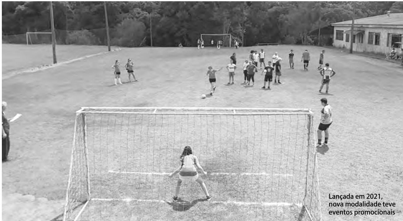
Lançada em 2021, nova modalidade teve eventos promocionais

Nelson da Luz Junior nelson@diariodosudoeste.com.br