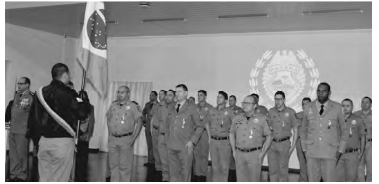
A solenidade foi marcada pela entrega de medalhas aos policiais por tempo de serviço e para os que se destacaram no serviço operacional

O tenente-coronel Heraldo também comentou sobre a redução de áreas de atuação dos batalhões para prestar um melhor atendimento a comunidade. Ele disse que foi criada a 12ª Companhia Independente de Palmas, que vai dividir a área do 3º BPM, mas isso vem a incrementar