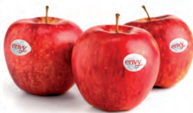
Maçã Envy Kg