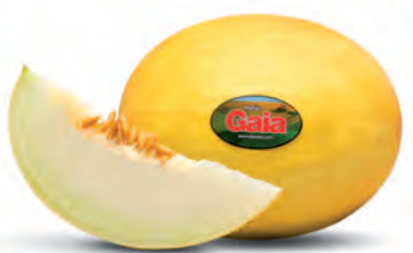
Melão Amarelo Gaia Kg