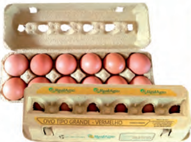
Ovos Vermelhos Grandes RealAgro Dúzia