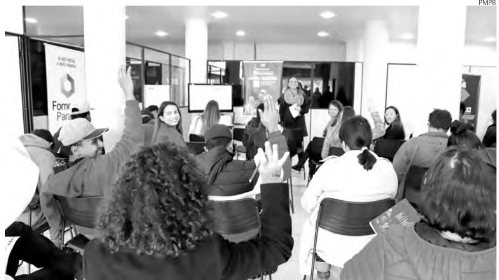
Ações estão sendo realizadas desde o último sábado (6)

“O debate busca estimular a troca de experiências e a reflexão entre os participantes sobre seus próprios objetivos, habilidades e decisões”, conclui a psicóloga.