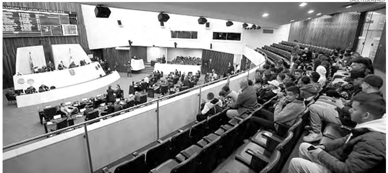
Proposta que cria Selo Empresa Amiga da Mulher é aprovada pela Alep em primeira votação