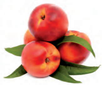
Nectarina Importada Kg