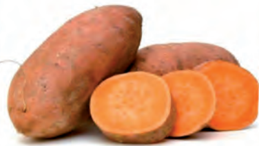
Batata Doce Amarela Kg