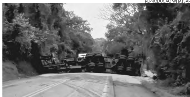
O caminhão, que estava carregado de milho, ficou atravessado na pista

O caminhão tombado bloqueou a rodovia por várias horas, nos dois sentidos. A Polícia Rodoviária Estadual (PRE) se deslocou ao local para regular o trânsito. De acordo com capitão