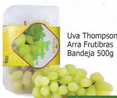
Uva Thompson Arra Frutibras Bandeja 500g