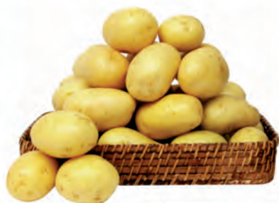
Batata Monalisa Kg