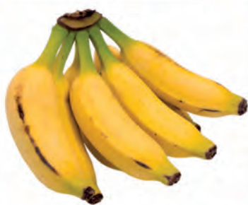
Banana Prata Kg