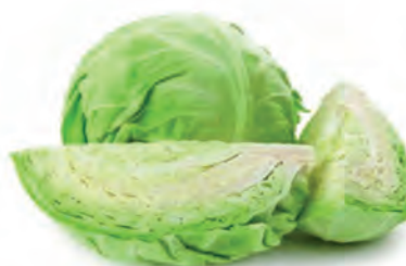
Repolho Verde Kg