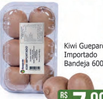
Kiwi Guepardo Importado Bandeja 600g