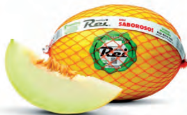
Melão Rei Kg