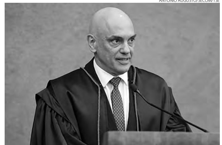
O novo presidente do TSE conduzirá a Corte Eleitoral até junho de 2024

conduzirá a Corte Eleitoral até junho de 2024. A ele caberá presidir as Eleições Gerais de 2022 e iniciar os trabalhos de preparação do próximo plei-