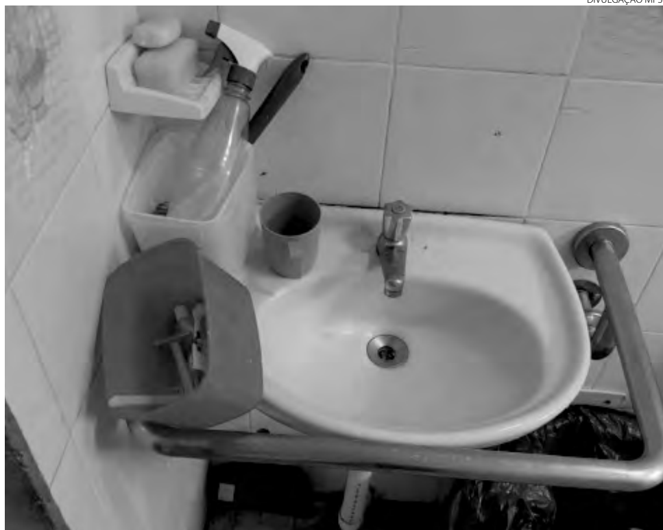
A situação do Lar de Idosos de São Lourenço do Oeste vem se agravando desde 2017

Na ação, o MPSC explica que a atual situação da entidade é grave. Além da insuficiência de funcioná-