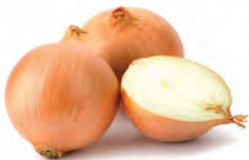
Cebola Nacional Kg