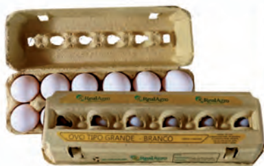
Ovos Branco Grande Real Agro Dúzia