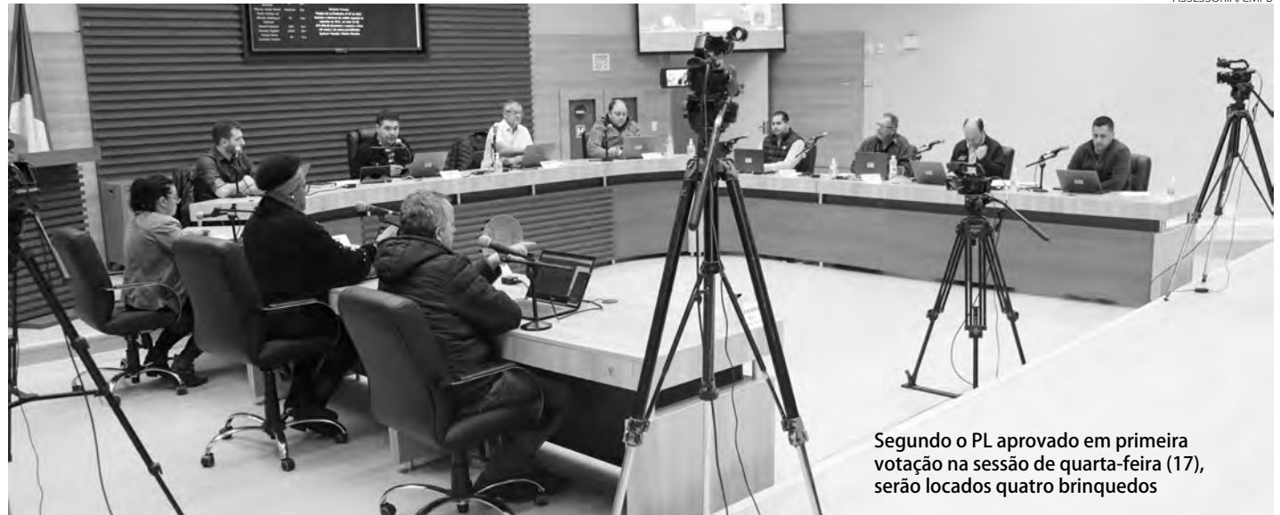
Segundo o PL aprovado em primeira votação na sessão de quarta-feira (17), serão locados quatro brinquedos