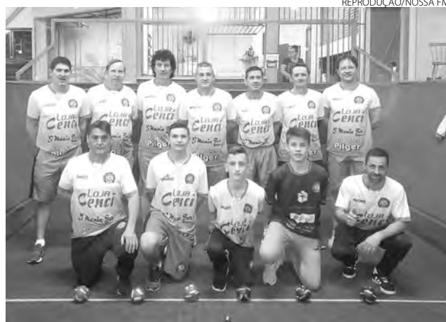
Equipe segue viva em busca do título paranaense

Com a pontuação, Chopinzinho e Cascavel seguem para as próximas etapas, que definirão o campeão paranaense da modalidade. Itaipulândia segue na divisão de elite, e Marmeleiro foi rebaixada para a segunda divisão. Por enquanto, o resultado já garante a colocação da equipe do sudoeste entre as oito melhores do estado. As informações são da Rádio Nossa FM.