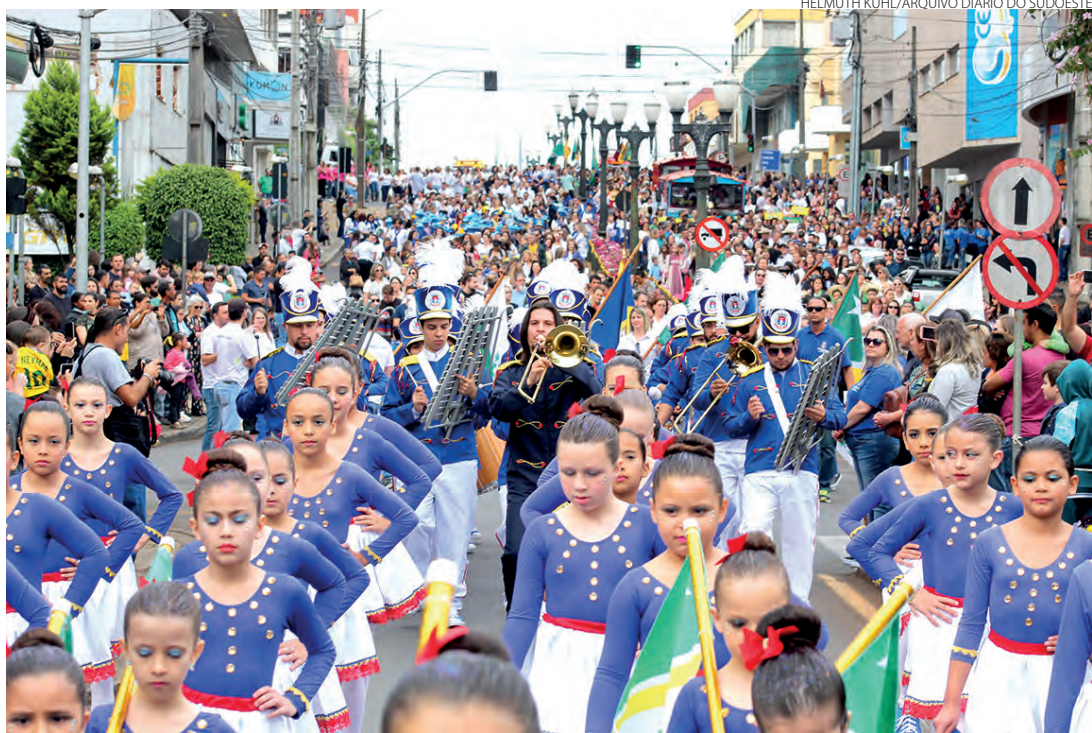
No último desfile antes da pandemia, em 2019, a Banda do Município esteve presente