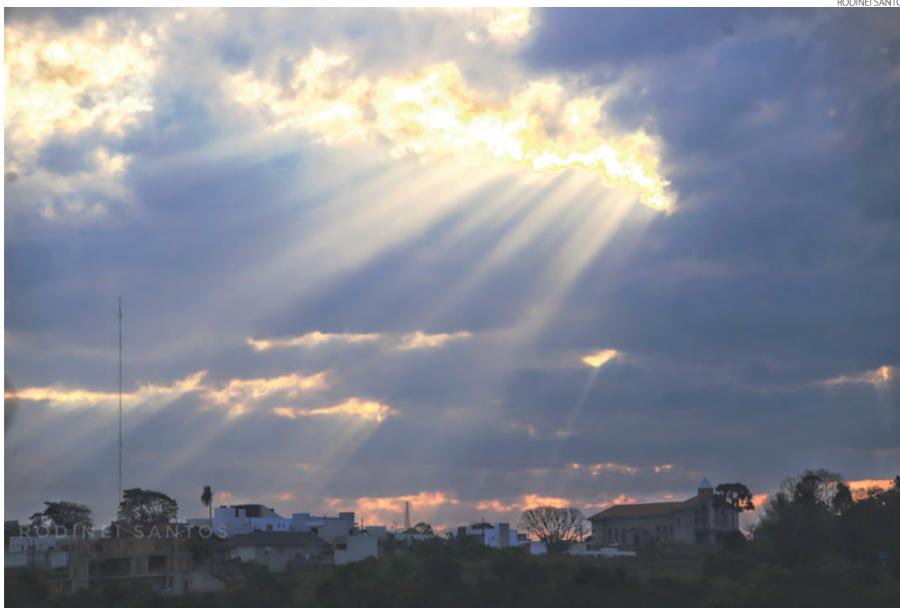
Registro dos raios de sol forçando a passagem entre as nuvens, enquanto o tempo se fechava anunciando a chuva, feito na terça-feira (16), em Pato Branco.