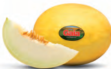
Melão Amarelo Gaia Kg