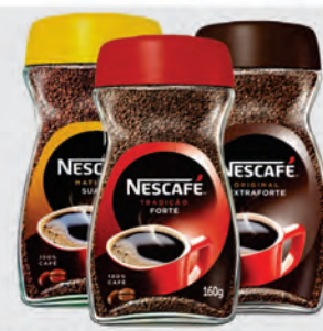
Café Solúvel Nescafé 160g Tradição, Matinal e Original