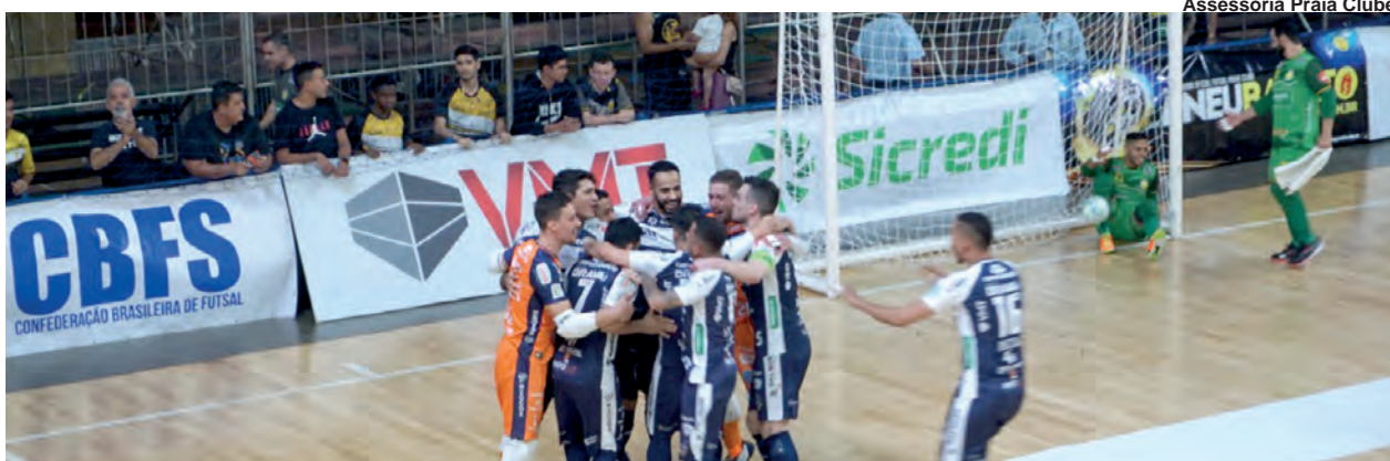
Assessoria Praia Clube

Com a primeira etapa concluída, Depatran deve realizar alterações no entorno do local e preparar as vias para o tráfego de veículos pesados. Outras mudanças também devem acontecer nos estacionamentos, além de implantar pontos de ônibus com placas fotovoltaicas em locais onde não há parada física para embarque e desembarque dos usuários. PÁG. 4