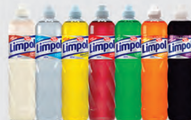
Detergente Líquido Limpol 500ml