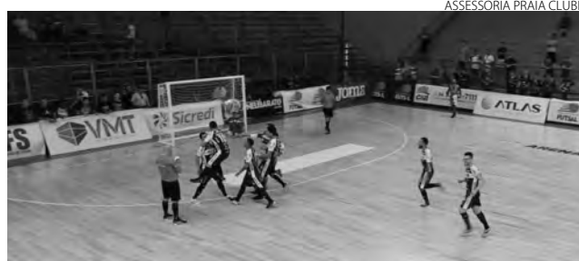
O Pato Futsal sofreu, mas conseguiu a classificação para a semifinal da Copa do Brasil