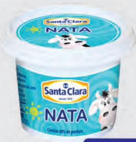
Nata Santa Clara 300g