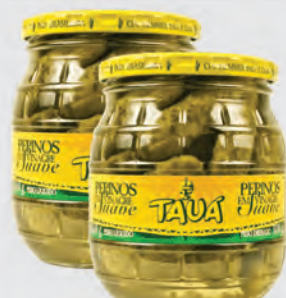
Pepino em Conserva Tauá 300g