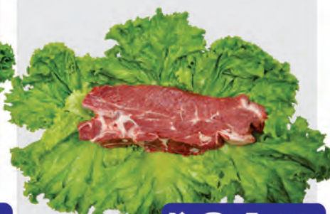
Filé Agulha Bovino Kg