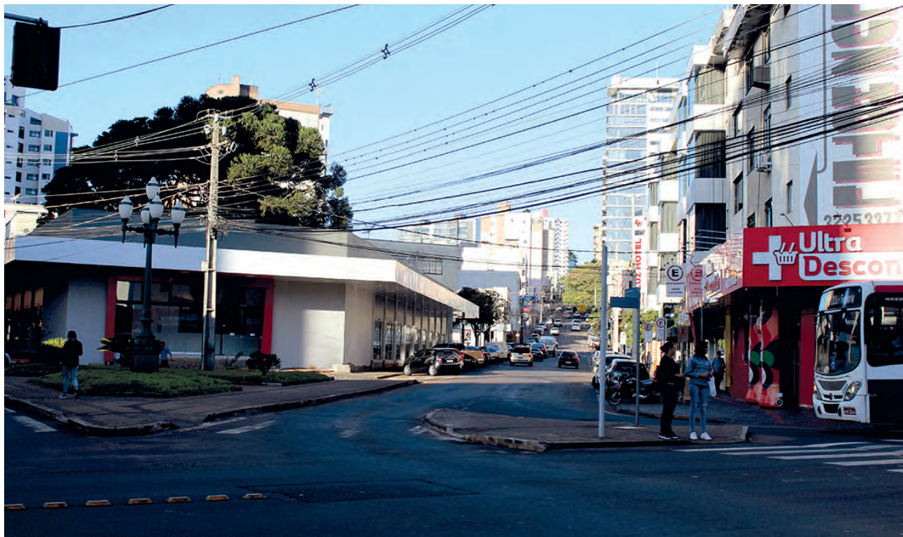
Vagas de estacionamento devem ser removidas do entorno do terminal

Com a implantação do novo terminal urbano, algumas mudanças devem