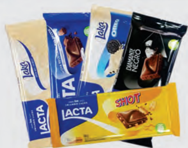
Chocolate em barra Lacta 90g