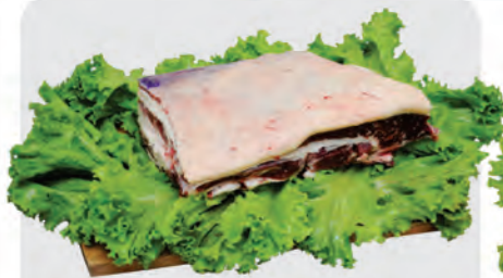
Costela Minga Bovina Kg