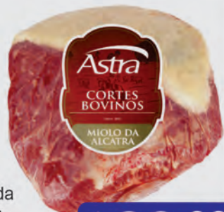
Miolo da Alcatra Bovina Astra Kg