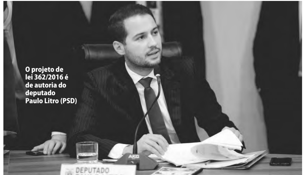
O projeto de lei 362/2016 é de autoria do deputado Paulo Litro (PSD)