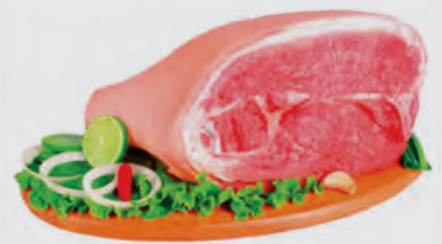
Pernil Suíno c/ Pele Kg