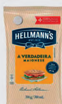
Maionese Hellmann's 700g