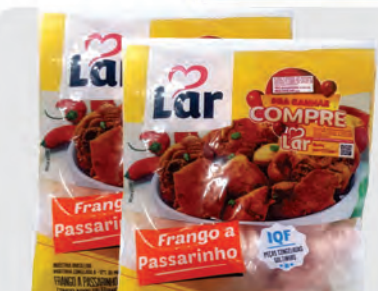
Frango a Passarinho Lar 700g