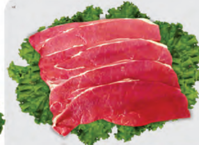
Bife Coxão Mole Bovino Kg