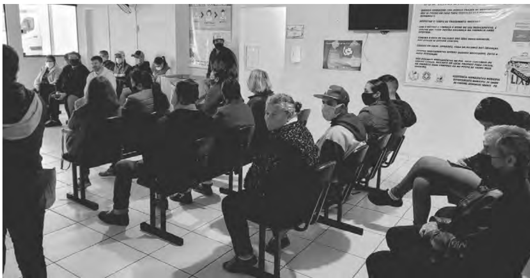
De acordo com o Departamento de Saúde, mudanças devem melhorar o acompanhamento integral e a atenção individualizada dos pacientes