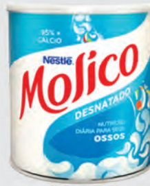
Leite em Pó Molico Desnatado 280g