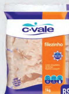
Filezinho Peito Frango Sassami C-Vale 1Kg