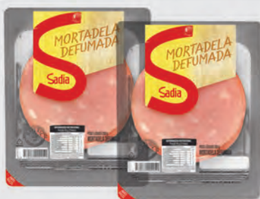
Mortadela Defumada Sadia Fatiada 200g