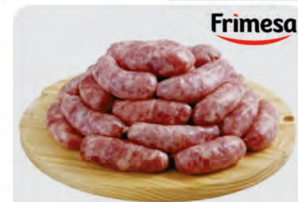
Linguíça Toscana Suína Frimesa Kg