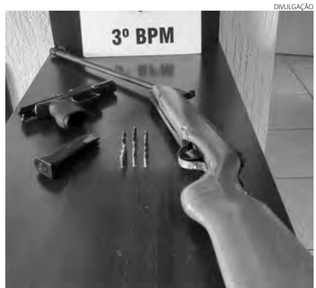
As armas e as munições que foram apreendidas no bairro São Cristóvão

A mulher informou que usualmente a arma estava com o autor, mas não soube informar o verdadeiro dono. Os policiais foram ao local de trabalho do acusado, mas ele não foi localizado. A espingarda foi apreendida e entregue na Delegacia da Polícia Civil. (AB)