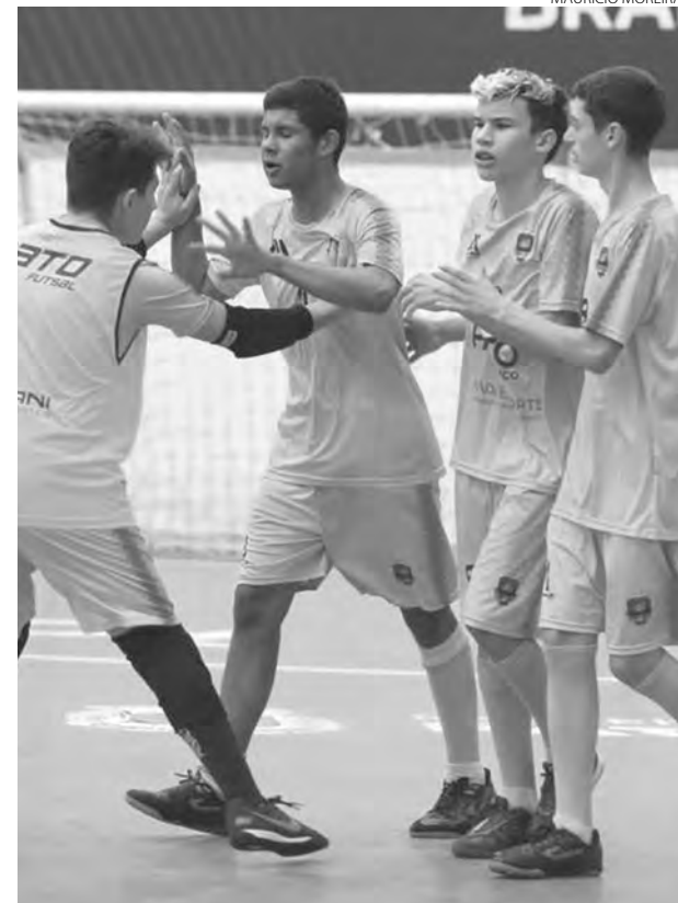
Base do Pato Futsal em ação na temporada 2022