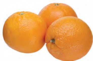
Laranja Bahia Importada Kg