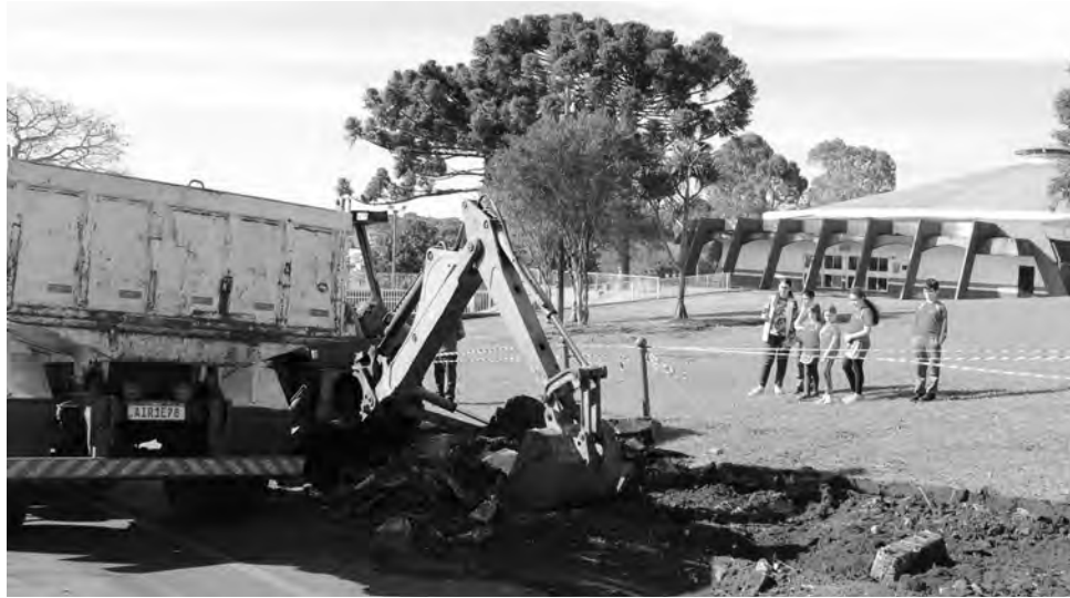
Estudantes encaminharam para o Legislativo petição em outubro de 2021

“Os alunos perceberam que por ser um local públi-