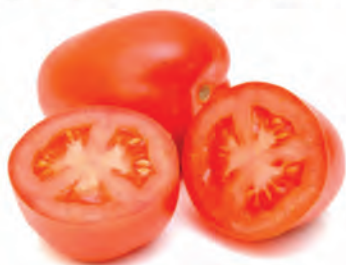
Tomate Saladete Kg