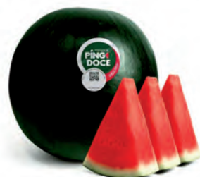
Melancia Pingo Doce Inteira Kg