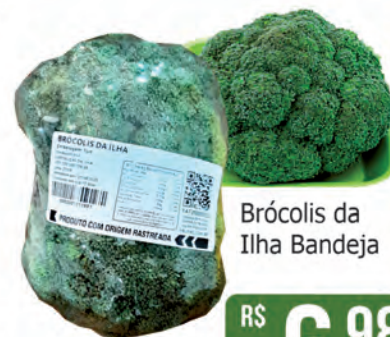
Brócolis da Ilha Bandeja