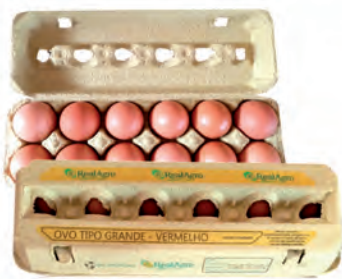
Ovos Vermelhos Grandes RealAgro Dúzia