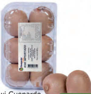
Kiwi Guepardo Importado Bandeja 600g