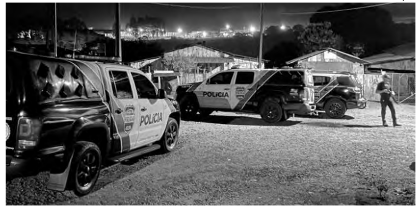
As prisões ocorreram em Quedas do Iguaçu, Francisco Beltrão e Palmas

A PCPR coletou registros de transações de compra e venda de pontos de droga e declarações da existência de negócios de fachada para camuflar a venda de drogas. Além disso, foram encontrados re-