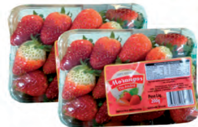
Morango Tio André Bandeja 200g