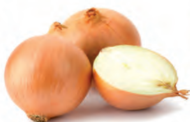
Cebola Nacional Kg