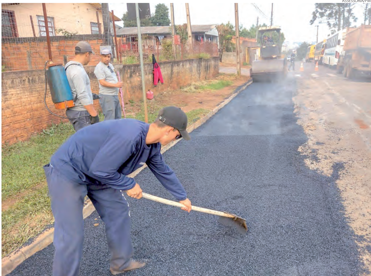
Equipes da Prefeitura de Francisco Beltrão trabalham na recuperação de ruas. As intervenções da secretaria de Viação e Obras ocorre em vários pontos da cidade.