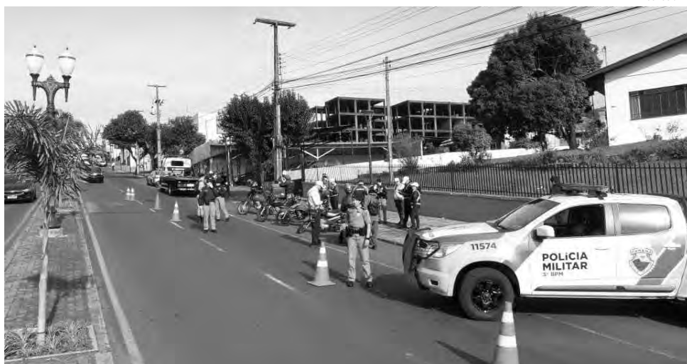
Blitz foi realizada na manhã de quarta-feira (6), na avenida Tupi, em Pato Branco

A fiscalização foi realizada com a participação de quatro Cadetes Policiais Militares, que se apresentaram na Unidade do 3º BPM para o início do estágio operacional, etapa do Curso de Formação de Oficiais sediado