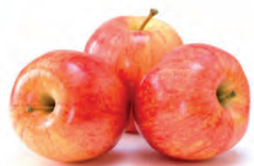
Maçã Fuji Tradicional Kg