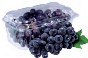
Uva Núbia Bandeja 500g