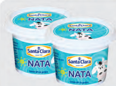
Nata Santa Clara 300g