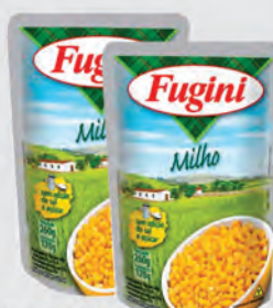
Milho Verde Fugini Sachê 170g