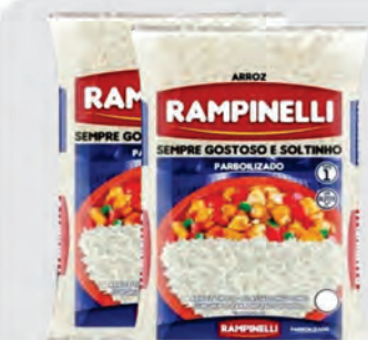
Arroz Parboilizado Rampinelli 5Kg