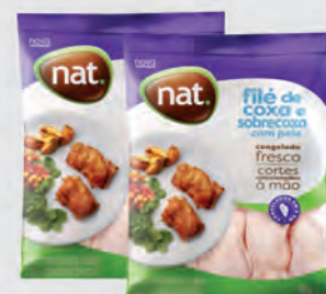
Filé de Coxa e Sobrecoxa Frango Nat 1Kg