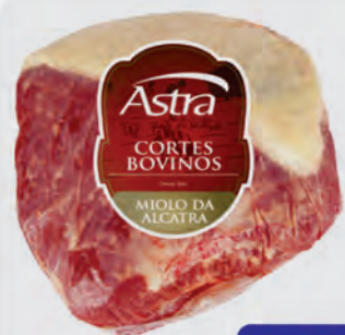
Miolo da Alcatra Bovina Astra Kg