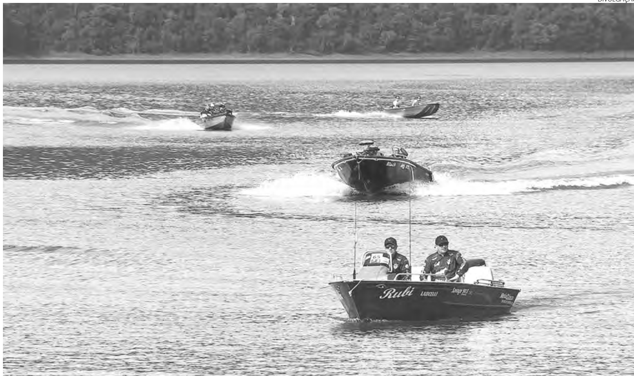
A abertura da competição será no dia 27 de agosto, em São Jorge D'Oeste