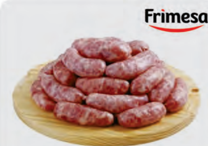
Linguiça Toscana Suína Frimesa Kg