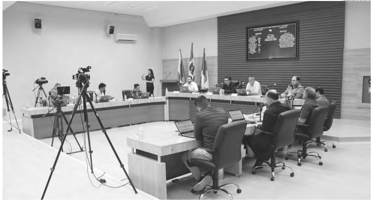
A expectativa do orçamento de Pato Branco, para 2023, é de R$ 525 milhões