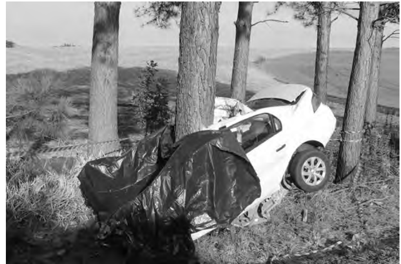
Com o impacto da colisão, o veículo transpassou a árvore

A 6ª Companhia da PRE já registrou neste mês, nas rodovias estaduais que cortam o Sudoeste 11 acidentes, com dois mortos e 11 feridos. No ano são 199 acidentes, com 50 mortos e 275 feridos.