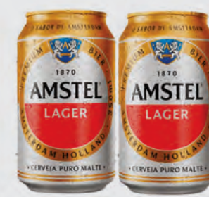
Cerveja Amstel Puro Malte 350ml