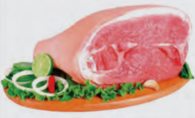
Pernil Suíno c/ Pele Kg