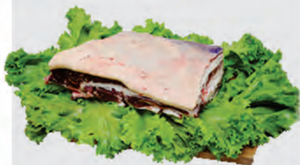
Costela Minga Bovina Kg