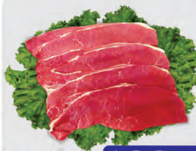
Bife Coxão Mole Bovino Kg