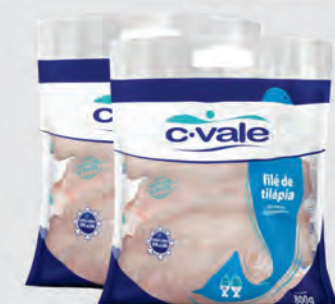
Filé de Tilápia C-Vale 800g