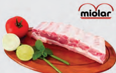
Costela Suína Miolar Temperada Kg