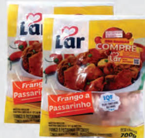
Frango à Passarinho Lar 700g