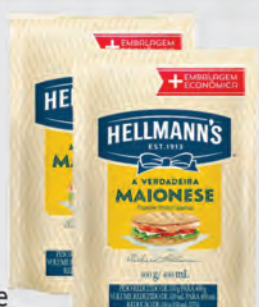
Maionese Hellmann's Tradicional Sachê 400g