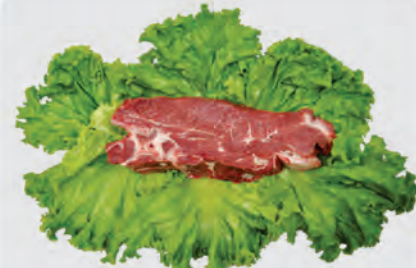
Filé Agulha Bovino Kg