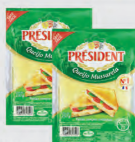
Queijo Mussarela Prêssident Fatiado 150g